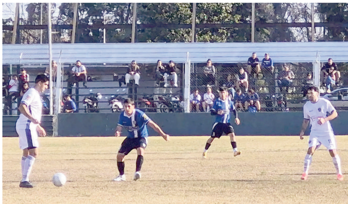
La Emilia hizo negocio al empatar en su visita a Somisa. EL NORTE

El "Náutico" derrotó a Gral. Rojo por 4 a 2, como visitante, en el partido de ida por las semifinales del Torneo Apertura. En tanto, el "Pañero" rescató un valioso punto al terminar 0 a 0 en el Barrio.