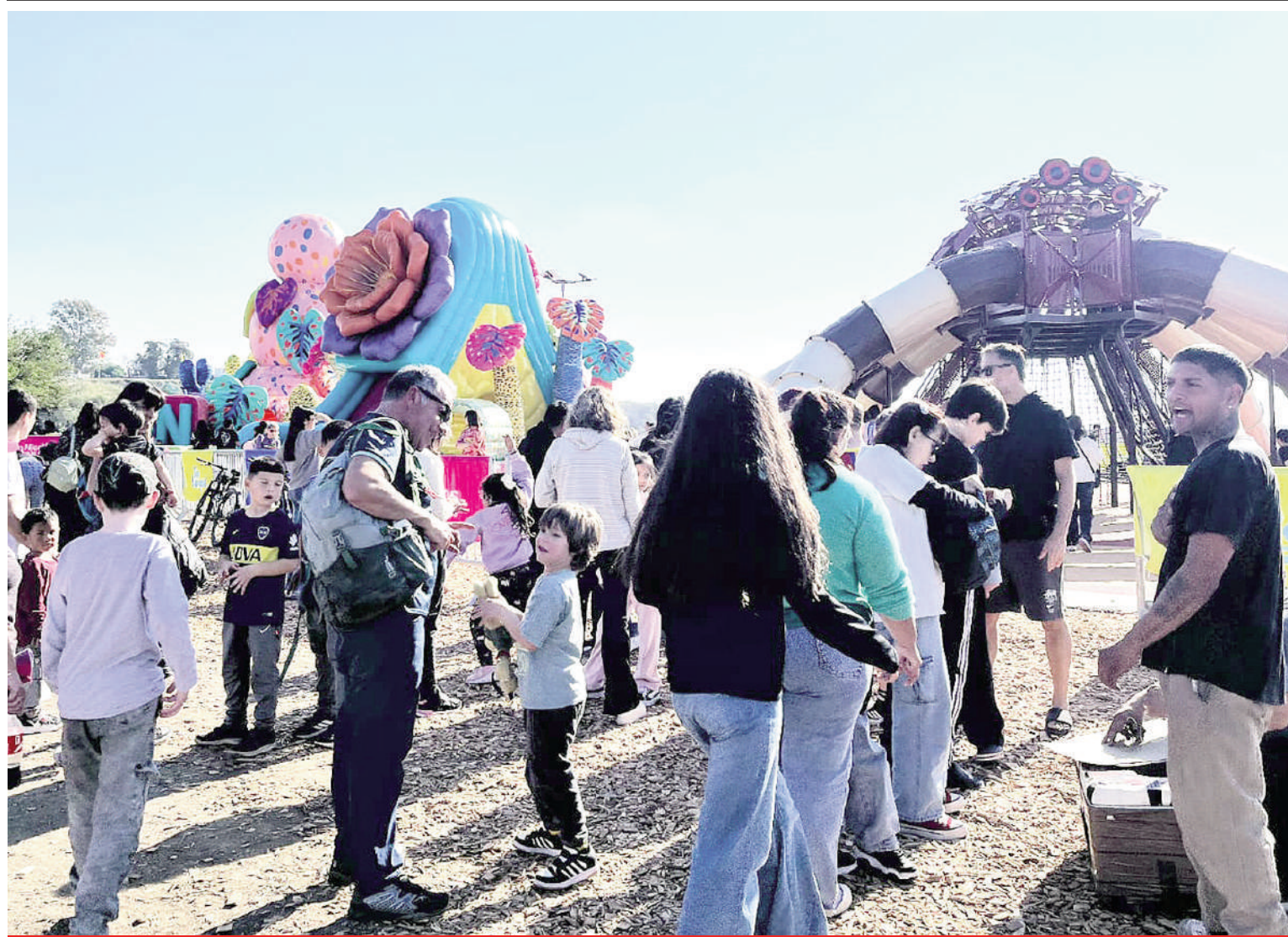
● ANTE MILES DE ASISTENTES, «SAN NICOLAND» EXPONE SU NUEVA FAUNA EN EL ECO PARQUE

Mediante un proyecto de resolución, el bloque de concejales alineado con la gestión municipal de Santiago Passaglia intenta trasladar a la Dirección Nacionalidad de Vialidad una serie de requerimientos vinculados con las necesarias mejoras en el acceso a la ciudad a través de la Ruta 9 en su intersección con Ruta 188. Piden una planificación, el diseño de obras e inversión para la ejecución de esos trabajos. Local 3