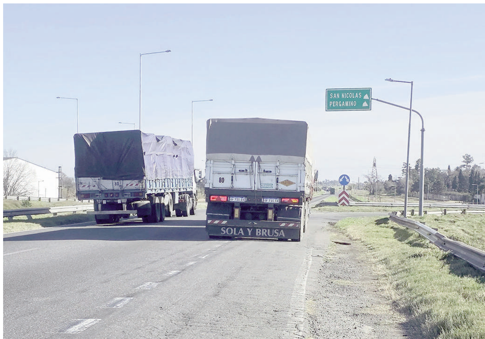
El nodo vial en la intersección de las rutas 9 y 188 conecta con la zona sur, el Predio Ferial y un importante sector logístico e industrial.

Entre las eventuales medidas a adoptar, los redactores de la iniciativa sugieren la evaluación de alternativas