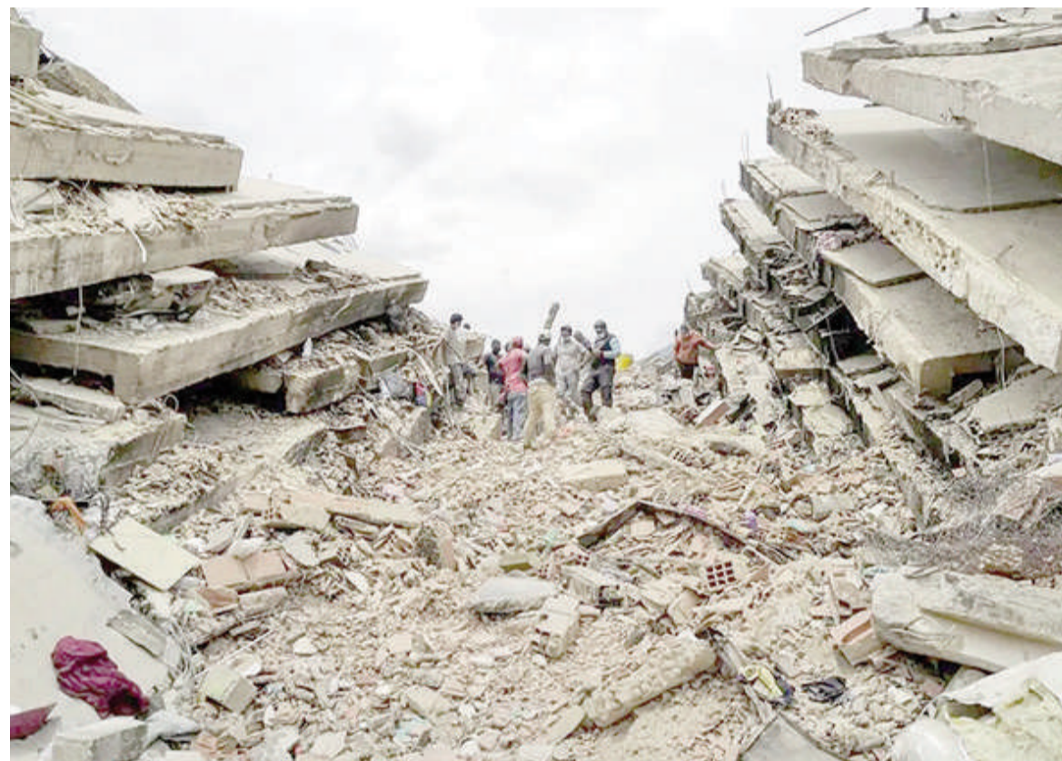
Sigue aumentando el número de víctimas en Venezuela.

A más de una semana del devastador doble terremoto en Venezuela, un nuevo reporte oficial dado a conocer este jueves elevó a 3889 el número de víctimas fatales.