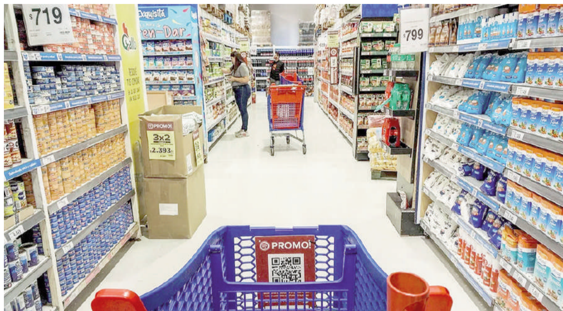
Las compras de alimentos y en supermercados siguen en caída.

Este retroceso no es un dato aislado, sino que se alinea con las mediciones de la Confederación Argentina de la Mediana Empresa (CAME) y de la consultora SCENTIA, que también reportaron bajas sig-