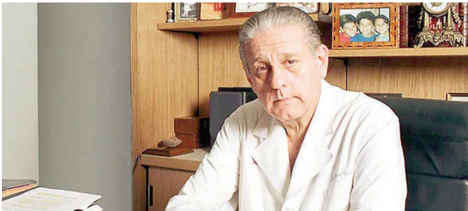
El Día Nacional de la Medicina Social recuerda el aniversario del nacimiento de René Favalaro.

Es en ese terreno donde la prevención cobra todo su sentido. Detectar temprano, informar, acompañar y facilitar el acceso a los controles no son gestos menores: son la forma más concreta de reducir desigualdades