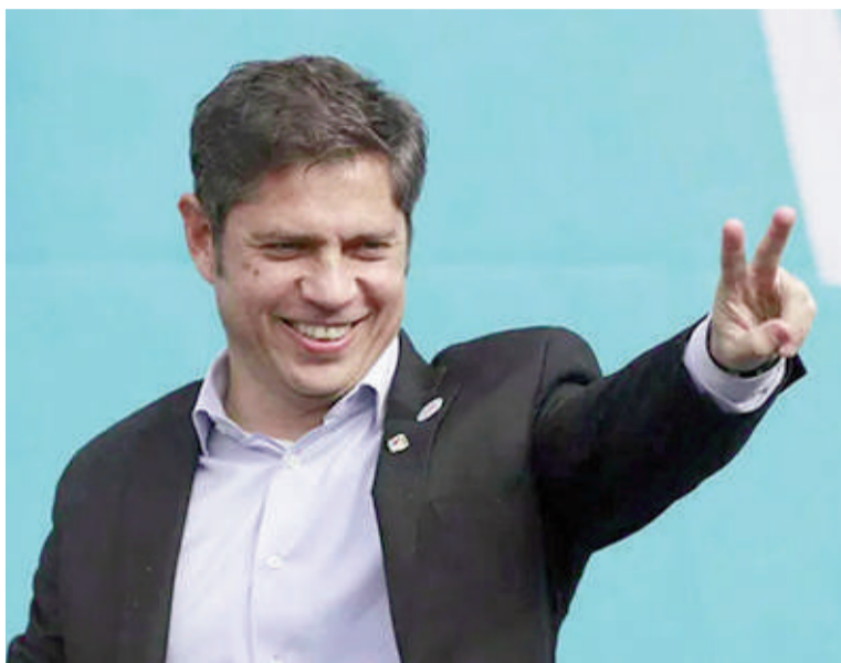
El gobernador Axel Kicillof.

El primero está vinculado a las expectativas: el 64% de los consultados manifiestan sentimientos negativos sobre el futuro del país. Es una tendencia que comenzó en noviembre de 2025 y se consolidó en 2026. Desde hace cuatro meses se