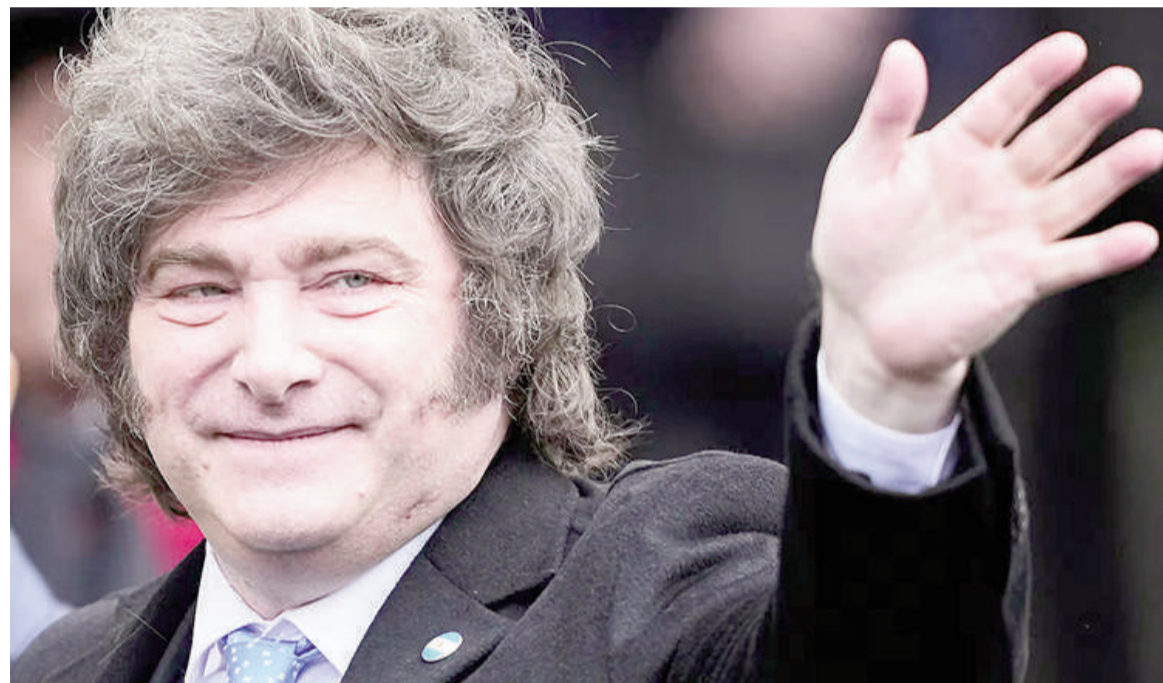
El Gobierno asegura que el viaje al Reino Unido está en los planes de Milei para este año.

De concretarse, sería el primer presidente en más de 25 años en desembarcar en Londres por una visita bilateral. En el Gobierno creen que el escenario ideal sería replicar el evento "Argentina Week" que se celebró en Nueva York.