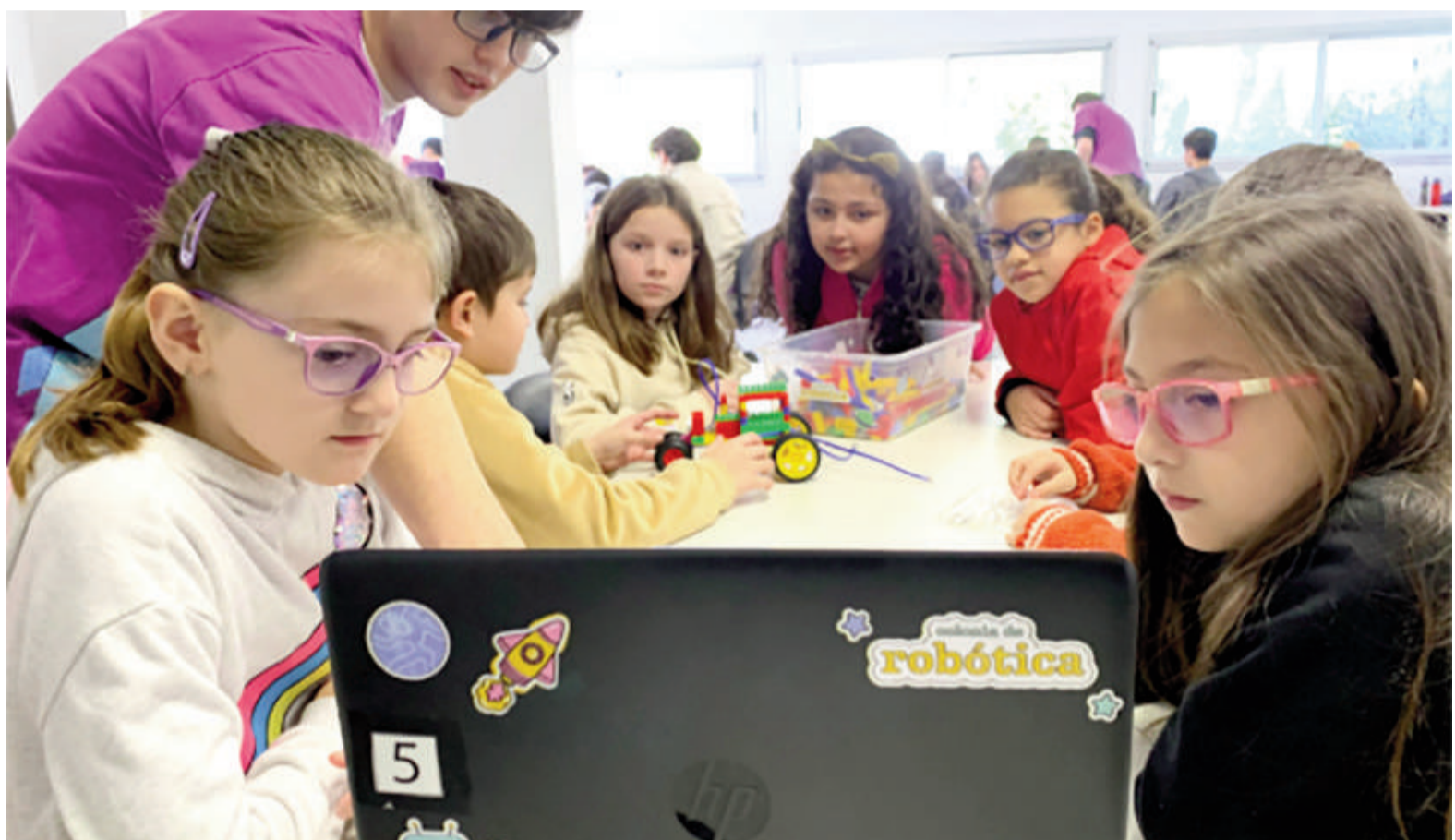
La Colonia de Robótica vuelve a convocar a cientos de chicos en estas vacaciones de invierno.

que en esta ocasión habrá una gran novedad: los participantes podrán elegir el nivel ideal según su experiencia. Se consideró que más de 1850 alumnos ya fueron parte de esta propuesta en ediciones ante-