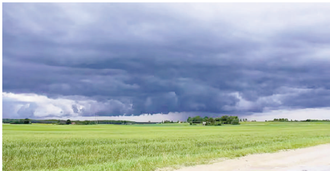
Llegaría un Niño “bueno”.

Aunque todavía hay incertidumbre sobre la intensidad que finalmente alcanzará El Niño por cambios en la forma en que se mide el calentamiento del océano Pacífico, la Argentina podría encaminarse hacia un escenario muy favorable para la producción agrícola. Así lo plantea un informe de la Guía Estratégica para el Agro (GEA) de la Bolsa de Comercio de Rosario (BCR), que proyecta un fenómeno fuerte e incluso con posibilidades de convertirse en muy fuerte justo durante los meses críticos para la definición de los rindes de maíz y soja. La duda no está puesta en la ocurrencia del fenómeno, sino en la forma de medir su intensidad. Según explicó la entidad, la Administración Nacional Oceánica y Atmosférica de Estados Unidos (NOAA) modificó este año los índices que utiliza para seguir el calentamiento superficial del Pacífico. Hasta ahora se usaba el ONI, pero desde febrero comenzó a reemplazarse por el RONI,