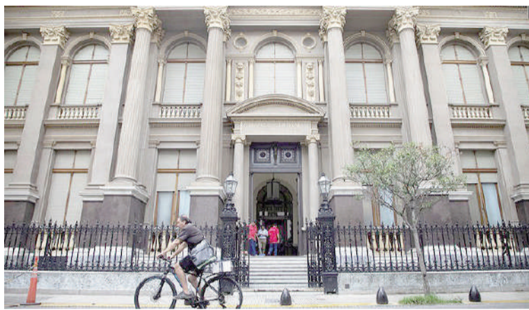
El BCRA anunció una refinanciación de préstamos con bancos internacionales.

En rigor, lo que anunció el Central es la terminación de los créditos REPO anteriores (acumulaba tres préstamos de este tipo, oficializados en enero y junio de 2025 y en enero de este año) y que tenían como plazo de pago fechas entre octubre de 2026 y abril de 2027.