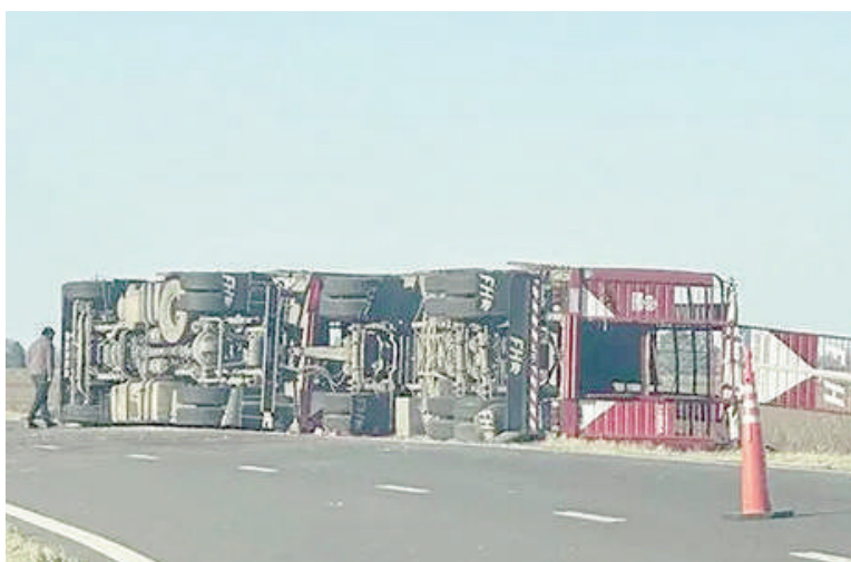
Un camión cargado de porcinos volcó en la ruta 8.

En el lugar trabajaron efectivos del Destacamento de Seguridad Vial, personal de la Comisaría Segunda y de Gendarmería Nacional, quienes ordenaron el tránsito y