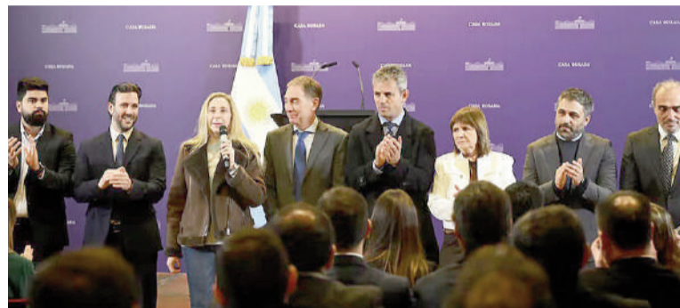
La foto que difundieron desde el oficialismo para destacar el empoderamiento que tuvo Karina Milei.

Consciente de su alcance, Karina Milei amplió su red e intensifica los esfuerzos por consolidar las lealtades entre los legisladores violetas. A su