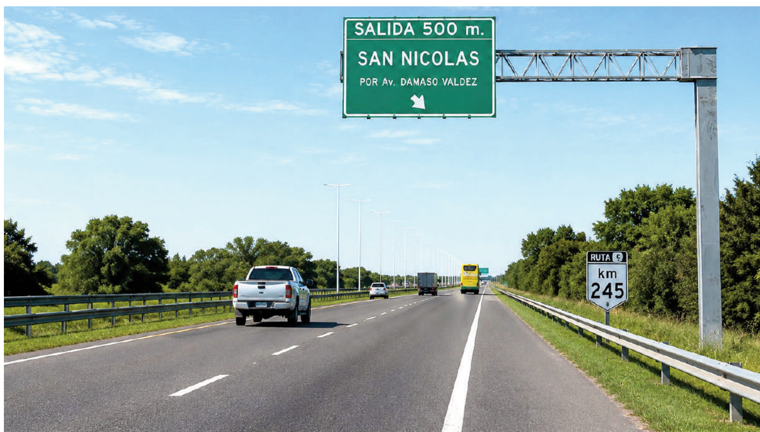
Este lunes se conocerá qué tarifas plantean para los peajes de las rutas 9 y 188 los siete oferentes que siguen en carrera en la licitación.

Las otras seis ofertas que siguen en pie son las presentadas por las UTE: IEB Construcciones S.A.-Trading MRG S.A.U.; CPC S.A.; Basaa S.A.-Cecosa S.A.; Concret Nor S.A.-Marcalba S.A.-Pose S.A.-Coarco S.A.; Paolini Hnos. S.A.-Semi S.A.-C&E Construcciones S.A.-Constructora Dos Arroyos S.A.; y Panedile Argentina S.A.I.C.F.E.I.-Supercimiento