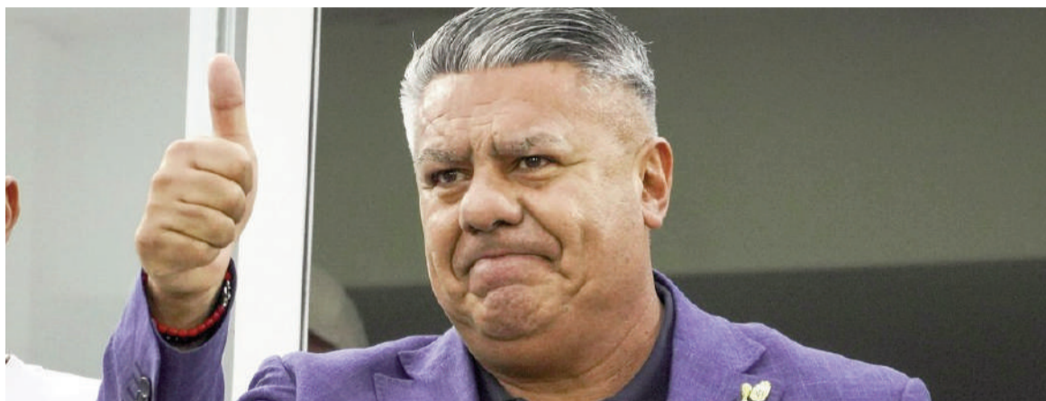
Claudio «Chiqui» Tapia, presidente de AFA.

Según la documentación recopilada, la empresa movió al menos 260 millones de dólares en cuentas abiertas en cinco entidades financieras estadounidenses: Citibank, Synovus, Bank of America, JP Morgan y PNC Bank.