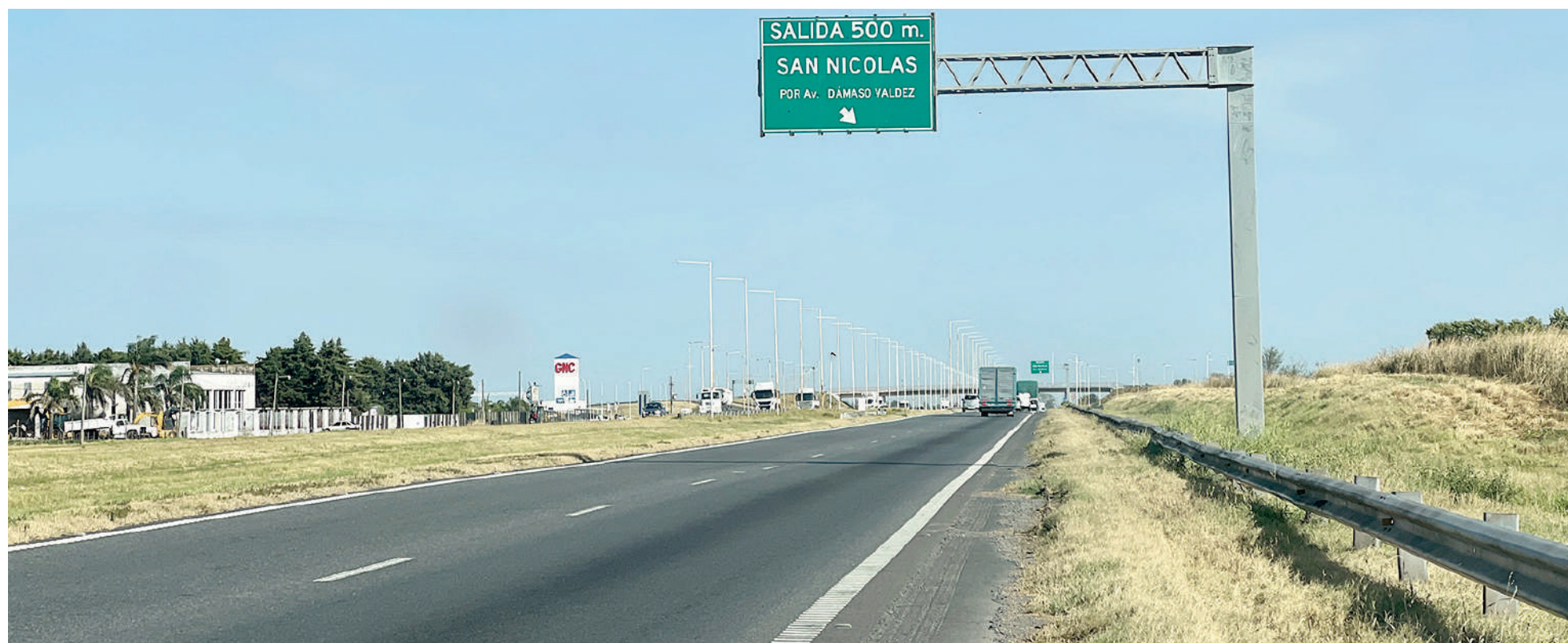
El «Tramo Portuario Sur» incluye los segmentos de las rutas 9 y 188 que atraviesan el Partido de San Nicolás.

La propuesta más competitiva fue la presentada por la firma «Creditech SA», con un peaje de $1256,03 más IVA (con el impuesto computado, los usuarios abonarían $1519,80) para las estaciones que se creen en el denominado «Tramo Portuario Sur», que se extiende sobre la Ruta 9 desde Campana hasta el Arroyo del Medio y sobre la 188 desde el Puerto de San Nicolás hasta la localidad pampeana de Realicó. Los sobres con las proposiciones económicas de las siete oferentes fueron abiertos el lunes en el Ministerio de Economía de la Nación.