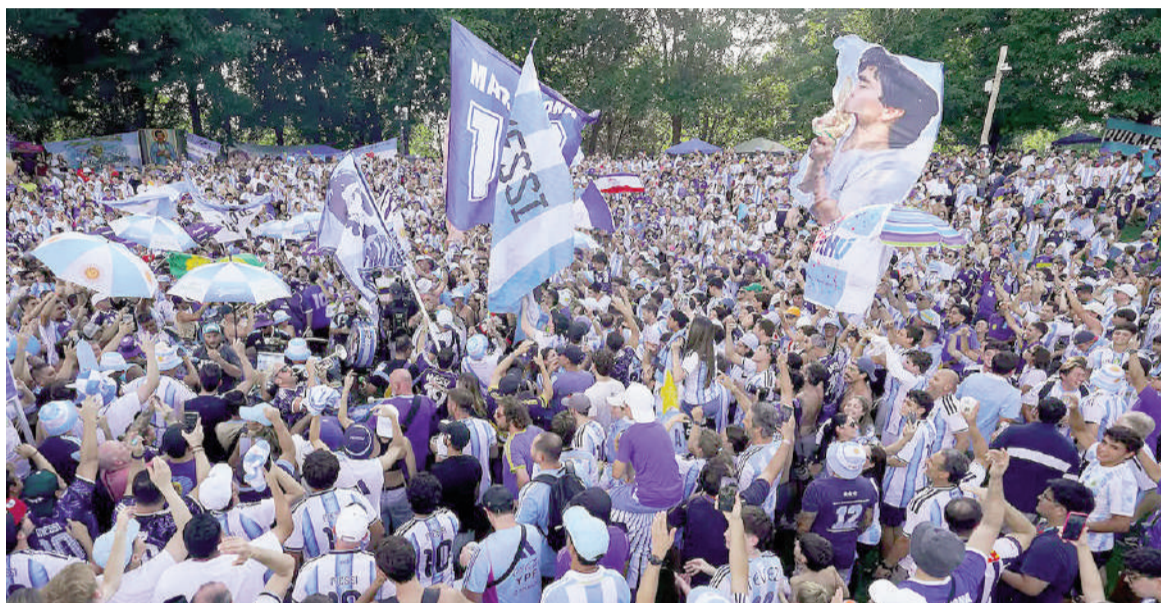
El Mundial deja al descubierto algo que trasciende al fútbol: nuestra necesidad de pertenecer.

Vivimos en una época que celebra la individualidad. Elegimos qué escuchar, qué consumir, qué pensar, qué serie mirar y hasta qué noticias recibir. Los algoritmos nos conocen tan bien que construyen una experiencia distinta para cada uno. Nunca fue tan fácil vivir dentro de un universo personalizado. Como antídoto,