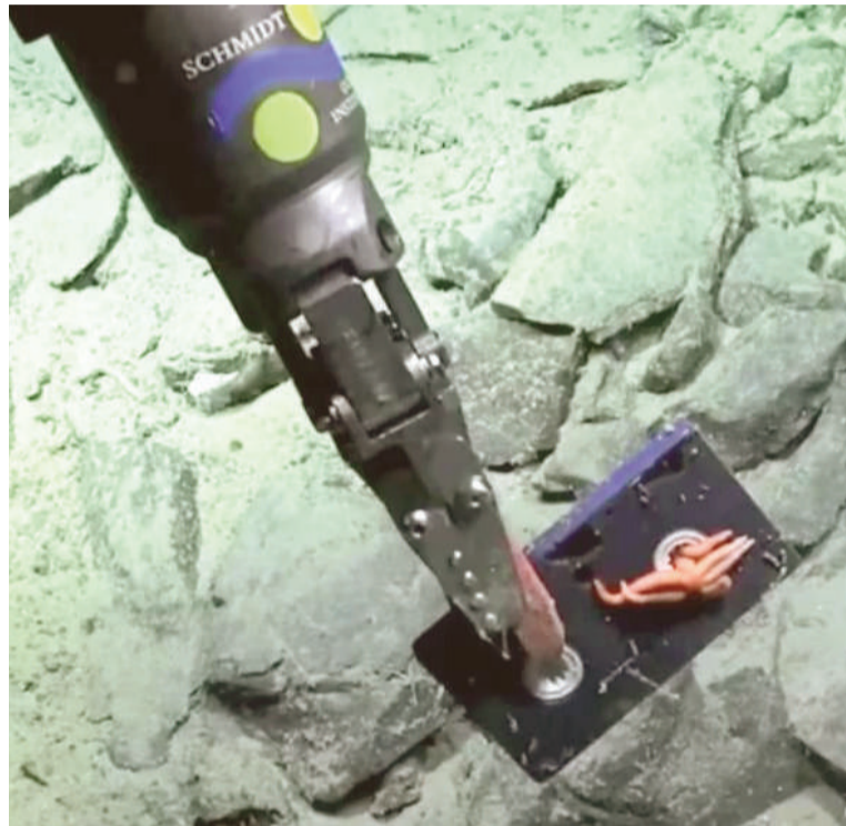
Hasta un casete VHS fue hallado a 2643 metros de profundidad.

y el 10 de enero de 2026, el equipo navegó a bordo del buque científico Falkor (too), del Instituto Oceánico Schmidt de los Estados Unidos, en una expedición llamada “Vida en los extremos”. El robot submarino fue el ROV SuBastian, un vehículo operado a distancia desde la superficie que grabó el fondo del mar en video 4K Ultra HD de forma continua durante 17 inmersiones.