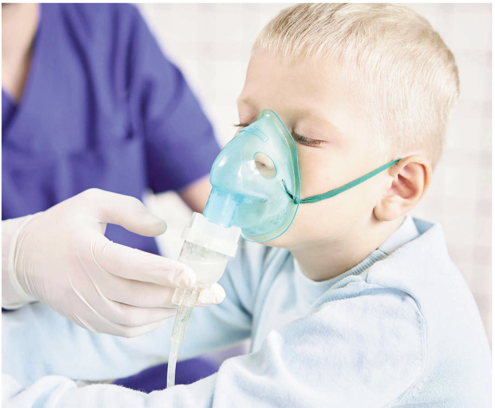
Las infecciones en los pulmones y las vías respiratorias representan una de las principales causas de complicación médica en menores de un año.

Desde la entidad sanitaria local indicaron que “se notó un ascenso de la atención por este tipo de patologías a mediados del mes de mayo. En estos días (últimas dos semanas) se ve un descenso de atenciones por esta patología, pero se mantienen estables”. También se incrementaron los requerimientos de atención por casos de afecciones respiratorias en el ámbito de la cobertura privada de salud, según señalaron desde el sector.