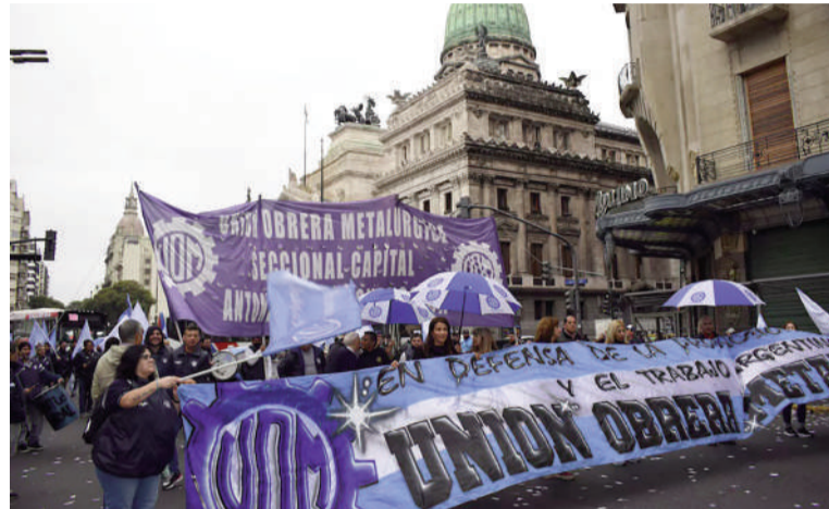
La Justicia Laboral tuvo que intervenir para destrabar la paritaria de la UOM.

Esa respuesta finalmente la brindó la Sala VIII de la Cámara Nacional de Apelaciones del Trabajo, que este lunes rechazó el pedido del Gobierno