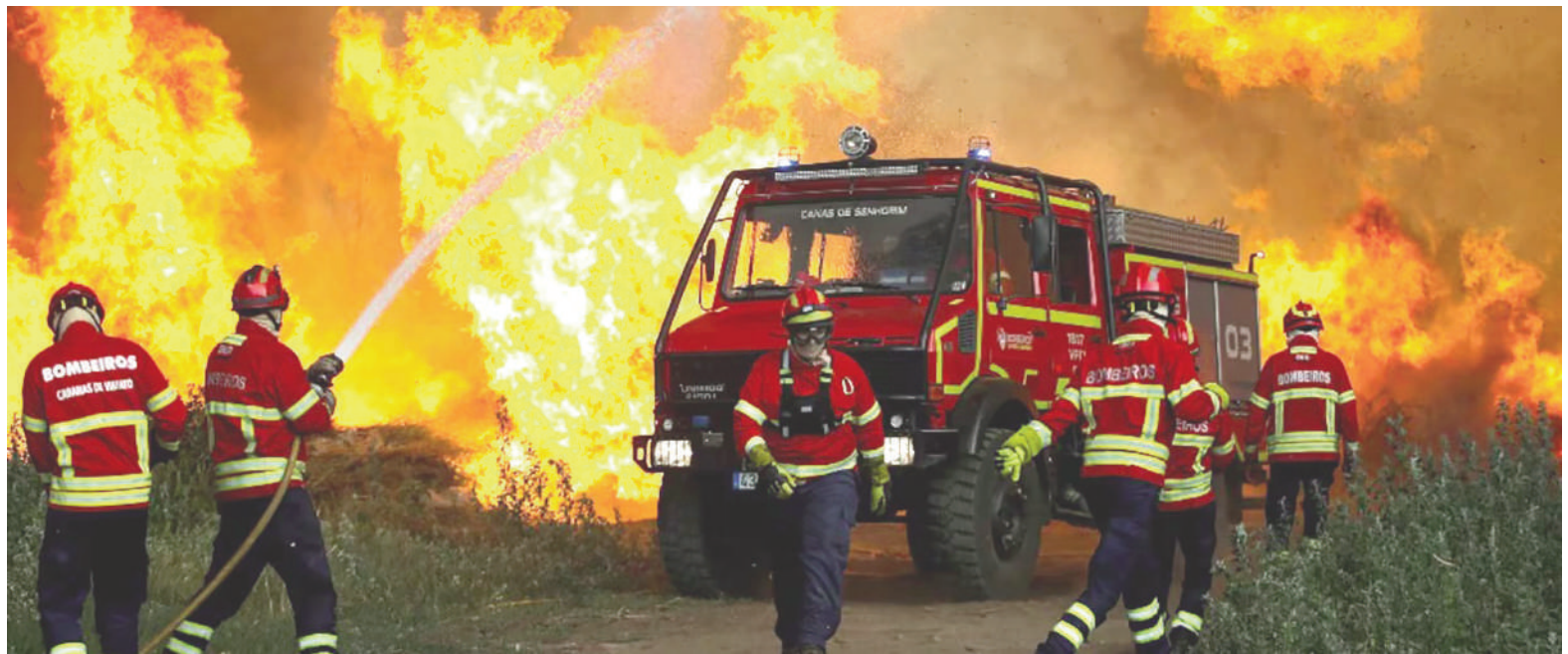
Los bomberos combaten las llamas del incendio forestal de Vouzela en Cercosa, una parroquia del municipio de Mortagua, Portugal.

Ante la llegada de más fenómenos meteorológicos extremos, el ministro del Interior francés, Laurent Nuñez, recordó que los incendios forestales estivales comenzaron un mes antes de lo habitual.