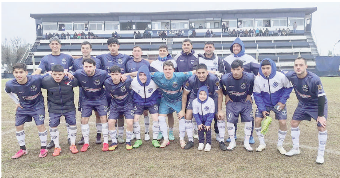
El conjunto del barrio lo dio vuelta ante el "Tucura" y está en semis.