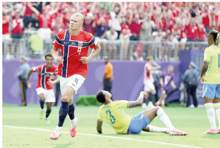
Erling Haaland fue la figura del conjunto nórdico.

Tras ese arranque intenso, el partido perdió dinamismo durante varios pasajes del primer tiempo y Brasil generó una de sus pocas ocasiones con un disparo de Vinicius que no encontró destino de gol, mientras