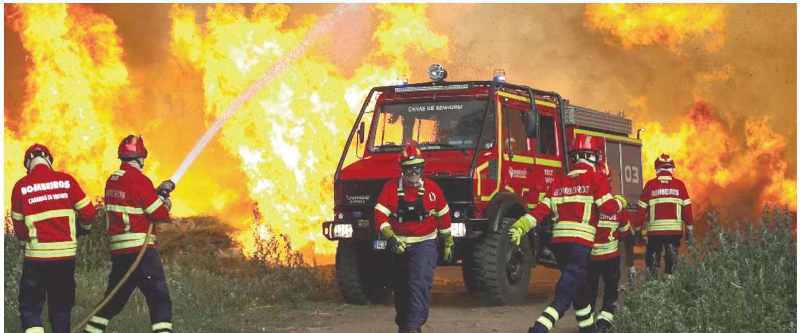
Los bomberos combaten las llamas del incendio forestal de Vouzela en Cercosa, una parroquia del municipio de Mortagua, Portugal.

Ante la llegada de más fenómenos meteorológicos extremos, el ministro del Interior francés, Laurent Nuñez, recordó que los incendios forestales estivales comenzaron un mes antes de lo habitual.