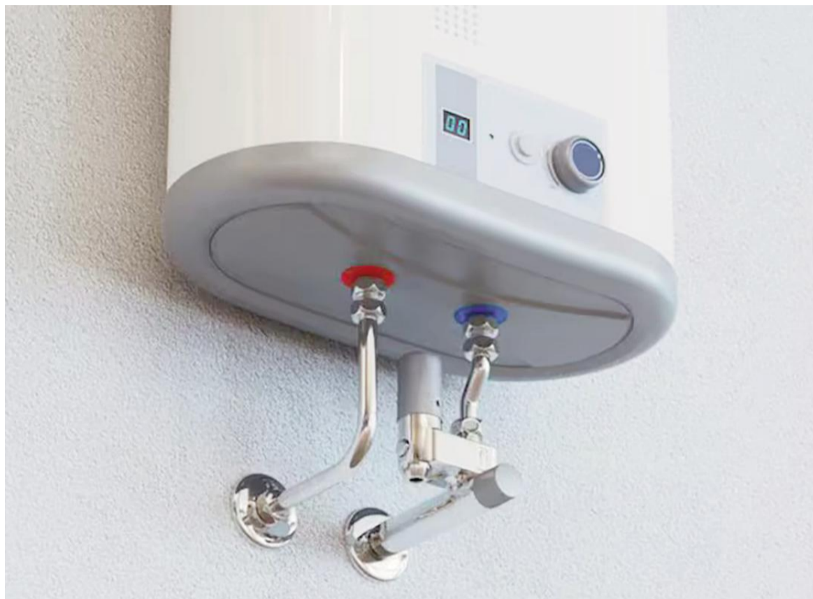
Los expertos recomiendan tener mucho cuidado a la hora de dejar el calefón eléctrico conectado.

Los calentadores eléctricos son tanques que calientan y acumulan agua y la mantienen a determinada temperatura a través de una re-