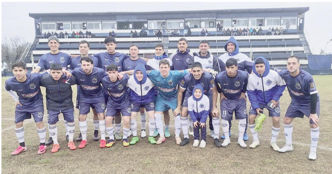
El conjunto del barrio lo dio vuelta ante el "Tucura" y está en semis.