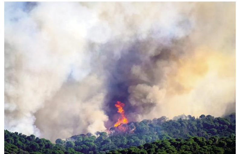
Vista del incendio forestal de La Bisbal de l'Empordà, en la Costa Brava catalana.

del país y que alberga a más de 700.000 habitantes en su área metropolitana. Un fuerte olor a plástico quemado impregnó esa ciudad del norte de Grecia.