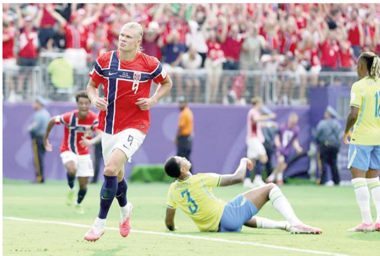
Erling Haaland fue la figura del conjunto nórdico.

Tras ese arranque intenso, el partido perdió dinamismo durante varios pasajes del primer tiempo y Brasil generó una de sus pocas ocasiones con un disparo de Vinicius que no encontró destino de gol, mientras