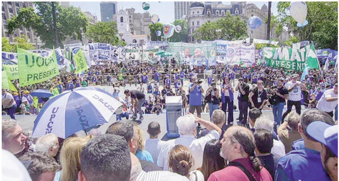
La CGT marchará el 22 de julio frente al Congreso.