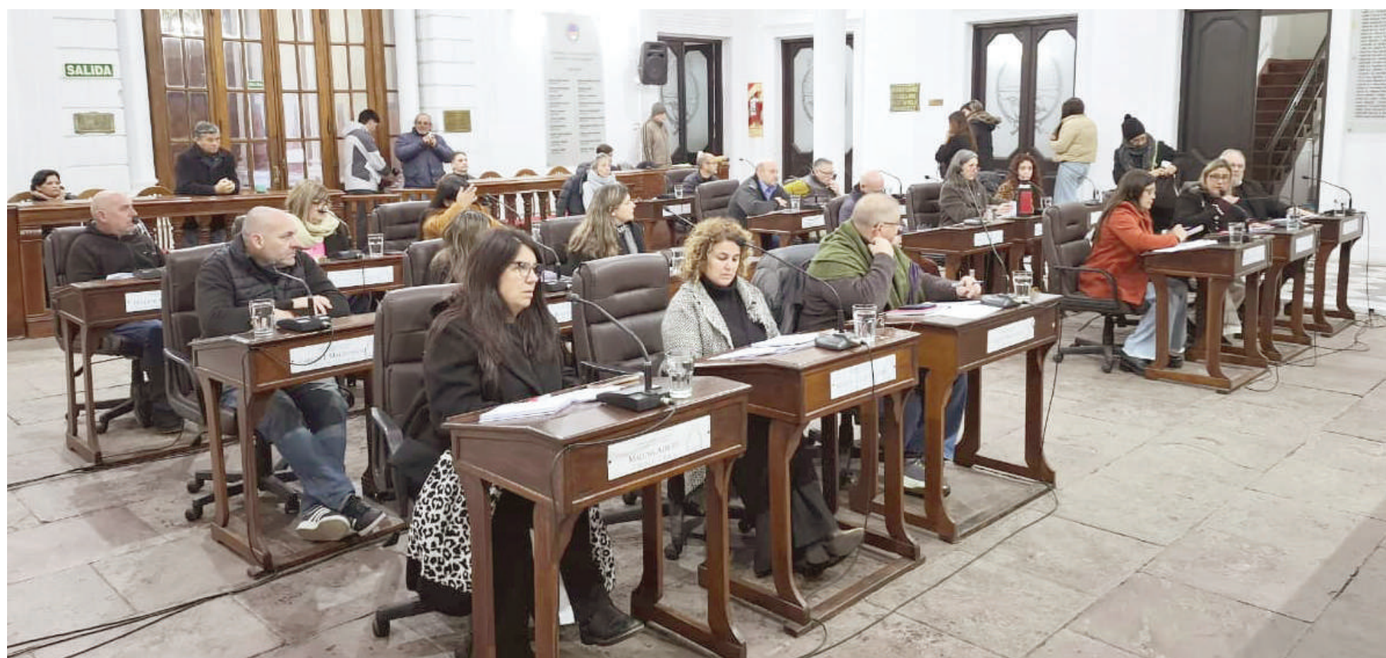
El proyecto se aprobó con votos afirmativos de Fuerza Patria y Hechos y con las abstenciones de los dos bloques libertarios. EL NORTE

Por unanimidad y sobre la base de una iniciativa impulsada por miembros del bloque de Fuerza Patria, el Concejo Deliberante de San Nicolás aprobó un proyecto de resolución que repudia la avanzada del Gobierno nacional contra el régimen de Zona Fría, el cual anula beneficios tarifarios para usuarios de San Nicolás y otros distritos de la provincia de Buenos Aires. Aunque no votaron en contra del proyecto local, los concejales libertarios optaron por abstenerse.