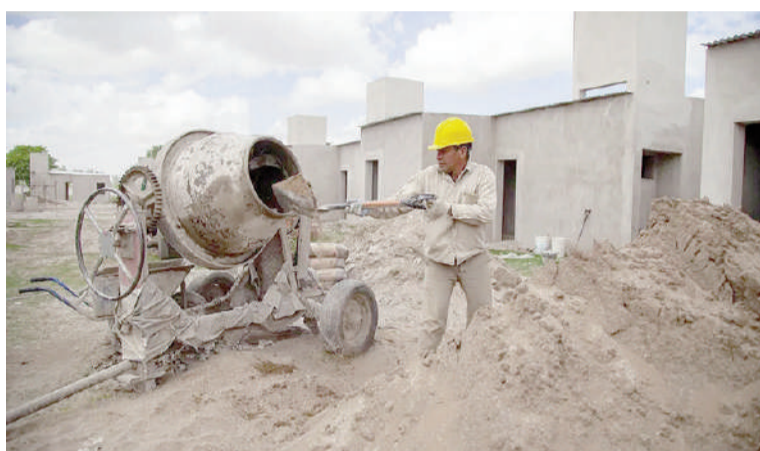
La construcción, un motor para la economía.

cuesta cualitativa de la construcción provistos por el Indec expusieron las perspectivas de los grandes empresarios para el trimestre comprendido entre junio y agosto de 2026. Entre las compañías dedicadas principalmente a obras privadas, el 67,3% previó que el nivel de actividad no cambiará, el 18,3%