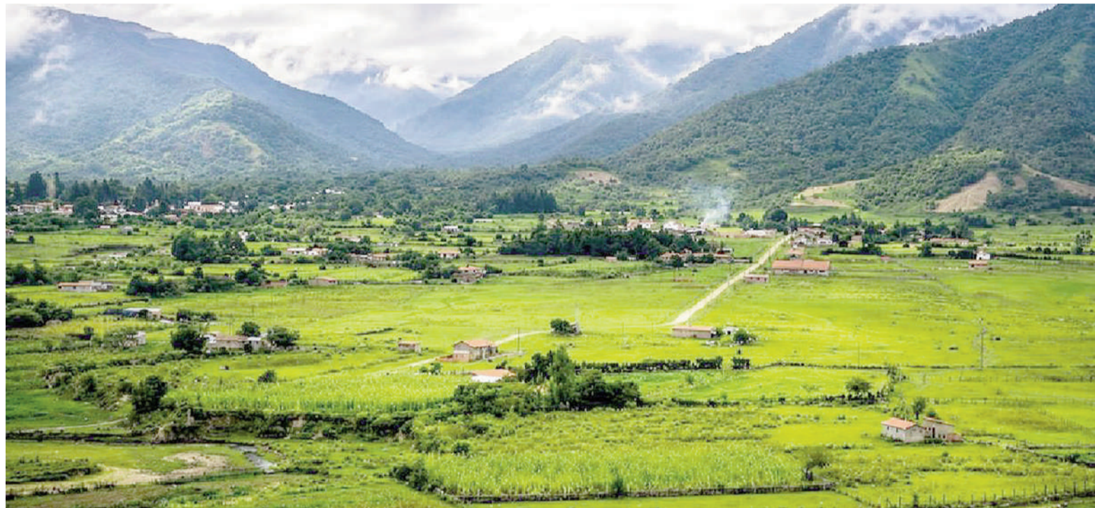
Los Toldos es un pueblo ubicado en Salta con apenas 2300 habitantes.

El camino desde el interior de la Argentina es complejo debido a las características del terreno y las dificultades de conectividad.