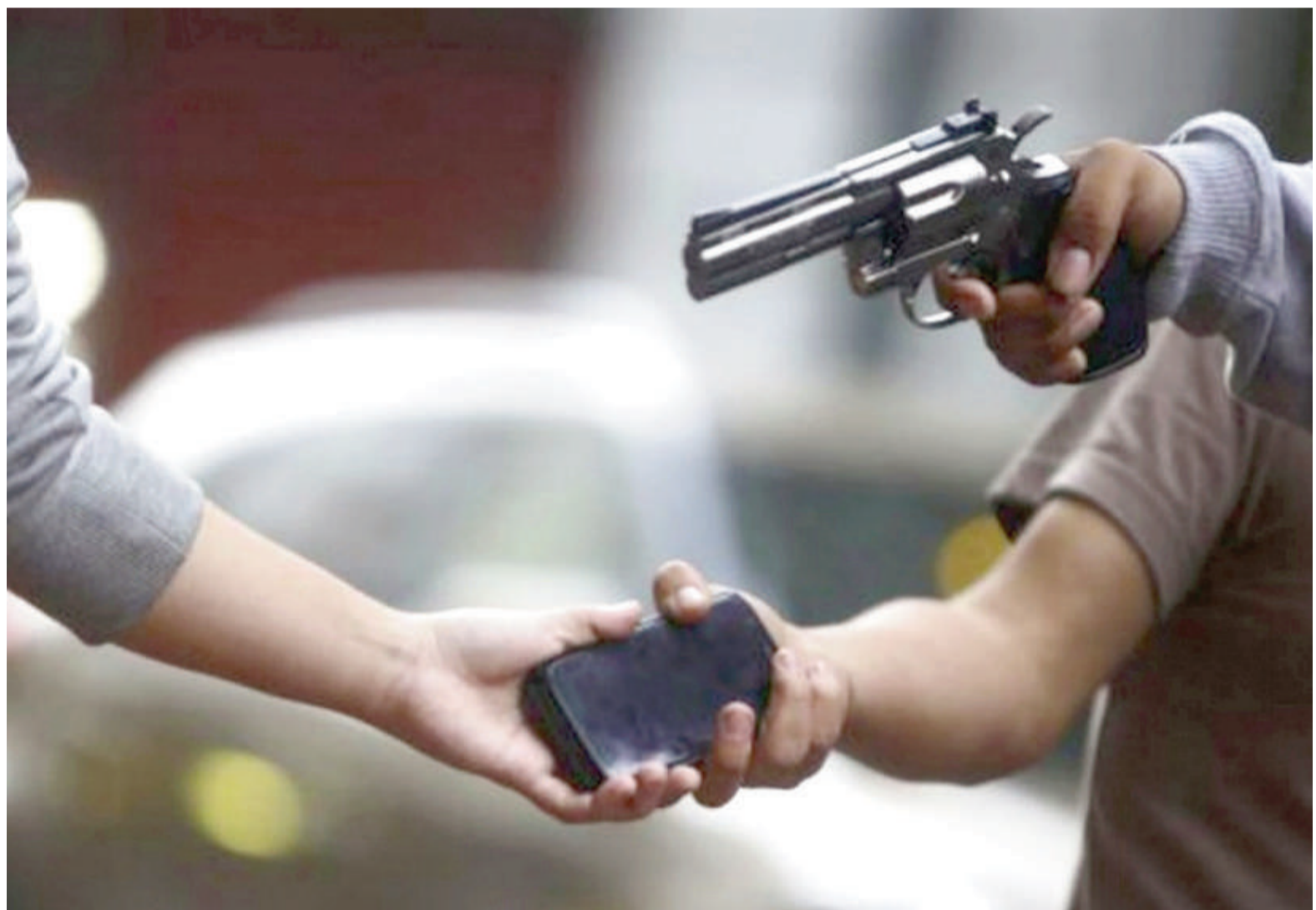
El robo agravado por el uso de arma (regulado en el Código Penal de la Nación Argentina) establece penas que van desde los 5 hasta los 15 años de prisión. ILUSTRACIÓN

Esa proporción resultó más alarmante en el conjunto de departamentos judiciales que inte-