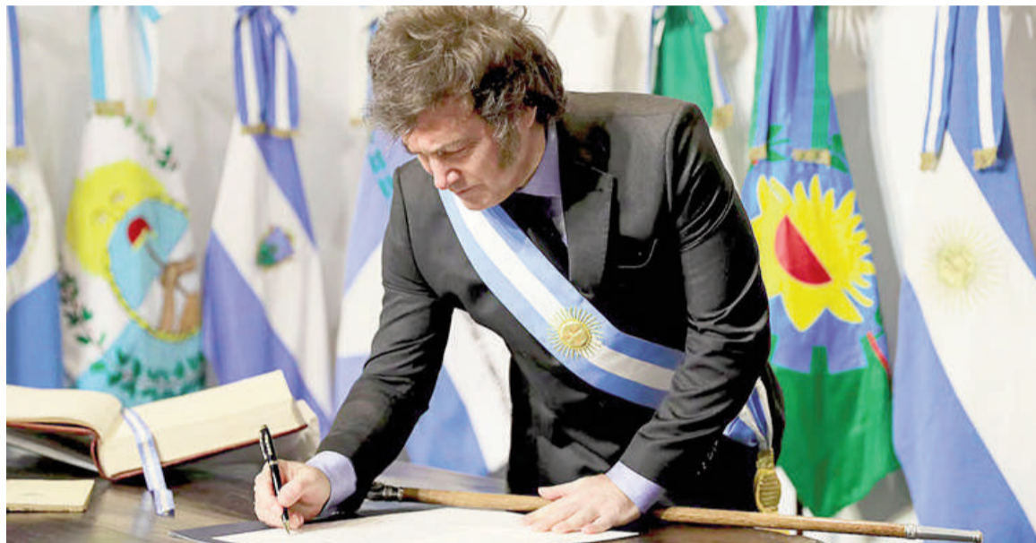
Al igual que en 2024, el Gobierno buscó una foto de respaldo político para avanzar con reformas en el Congreso.

En una escena similar a la que se vio en su ceremonia de jura en la Casa Rosada, Santilli logró una convocatoria que incluyó a los