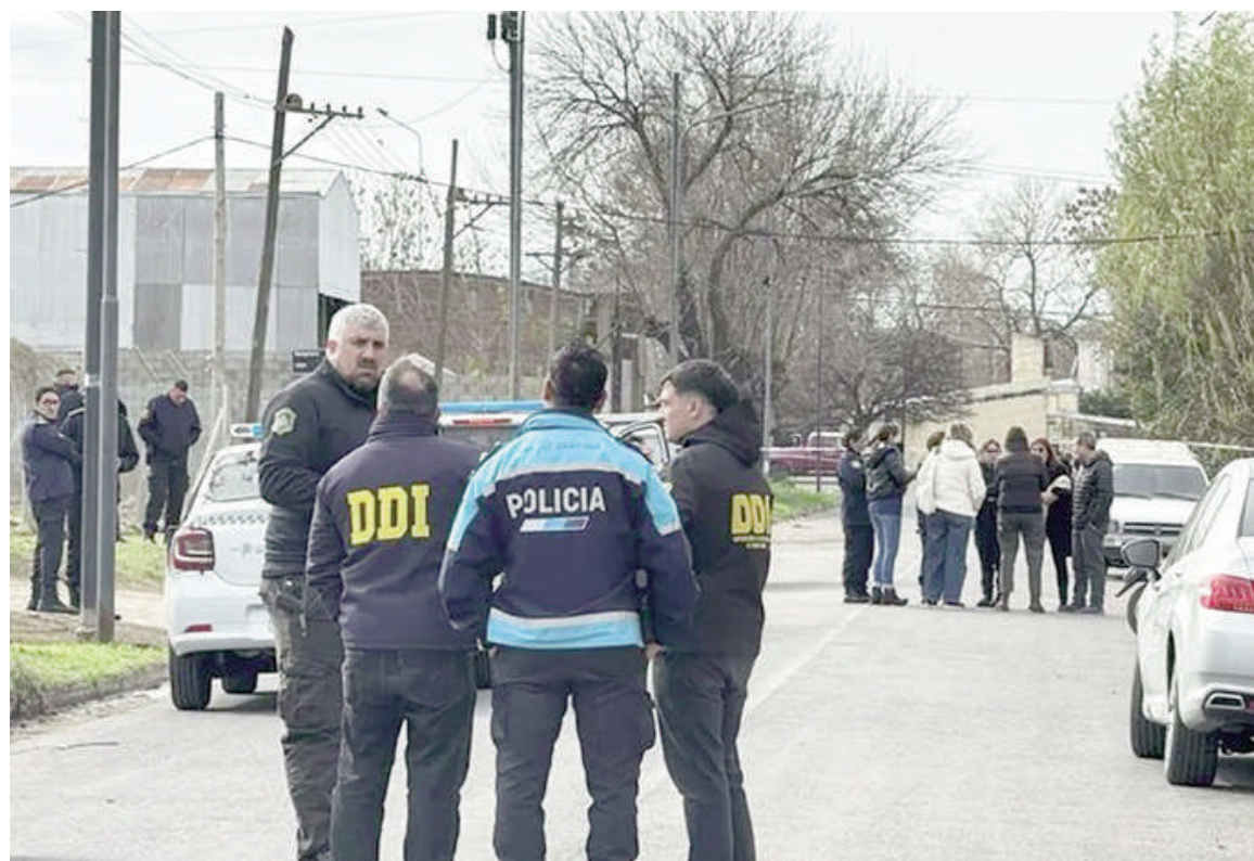
La cuadra del horror, donde fue encontrada la víctima del femicidio.