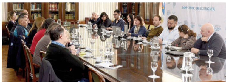
UPCN, Suteba y la FEB aceptaron propuesta paritaria.

Tras confirmarse el acuerdo paritario, el ministro de Economía bonaerense, Pablo López, sentenció: «Gracias al diálogo y al trabajo con los gremios, alcanzamos un nuevo acuerdo de aumento salarial para trabajadores docentes y de la Ley 10430 de 7%, 5% en julio y 2% en agosto. En la gestión de @Kicillofok seguimos mejorando las condiciones laborales del estado bonaerense». En el ámbito docente, la FEB aprobó la propuesta, mientras que el Sindicato Unificado de Trabajadores de la Educación de Buenos Aires (SUTEBA) analizaba seguir el mismo camino. En tanto, entre los trabajadores comprendidos por la Ley 10.430, UPCN confirmó la aceptación del ofrecimiento