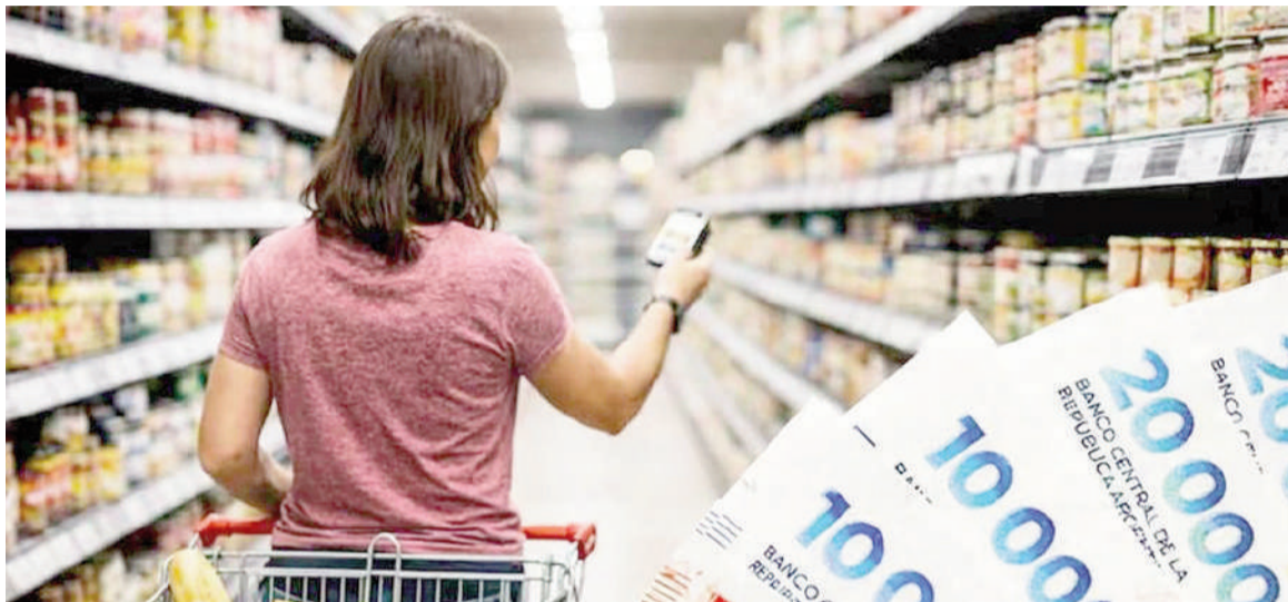
La inflación esperada para mayo es de 2,3% y, para junio, de 2,1%.

Donde sí se vio una tenue mejora fue en las expectativas para el IPC Núcleo, que excluye precios regulados y factores estacionales.