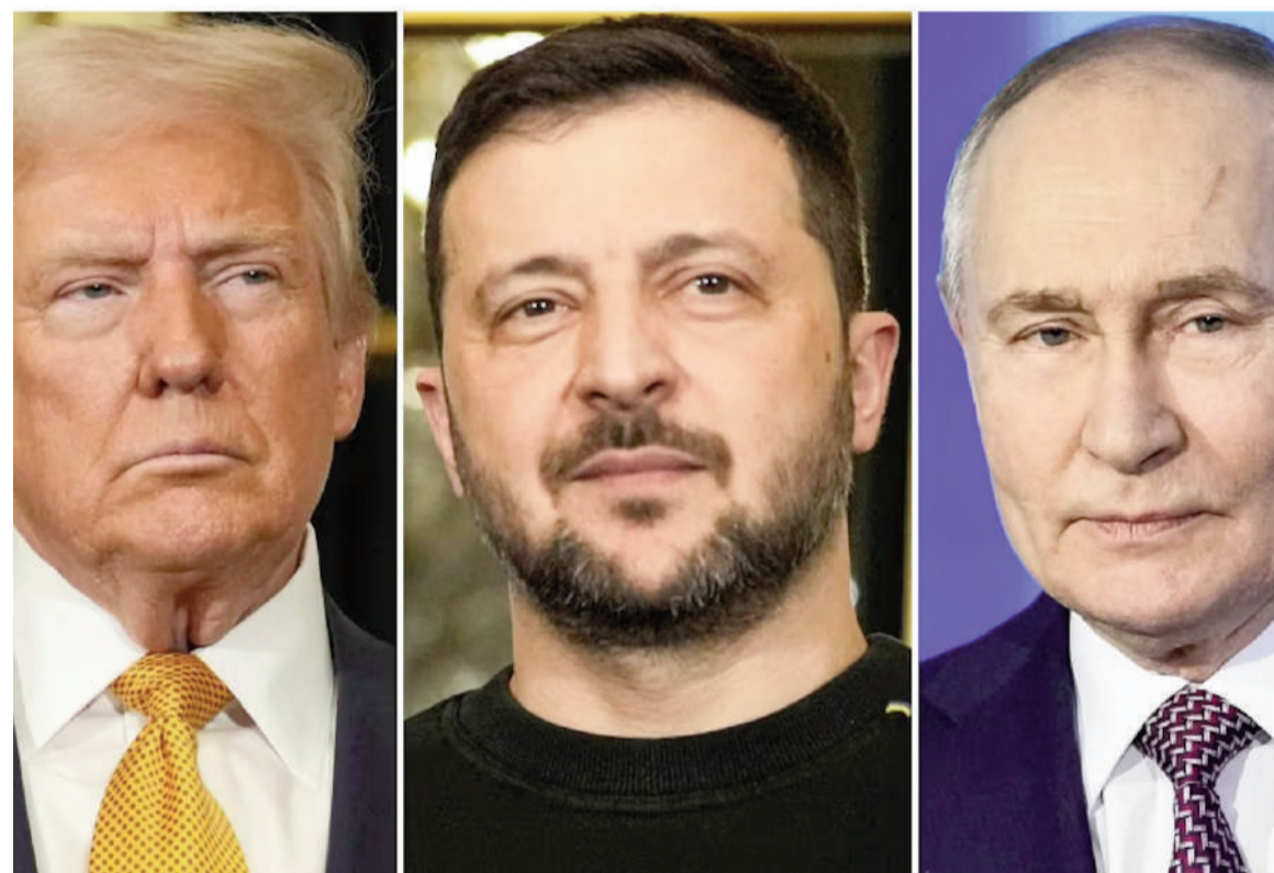
Los presidentes Donald Trump, Volodimir Zelenski y Vladimir Putin.

El Kremlin respondió que el mandatario ucraniano puede viajar "en cualquier momento" a Moscú.