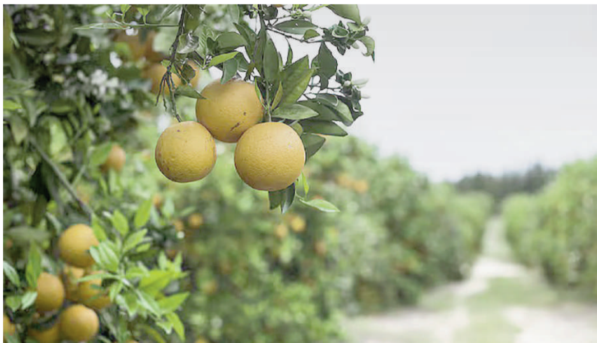
La vitamina C presente en la naranja estimula la producción de colágeno, lo que ayuda a mantener la elasticidad de la piel.

De acuerdo con investigaciones realizadas por la Universidad de Nottingham, la vitamina C actúa como un agente antioxidante que neutraliza estos radicales libres. Su consumo frecuente permite reducir la inflamación en las vías respiratorias, lo cual mejora la función pulmonar y puede aliviar síntomas en personas con enfermedades respiratorias crónicas como asma o enfermedad pul-