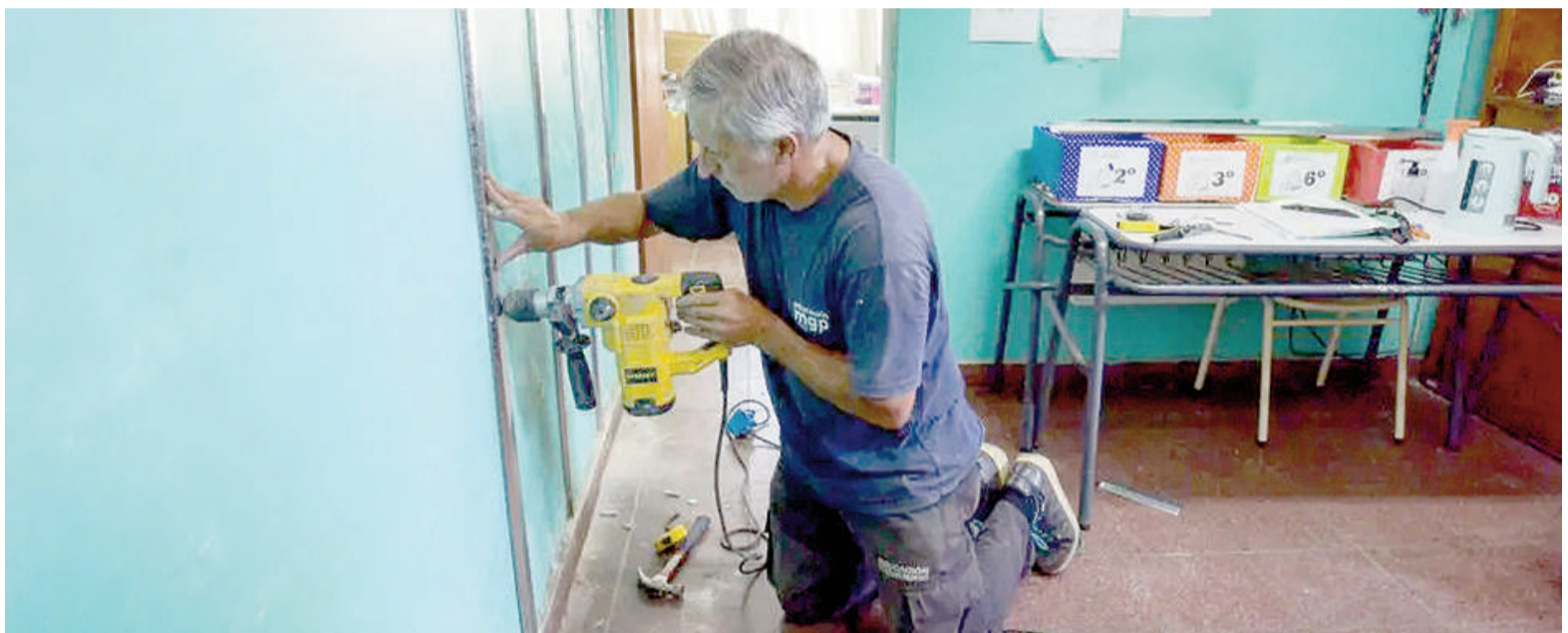
Desde el Consejo Escolar San Nicolás sostienen que no se alcanza a cubrir todas las necesidades de mantenimiento escolar por falta de fondos. ILUSTRACIÓN

“En abril de 2025 fue el último mes que recibimos en tiempo y forma alrededor de 44 millones de pesos mensuales en concepto de Fondo Compensador (Ley 13.010, ligado a la recaudación provincial), para mantener los 100 edificios escolares públicos de San Nicolás.