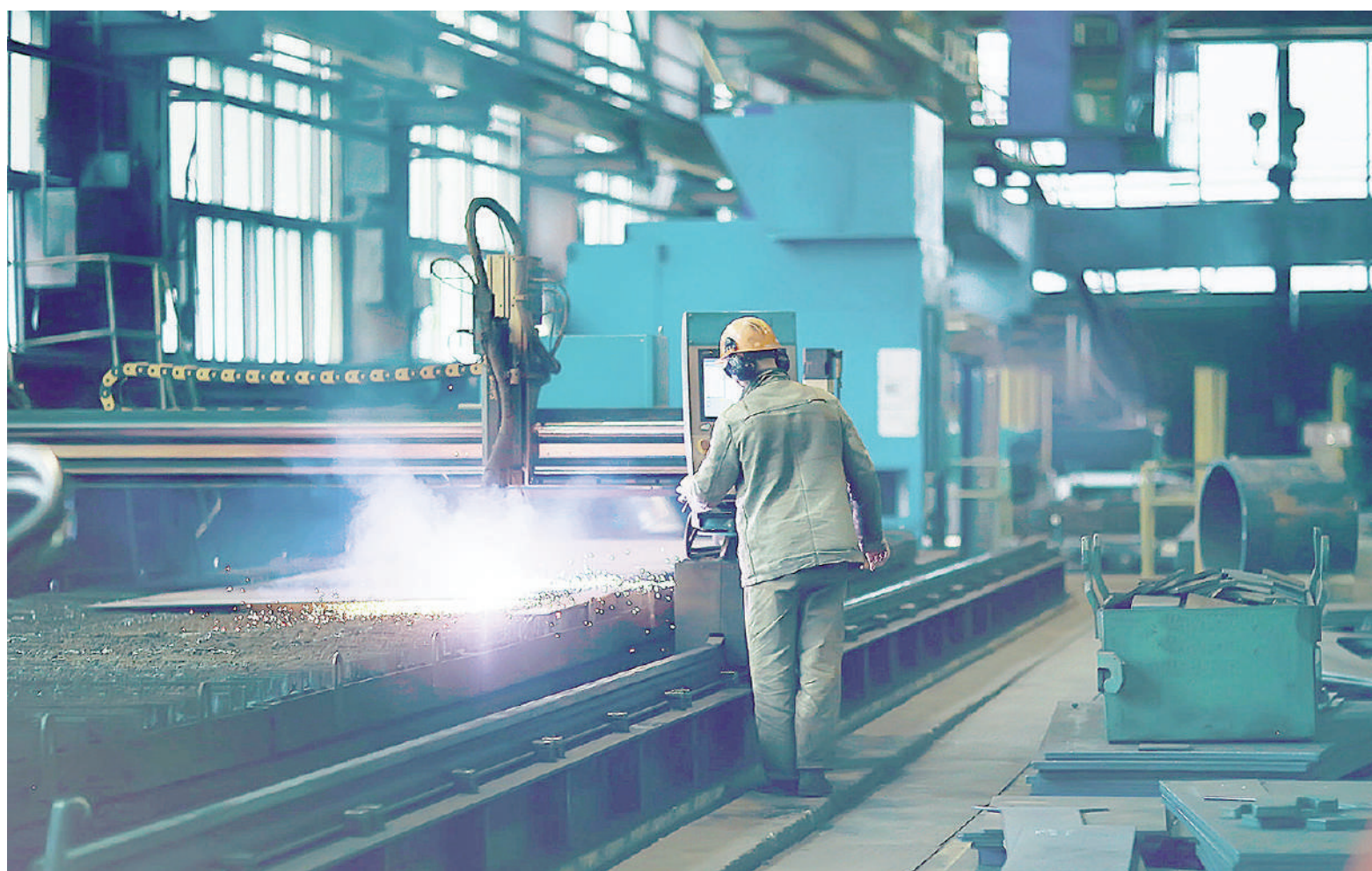
Con una siderúrgica que no despega, se siguen perdiendo puestos de trabajo en pymes y talleres metalúrgicos.

El número de puestos de trabajo perdidos se incrementó con los alrededores de 80 puestos de trabajo perdidos en Damluc, otra firma que cesó en sus actividades. Tenía su