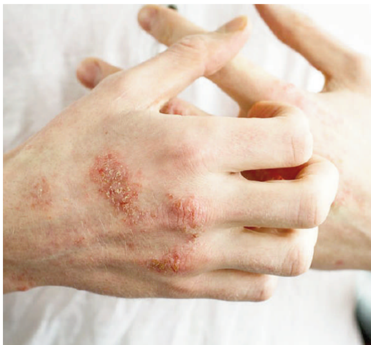
La dermatitis atópica afecta al diez por ciento de los niños y adolescentes, y en muchos casos llega hasta la adultez.