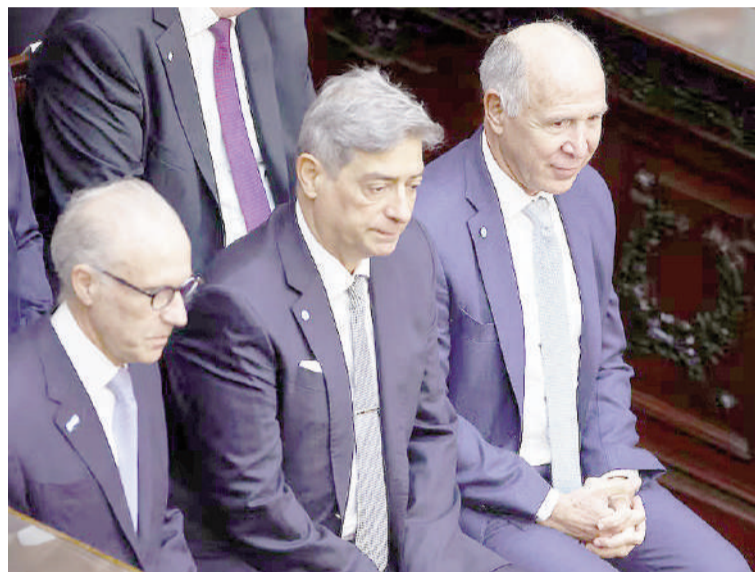
Los jueces Ricardo Lorenzetti, Horacio Rosatti y Carlos Rosenkrantz.

junto completo de cuestiones previstas por la ley. Quedaron afuera la recomposición presupuestaria de 2024 y 2025 y otros gastos vin-