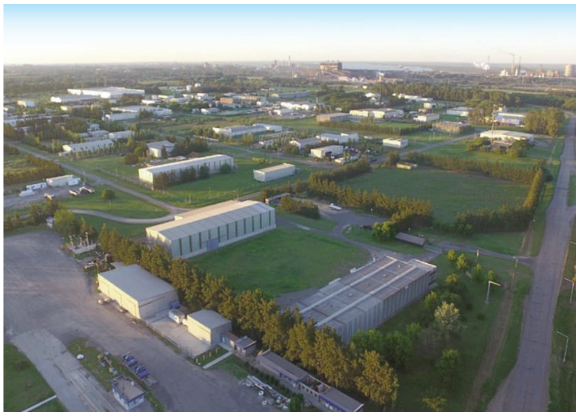
Parque Industrial Comirsa.