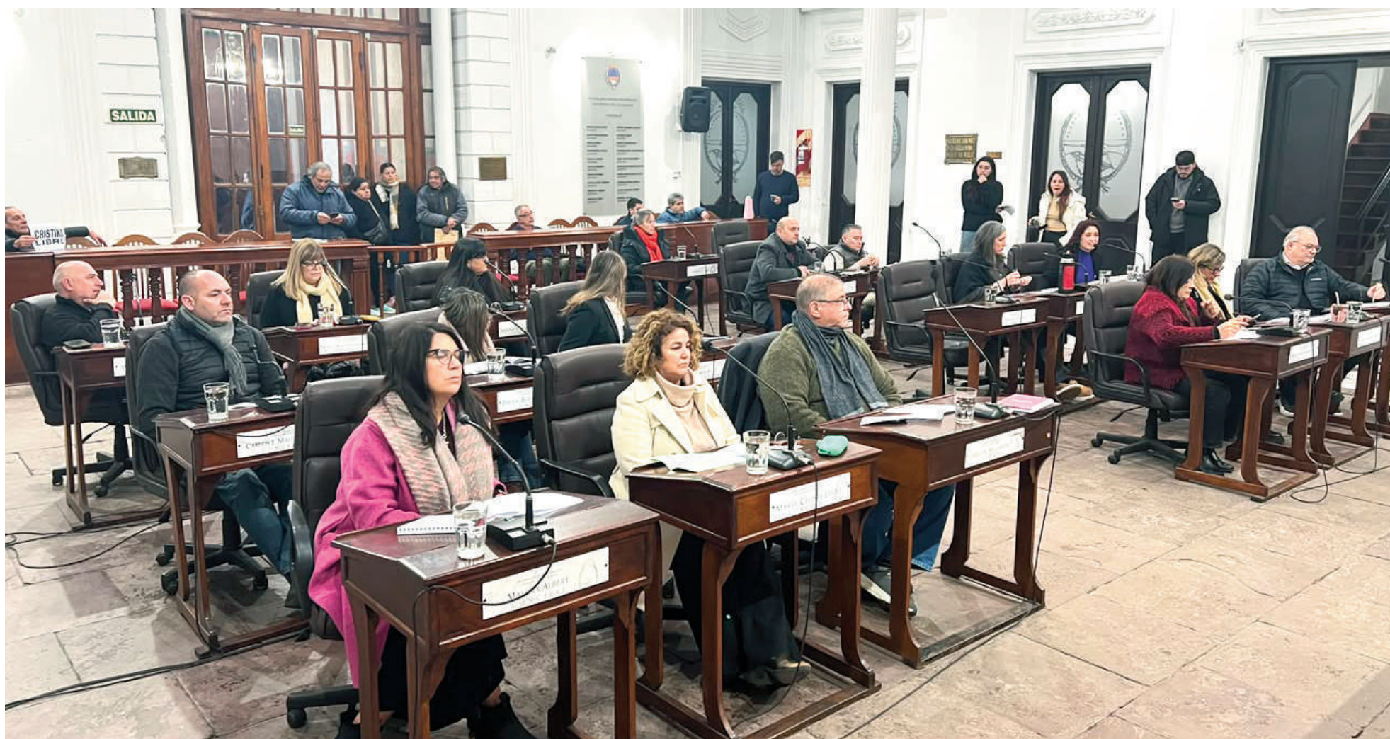
A pedido de la empresa Vercelli Hnos., el Concejo Deliberante aprobó este jueves una suba del 7,8% en el valor del boleto de colectivo.

Por pedido de la empresa Vercelli Hnos., la tarifa plana del transporte público local pasará la semana próxima de $1795,34 a $1935, lo que implicará un incremento del 7,8%. En diciembre de 2023, hacia el inicio de la administración nacional de Javier Milei, el boleto en San Nicolás costaba $266. Con la actualización que comenzará a regir el 1º de julio, la tarifa habrá acumulado una exorbitante suba del 627%.