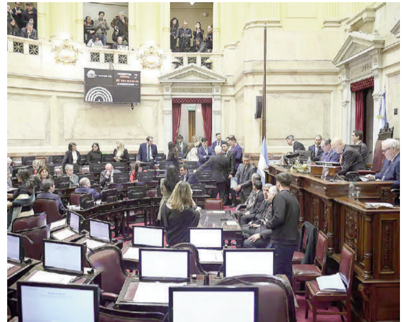
Bancas vacías y falta de quórum en el Senado.

En una crítica al Gobierno, la UCR señaló que «cumplimos con nuestra responsabilidad en el recinto, pero lamentablemente la sesión se cayó por falta de quórum. La agenda legislativa del Senado no puede seguir