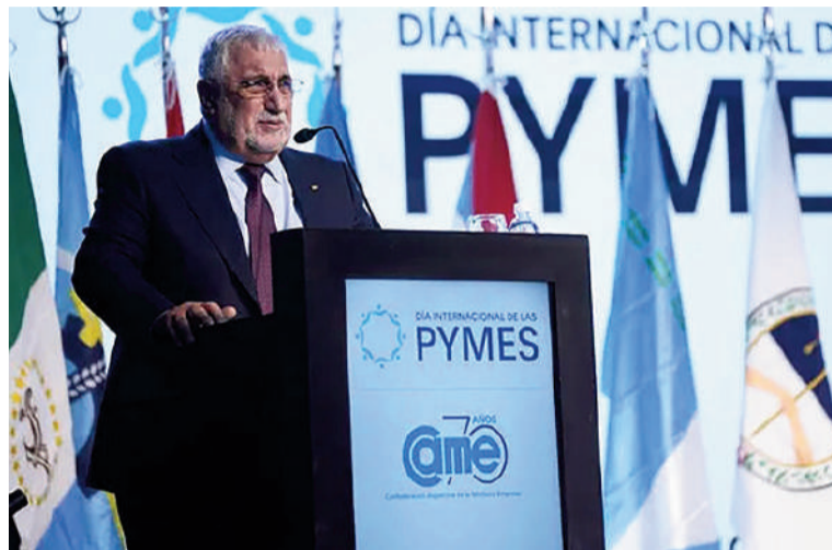
Las pymes buscan hacerle llegar al Gobierno su agenda para volver a crecer.

Estaba previsto que participen el ministro del Interior de la Nación, Diego Santilli, el secretario de Turismo y Ambiente de la Nación, Daniel Scioli; y el secretario de Coordinación de Producción de la Nación,