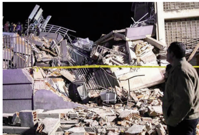
Los terremotos causaron graves daños en Venezuela.

Las autoridades mantienen activa la búsqueda de sobrevivientes entre los escombros mientras aumenta el número de víctimas.