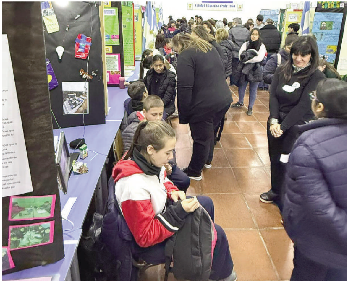
La Feria de Ciencias reunió a estudiantes de más de 30 escuelas, el miércoles, en el Instituto Fray Luis Beltrán.

El Programa de Actividades Científicas y Tecnológicas Educativas tiene por objetivo contribuir al fortalecimiento de las trayectorias escolares de los estudiantes. Esto se realiza mediante propuestas de enseñanza y aprendizaje que contemplan la diversidad de intereses, promueven el trabajo participativo y comunitario, y democratizan los saberes a través de distintas formas de interactuar