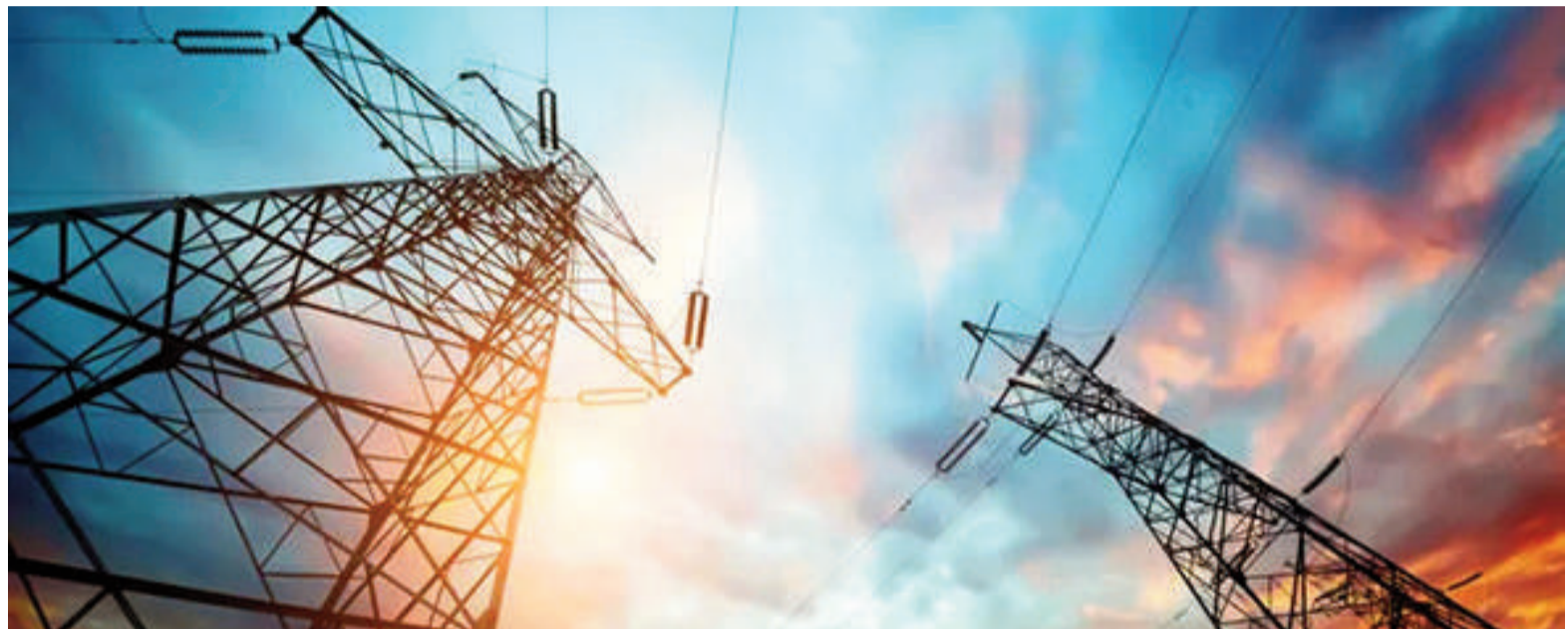
El aumento alcanzará tanto a usuarios residenciales con subsidios como a aquellos que no reciben asistencia estatal.

De acuerdo con lo dispuesto por las autoridades, el beneficio correspondiente al mes de junio pasó del 10,67% al 11,97% sobre el consumo base subsidiado. La corrección busca adecuar los valores facturados a las disposiciones nacionales y garantizar que los usuarios alcanzados por el programa continúen reci-