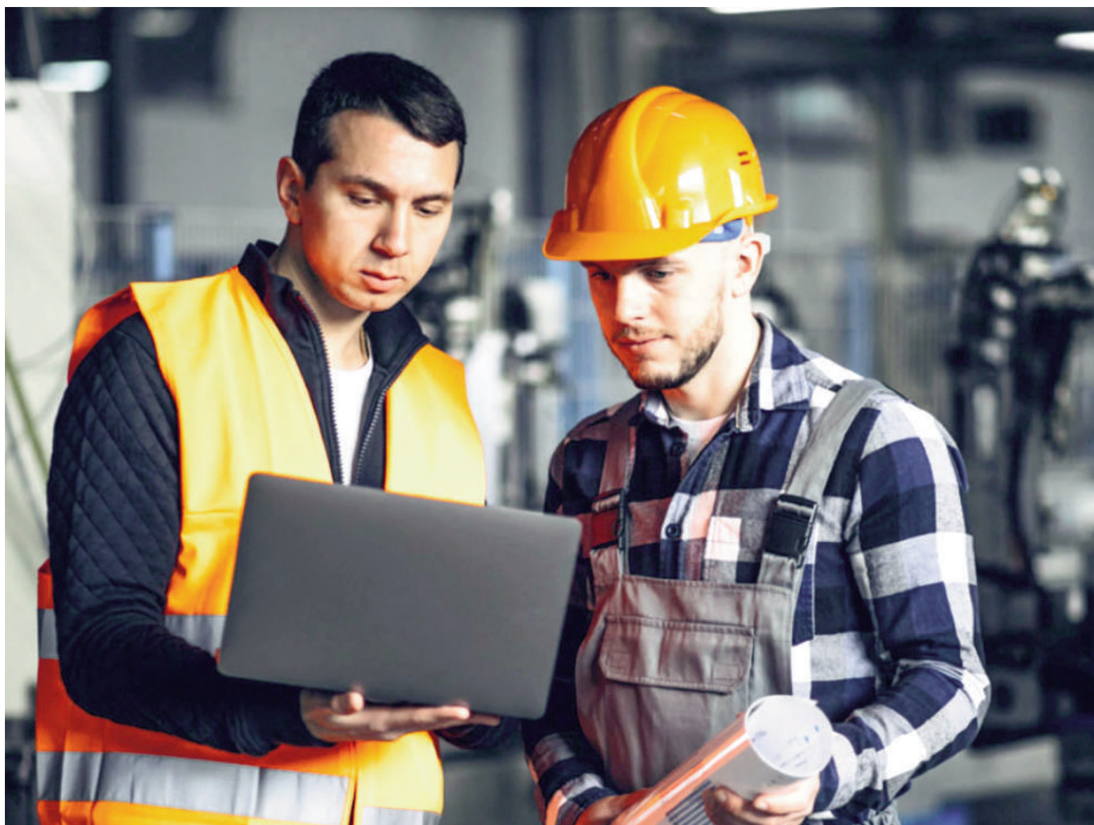
Según el estudio, la pérdida de empleo se extendió a gran parte del país, aunque con intensidades diferentes según las características productivas de cada territorio.

El informe del CETyD sostiene que los datos permiten observar una realidad más compleja que la habitual división entre un Área Metropolitana de Buenos Aires afectada por la crisis y un interior en expansión. Según el