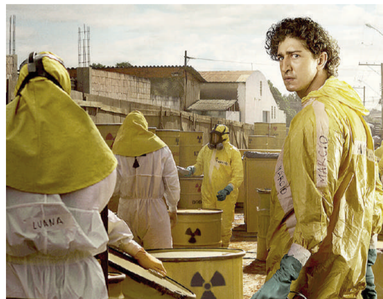
Emergencia radiactiva, miniserie de Netflix que aborda el accidente en Goiânia.

En septiembre de 1987, la ciudad de Goiânia, ubicada en el centro de Brasil, fue escenario de uno de los accidentes radiológicos más graves de la historia fuera de una central nuclear. Todo comenzó cuando dos hombres ingresaron a un hospital abandonado y retiraron un equipo de radioterapia en desuso, sin saber que en su interior había una fuente sellada con cesio-137. Convencidos