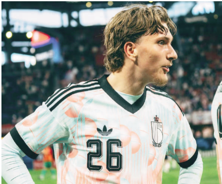
Magritte, homenajeado por Bélgica.

¿Por qué Magritte y por qué ahora? Porque no hay mejor síntesis de identidad belga, y un Mundial es justamente la vidriera ideal para mostrarla. En este 2026 varias selecciones usaron sus camisetas para contar historias culturales propias: Japón apostó por doce líneas multicolores en su segunda equipación, una por cada jugador en cancha más una dedicada a los hinchas, para representar la conexión entre el plantel y su gente; Ghana incorporó a Ananse, la araña protagonista de la tradición oral del pueblo akan; Arabia Saudita recurrió a motivos de su arquitectura tradicional; México volvió a la Piedra del Sol y al imaginario del calendario azteca; y España eligió una segunda camiseta inspirada en manuscritos