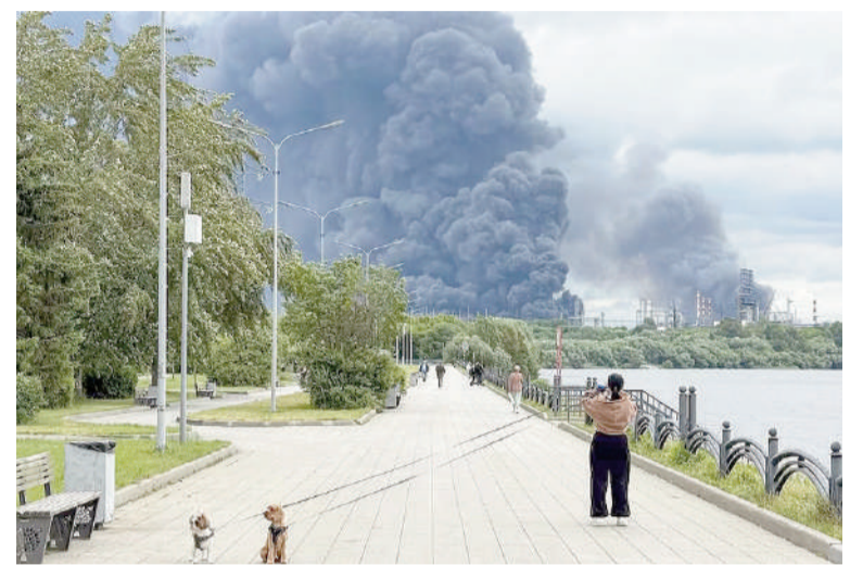
Una columna de humo negro se eleva desde la refinería de petróleo de Gazprom Neft, en el sudeste de Moscú.

El núcleo del ataque ucraniano se concentró en la planta de refinamiento de petróleo MNPZ, un complejo energético vital situado en el distrito de Kapotnia, en el sector sur de la capital rusa. El propio jefe comunal, Serguéi Sobianin, reconoció ante las agencias de noticias que la agresión revistió características de un operativo "a gran escala", aunque las autoridades del Kremlin evitaron precisar inicialmente la magnitud de la ofensiva del gobierno ucraniano. El presidente de Ucrania, Volodimir Zelenski, asumió la autoría del bombardeo y convalidó la estrategia militar implementada por sus mandos tácticos. Además, ti-