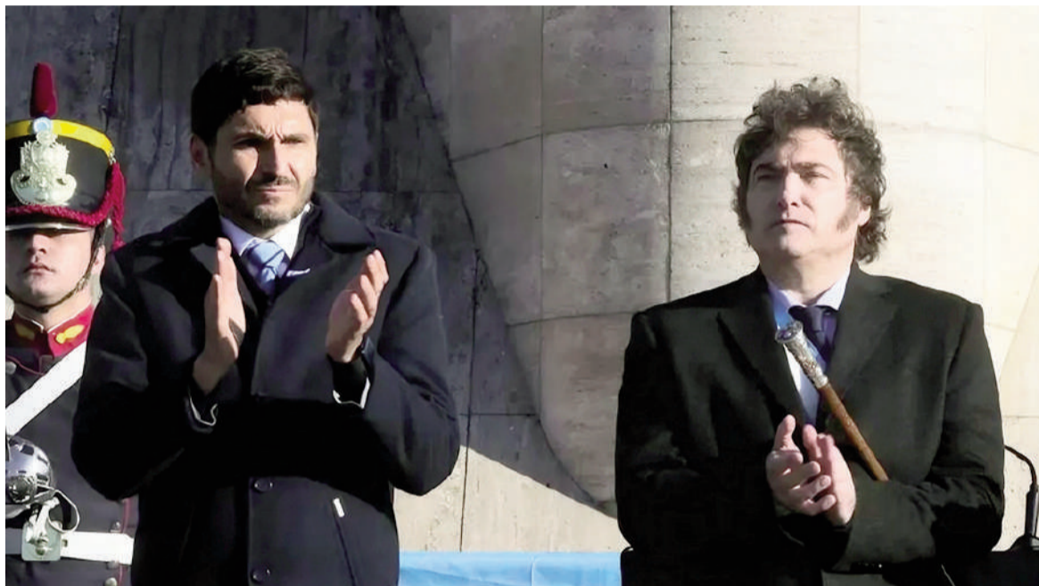
Maximiliano Pullaro y Javier Milei volverán a verse en Rosario.

La recuperación integral del principal emblema histórico de Rosario había sido reclamada du-