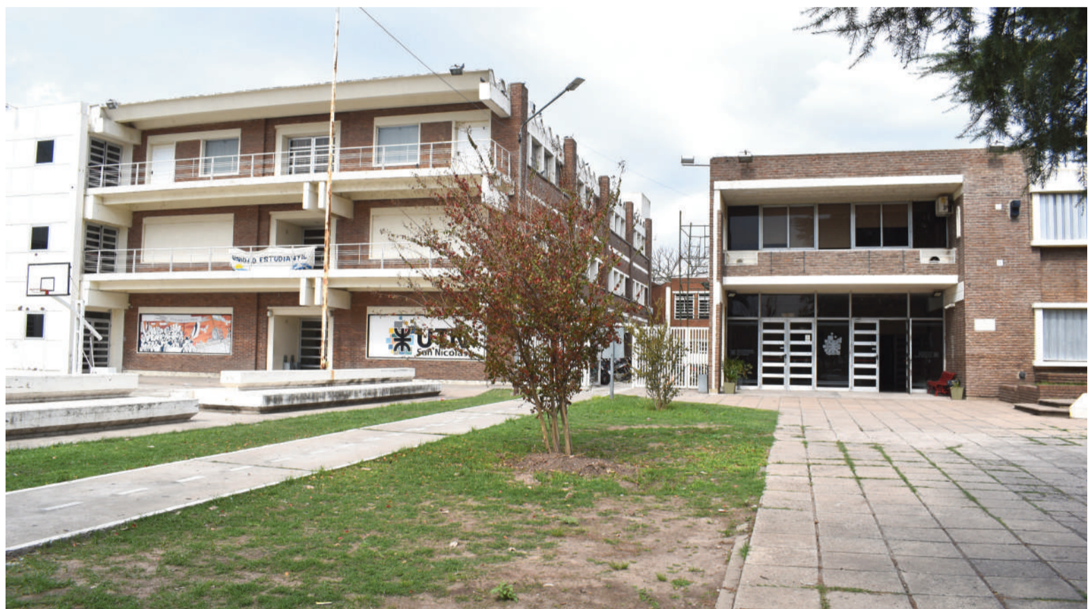
El acuerdo también actualiza la garantía salarial mínima para las distintas dedicaciones docentes.

El entendimiento llega en un contexto de creciente conflicto en las universidades públicas y cuando distintas federaciones analizaban profundizar las medidas de fuerza previstas para la semana del 16 al 20 de junio. La convocatoria a la mesa paritaria era uno de los principales reclamos de los sindicatos, que denunciaban la falta de negociación salarial desde hacía más de un año.