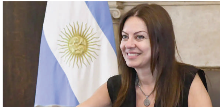
La ministra de Capital Humano Sandra Pettovello.

venios colectivos de trabajo que, como consecuencia de la finalización del régimen de ultraactividad, deberán ser objeto de nuevas negociaciones entre las organizaciones sindicales y los sectores empleadores", afirmó el texto oficial.