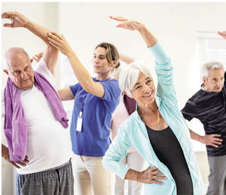
Una sesión de 30 minutos de actividad de resistencia, sola o combinada con intervalos vigorosos, mejora la elasticidad arterial.

Evidencia internacional: resultados del estudio de 2026 Un metaanálisis publicado en