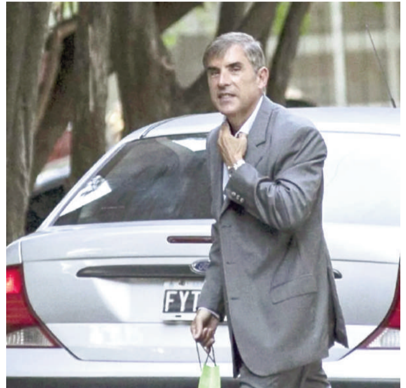
El fiscal Pollicita está al frente de la investigación judicial sobre el patrimonio de Adorni.

establecida una línea de investigación sobre activos digitales, previa a los dichos de Adorni. La fiscalía tiene identificadas una serie de billeteras ligadas al funcionario con movimientos de dinero digital de alrededor de