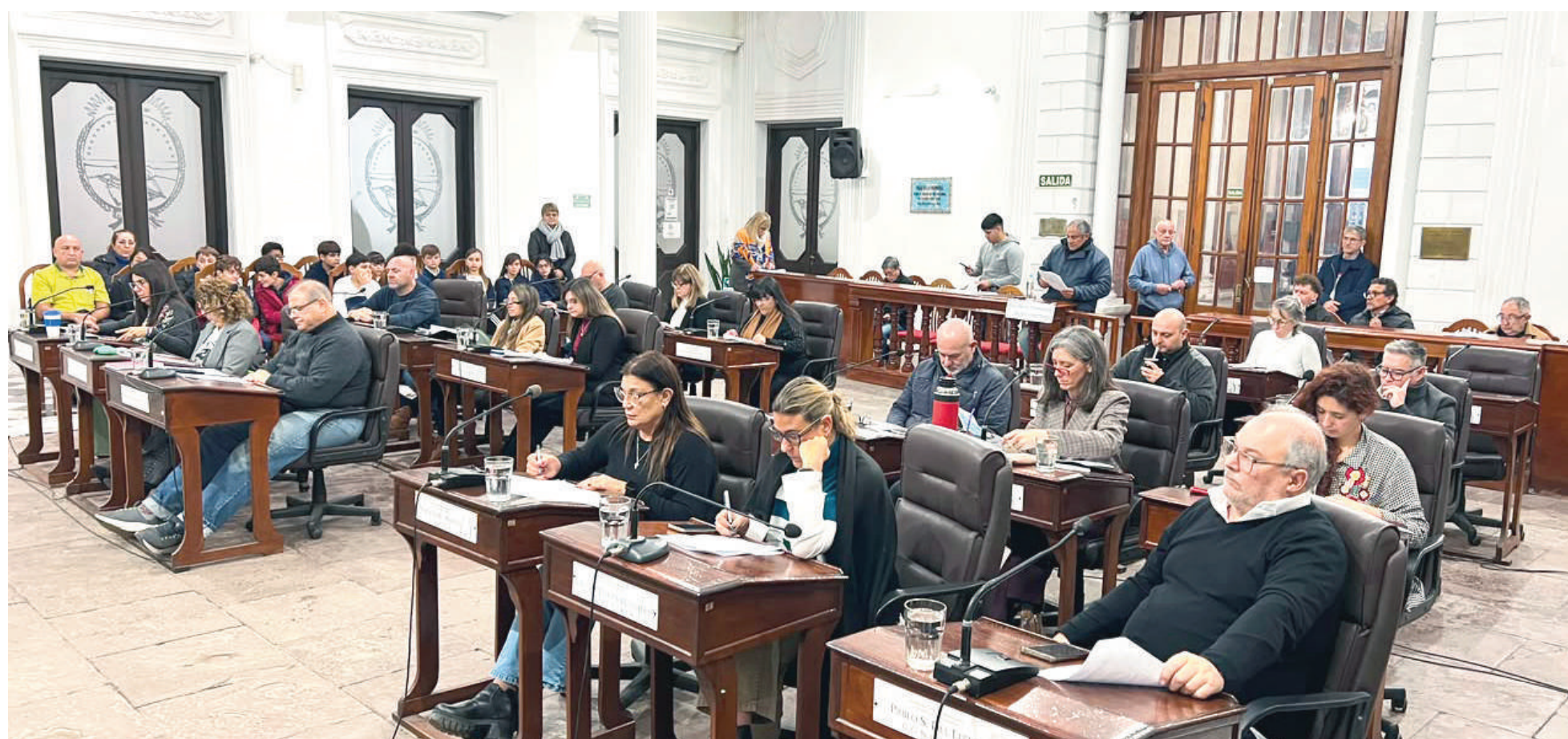
El pedido de la concesionaria EVHSA adquirió estado parlamentario en la sesión ordinaria que el Concejo Deliberante celebró ayer jueves.

El pedido de la concesionaria de todas las líneas de transporte municipales fue remitido al Concejo Deliberante y adquirió estado parlamentario en la sesión ordinaria de ayer jueves. Aunque en febrero de 2024 se estableció un sistema de actualizaciones tarifarias atado a las variaciones del IPC, ahora la empresa pide un ajuste basado en el anterior método: una fórmula polinómica de costos operativos.