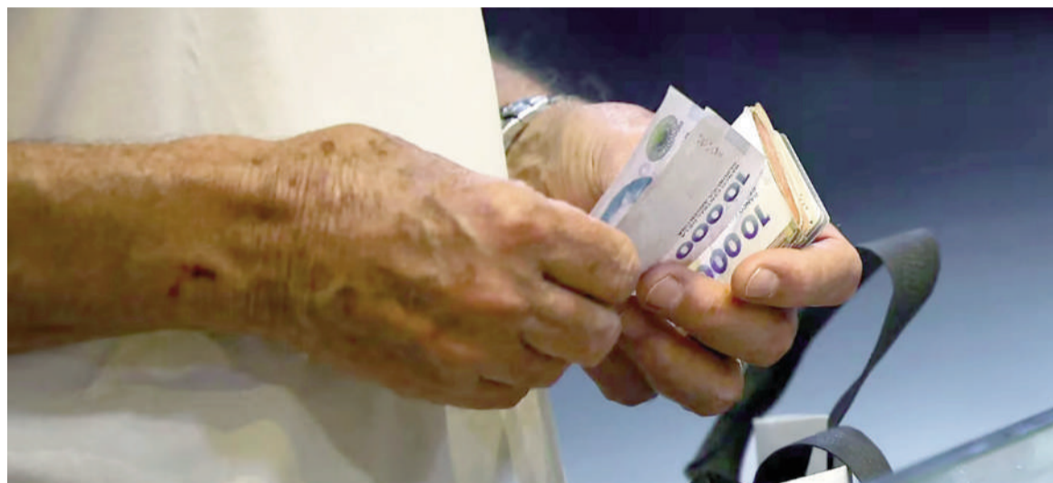
El IPC mensual se desaceleró 0,5 puntos porcentuales contra abril.

cluye los componentes estacionales y regulados— mostró un alza de 1,9%, impulsada por aumentos en restaurantes, bares y casas de comidas, así como en productos farmacéuticos.