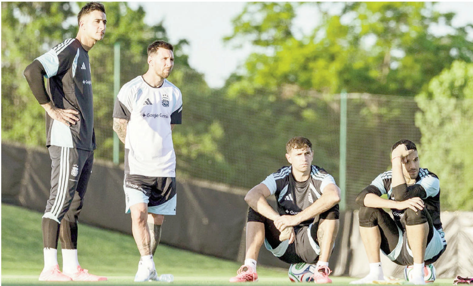
Juan Musso será titular esta noche en el amistoso de la Selección en Texas.

A 10 días del debut en la Copa el Mundo, esta noche la Selección se medirá ante los centroamericanos en un amistoso en Texas. Scaloni confirmó que el arquero nicoleño atajará hoy, en tanto que Rulli lo hará el martes en la otra prueba ante Islandia.