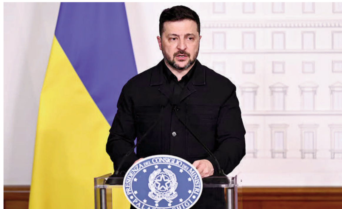
Zelensky criticó la falta de voluntad para la paz de Putin.

Durante el plenario del Foro Económico Internacional de San Petersburgo, Putin reveló que no encuentra sentido a negociar directamente con el mandatario ucraniano.