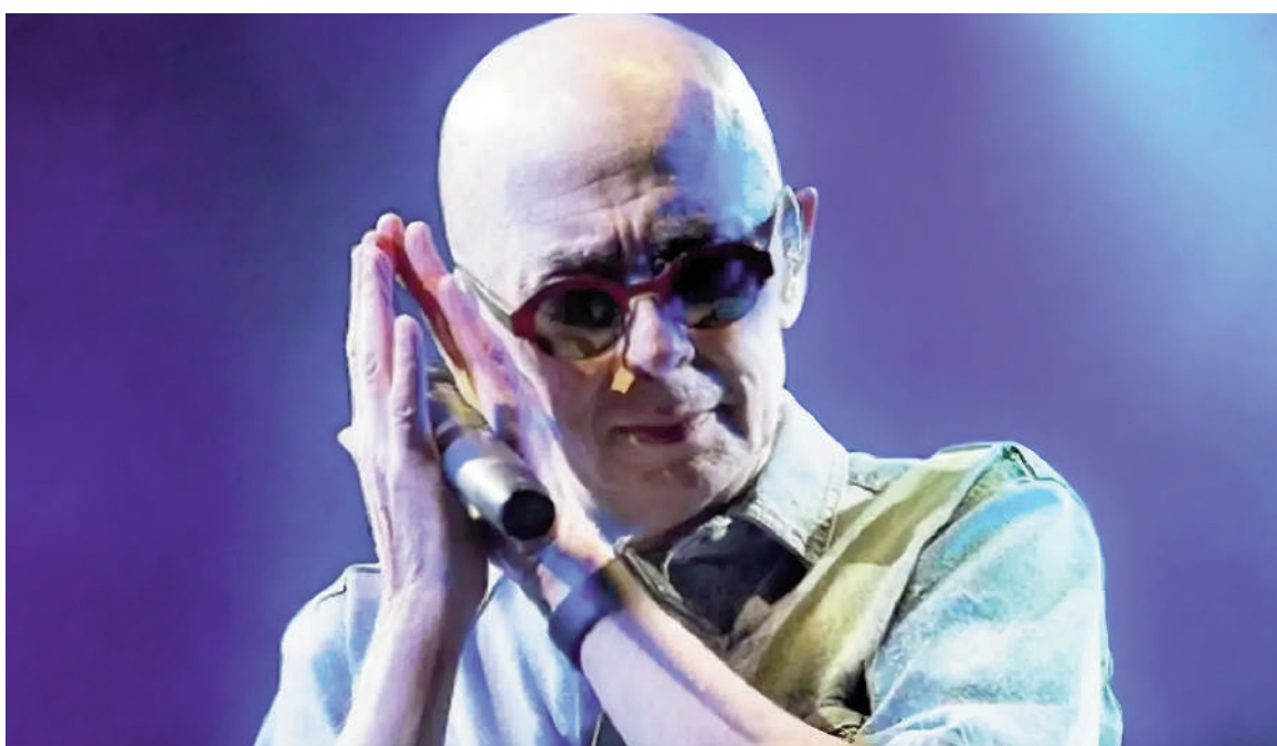
El «Indio» Solari falleció a los 77 años.

La influencia de Solari se extendió mucho más allá de la música y se convirtió en un referente de la con-