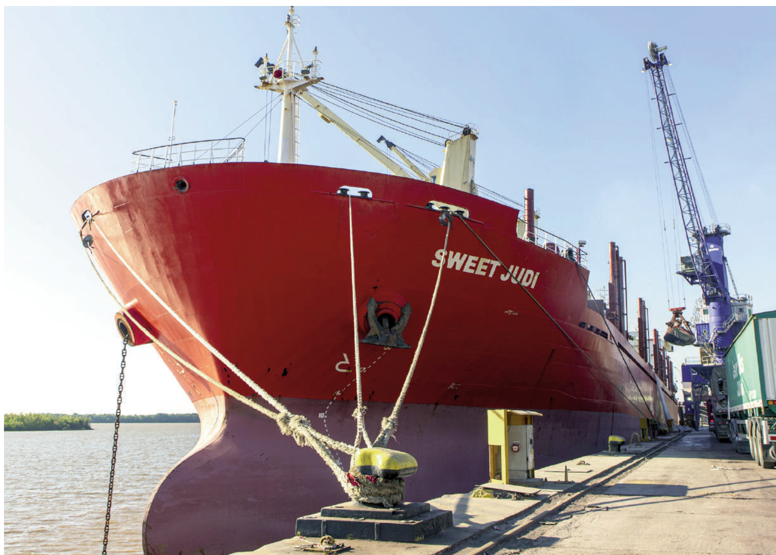
Las toneladas operadas en el Puerto de San Nicolás durante el primer cuatrimestre de este año fueron 648.690.

19% en cantidad de toneladas, otros indicadores que ilustran la mejora en la actividad durante el primer cuatrimestre son los que tienen que ver con la cantidad de embarcaciones que amarraron en los muelles y la cantidad de camiones que atravesaron el portal de ingreso del Puerto de San Nicolás.