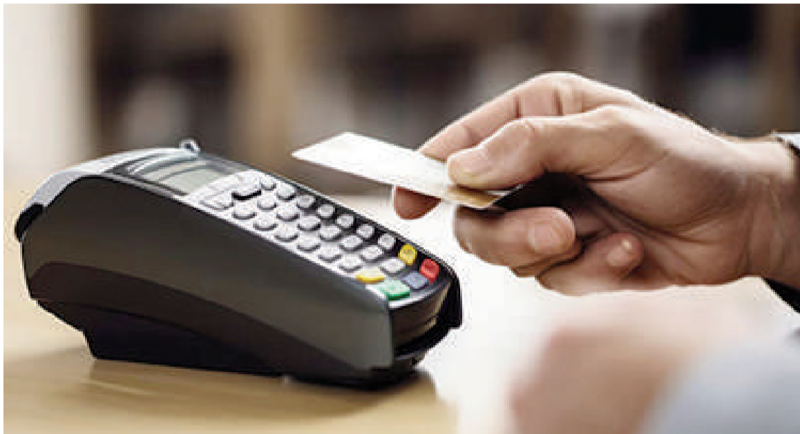
No repunta el crédito al consumo pero aumenta el financiamiento a empresas.

"Esta caída en el saldo total de la cartera demuestra que una parte im-