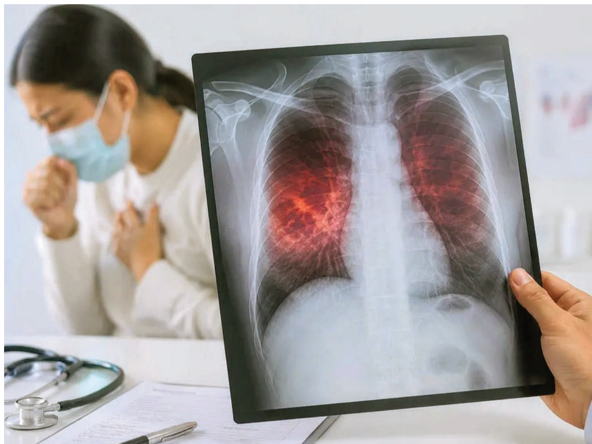
Si bien existe la vacuna BCG y hay antibióticos para curar la tuberculosis, los casos siguen en aumento en el país.

Para reforzar el diagnóstico de tuberculosis en todo el país, el Ministerio distribuyó más de 40.500 cartuchos para pruebas moleculares y 2.870 dosis de Derivado Proteico Purificado (PPD), insumos que se utilizan para la detección de esta infección bacteriana. El objetivo es mejorar el diagnóstico temprano y el seguimiento de los tratamientos