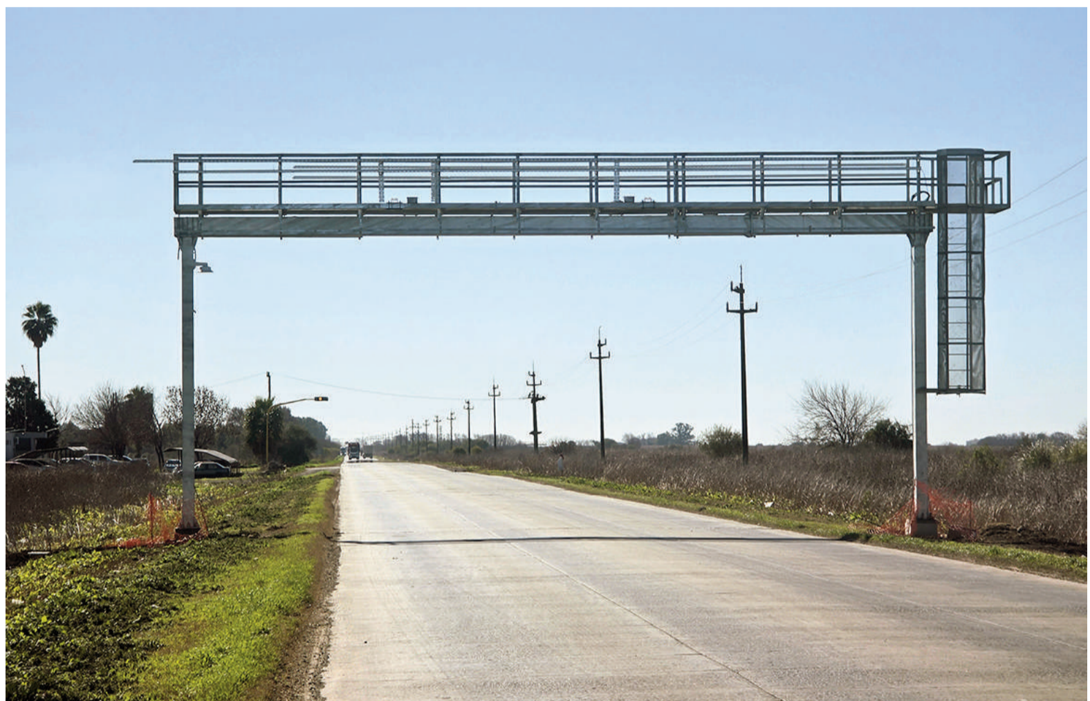
El municipio de Ramallo avanza con el sistema de control y pesaje de camiones sobre el acceso a Villa General Savio.

En los borradores de los industriales, hay un número estimado, basado en datos extraoficiales que