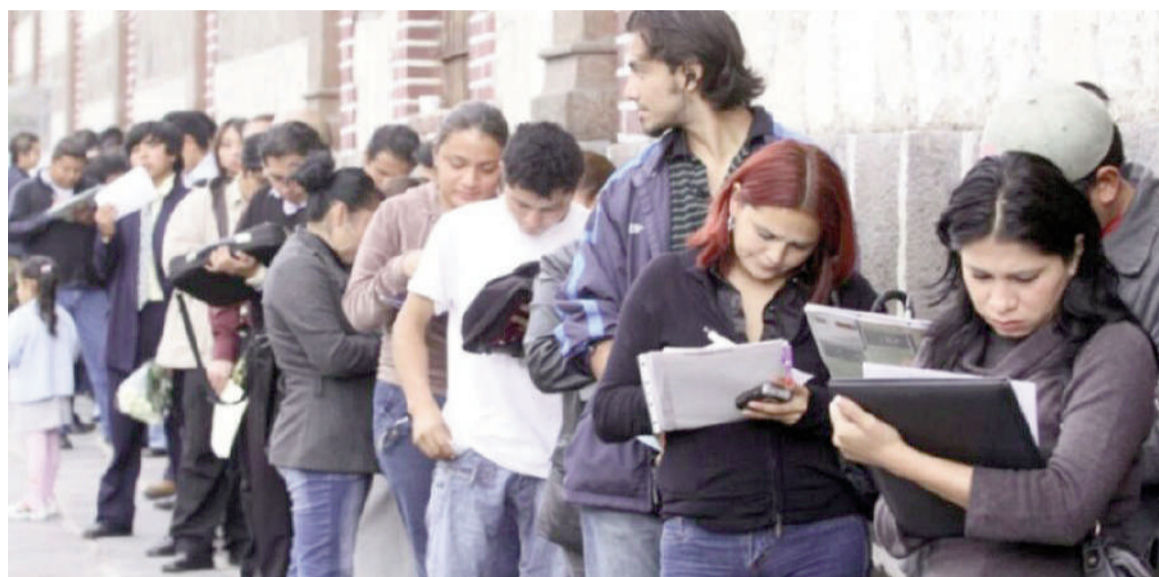
Desde que asumió Milei, se perdieron 26.448 empresas y 252.129 empleos asalariados formales.

"Desde el inicio de la actual fase descendente, en agosto de 2023, hay 252.129 trabajadores menos. Ya está