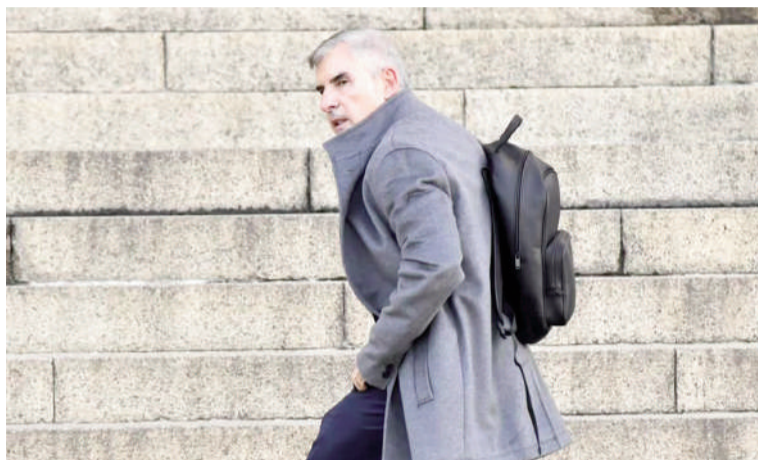
Pollicita profundiza la investigación sobre Adorni.

Otra de las medidas apunta a reconstruir los ingresos formales de Adorni y de su esposa durante los últimos años. Para ello, el fiscal solicitó a la Anses que remita la historia laboral completa de ambos desde 2012 hasta la actualidad, incluyendo empleadores registrados, altas y bajas laborales, remuneraciones declaradas, aportes previsionales, actividades autónomas o monotributistas y cualquier otro dato que permita re-