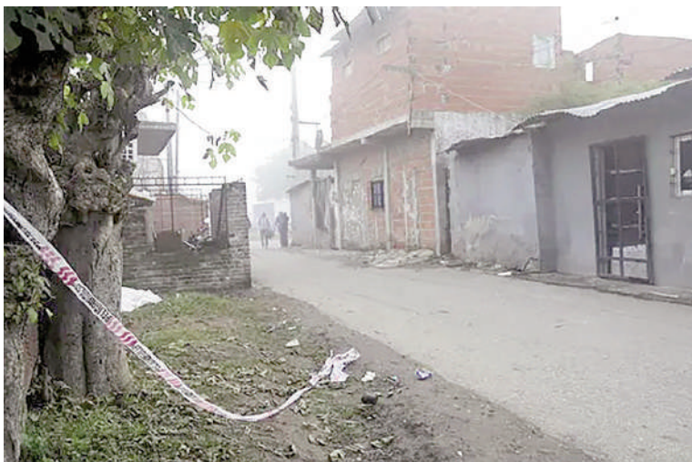
La víctima fatal fue atacada alrededor de las 23.30 del jueves, cerca del cruce de 27 de Febrero y Gutenberg.

El hecho se registró entre las 22.30 y las 23.00. En un primer momento se informó que los efectivos estaban sin el uniforme oficial y