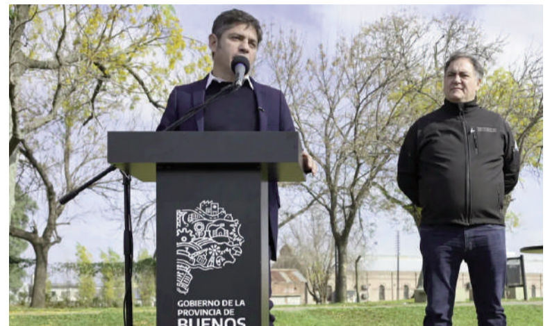
El gobernador visitó Pergamino.

Durante el contacto con la prensa posterior, Kicillof reconoció que están “con mucha dificultad” y añadió: “El Gobierno Nacional, ustedes saben que está en contra de la obra pública, pero no solo la que hacen ellos, sino la que también es en todas las provincias argentinas. Aún así, tenemos planificado continuar con las obras, lo vamos haciendo. Hoy la inauguración de una escuela, seguimos trayendo los móviles y tomando notas y esperando que revierta. La escuela de hoy era una escuela que financiaba a Nación, como financió toda la vida. Este es el primer Gobierno que no financia nada, nada, nada, y se