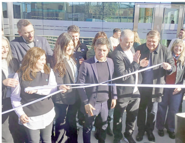
Axel Kicillof inauguró una sucursal del Banco Provincia.

El gobernador de la provincia de Buenos Aires, Axel Kicillof, visitó ayer el partido de Ramallo en el marco de una intensa agenda de actividades que incluyó la inauguración oficial de la nueva sucursal sustentable del Banco Provincia en Villa Ramallo y la entrega de escrituras a cientos de familias del distrito.