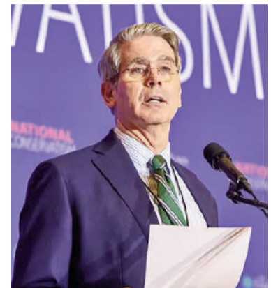
Scott Bessent, secretario del Tesoro de Estados Unidos.

cionarios estadounidenses también informaron la incautación de importantes volúmenes de criptomonedas vinculadas a redes financieras iraníes.