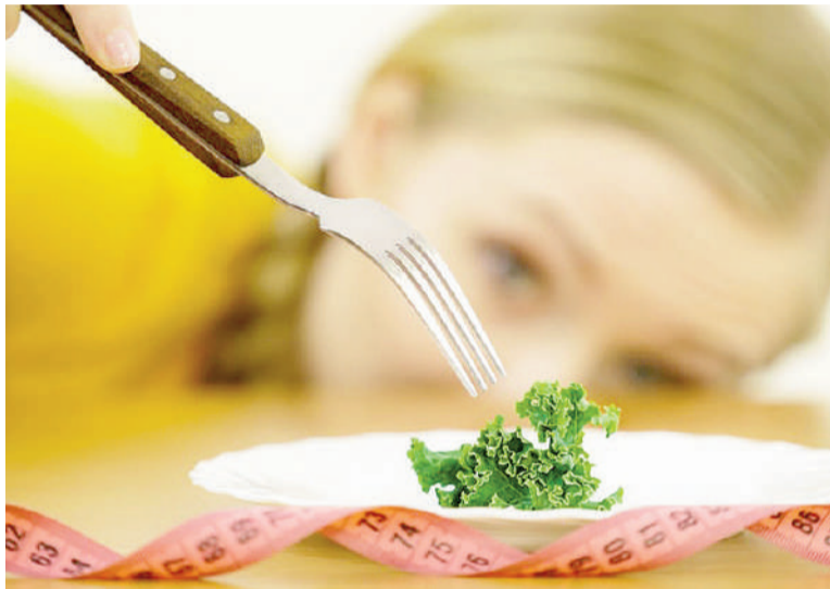
Los trastornos de la conducta alimentaria pueden atravesar todas las edades, géneros y situaciones sociales, afectando la salud física y mental.

A nivel conductual aparecen señales como comer en secreto, evitar ciertos alimentos, saltarse comidas, usar el baño de manera forzada tras