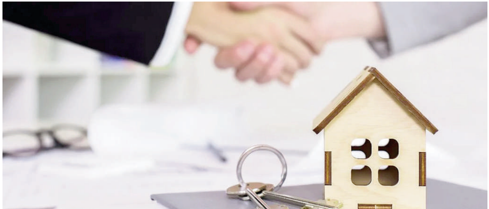
Abril mostró un fuerte retroceso en hipotecas en San Nicolás.

Si se observan las localidades vecinas, los datos son más alentadores. Tanto Ramallo como San Pedro y Baradero tuvieron en abril un crecimiento interanual de compraventas del 333%, 33% y 8%, respectivamente. En relación con las hipotecas del mes de abril, no se registraron operaciones en San Pedro, Baradero tuvo una suba interanual del