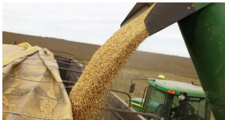
El agro fue uno de los impulsores del crecimiento económico en el primer trimestre del año.

Desde la perspectiva de la oferta, los sectores primarios lideraron el