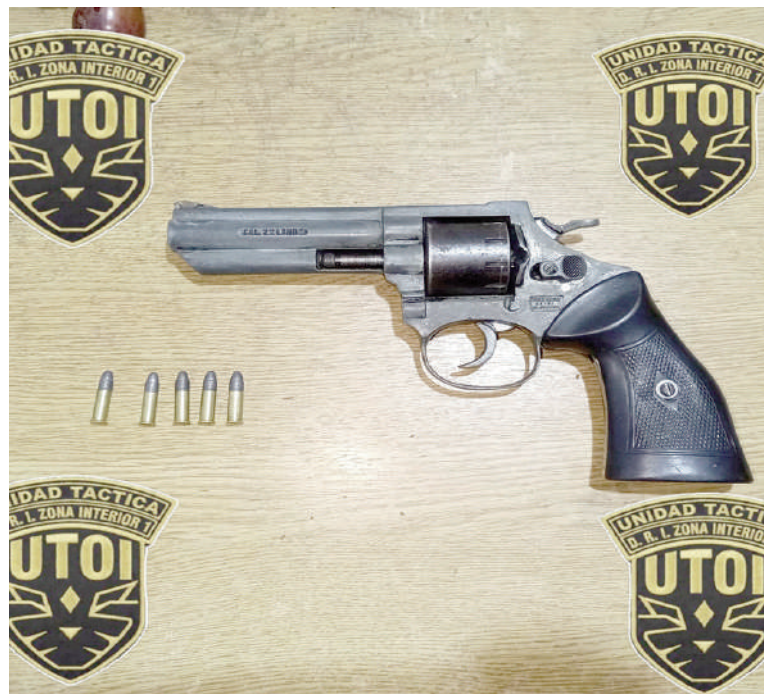
El arma secuestrada en el procedimiento realizado en barrio San Francisco.

Durante la noche, un adolescente mantuvo una discusión con integrantes de la otra familia y posteriormente comenzó a amenazar a vecinos con un arma de fuego. Ante esa situación, los residentes dieron aviso al 911 y efectivos de UTOI, junto