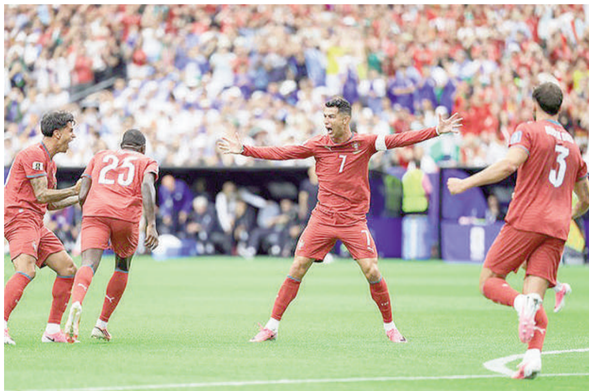
Cristiano Ronaldo marcó dos goles ante el conjunto asiático.

El conjunto lusitano se impuso en Houston por 5 a 0 por el Grupo K. Cristiano Ronaldo anotó un doblete y además convirtieron Nuno Mendes, Rafael Leão y Nematov en contra.