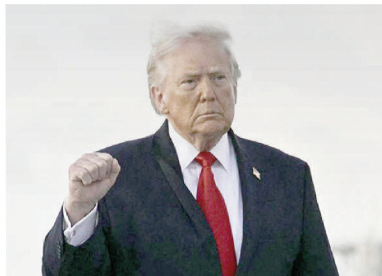
Presidente Donald Trump.

Un sondeo internacional reveló que en la mayoría de los 36 países consultados las opiniones sobre el mandatario republicano son desfavorables.