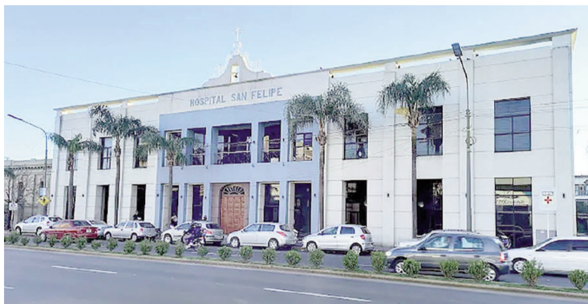
Legisladores quieren saber el estado de los hospitales bonaerenses.