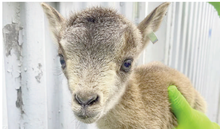
Uno de los dos primeros cabritos monteses nacidos por fecundación in vitro, en el corral del INIA-CSIC, a las afueras de Madrid.