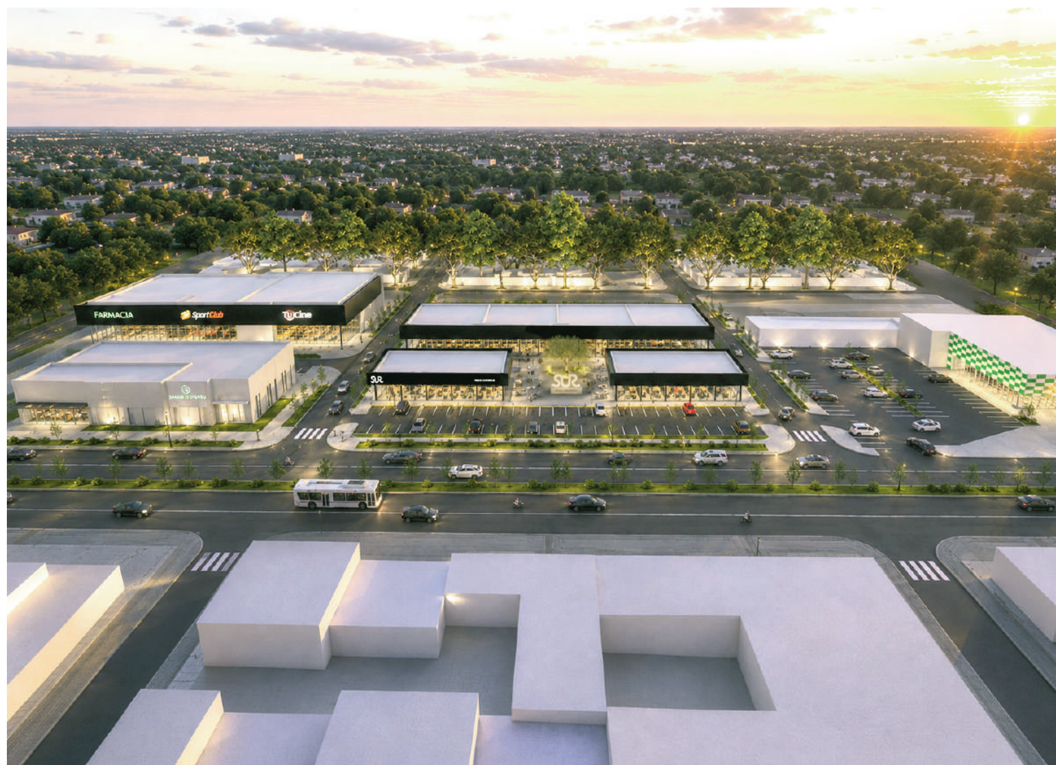
● CINE, 30 LOCALES, SUPERMERCADO Y GASTRONOMÍA, ASÍ SERÁ EL CENTRO COMERCIAL SUR