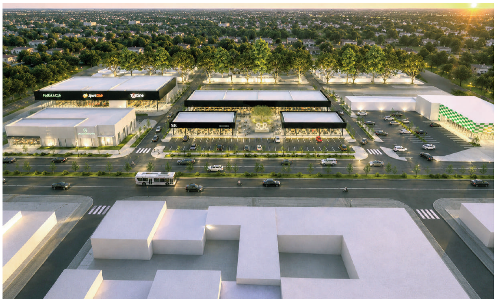
El proyecto contempla una oferta variada que permitirá atraer públicos de diferentes edades e intereses.

un ámbito dinámico durante toda la jornada, donde las personas puedan realizar compras, resolver