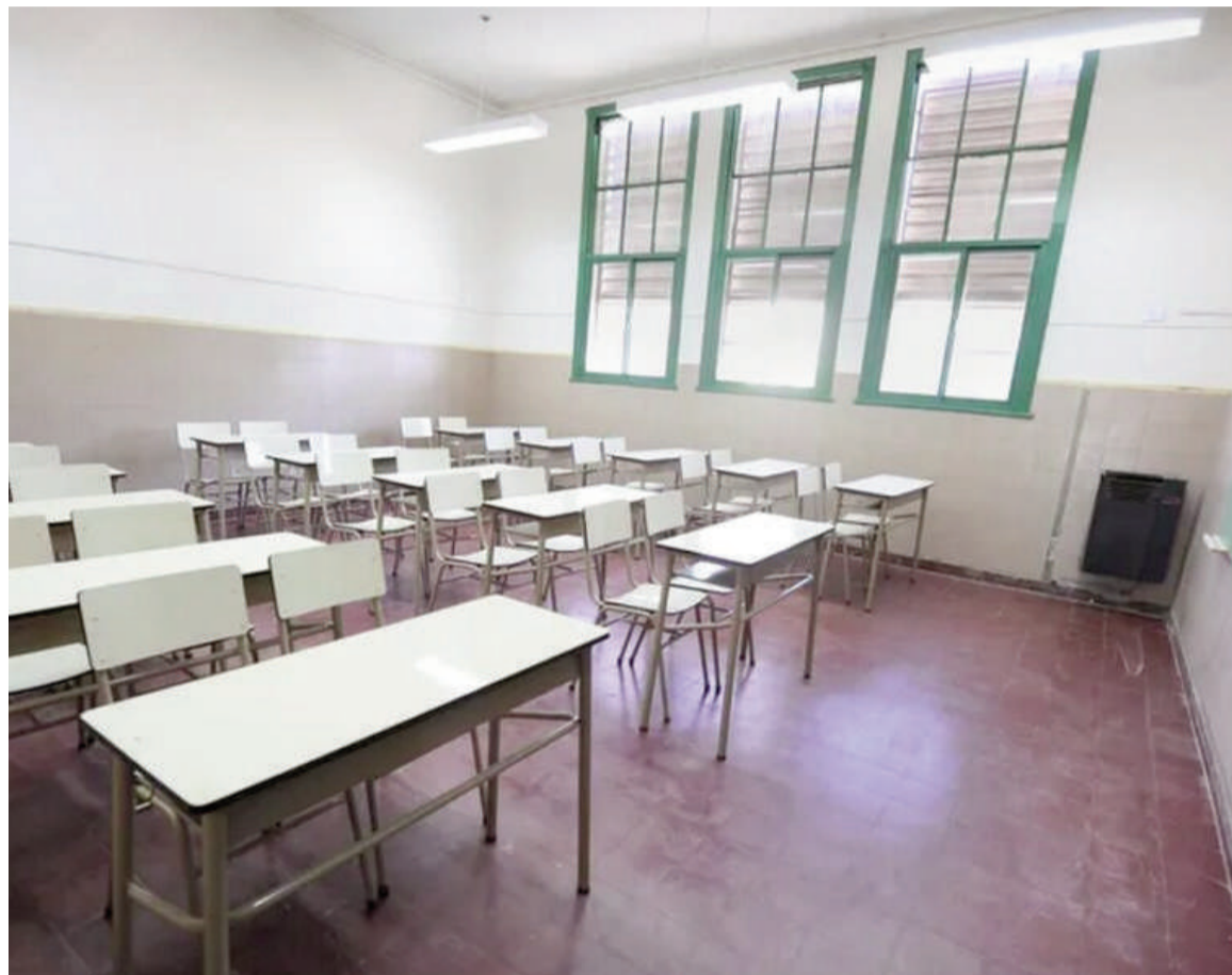
Los docentes bonaerenses hoy van al paro.

En paralelo, los gremios vienen advirtiendo por un incremento de hechos de violencia en establecimientos educativos, con episodios de agresiones de alumnos y también de familiares hacia docentes. Según señalan, esta situación suma tensión al clima escolar y se agrega a los reclamos ya existentes por condiciones laborales y salariales.