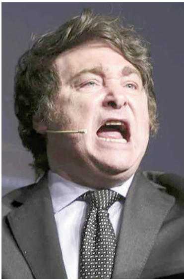
El presidente defendió su modelo económico.

Después, reconoció que los datos del primer trimestre de este año no fueron buenos producto de «un intento de golpe de Estado del semestre del año pasado, el Congreso en una actitud claramente destituyente trató de violentar el equilibrio fiscal».