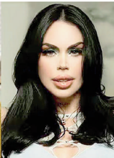
Insaurralde, Cirio y Clerici, impedidos de salir del país.