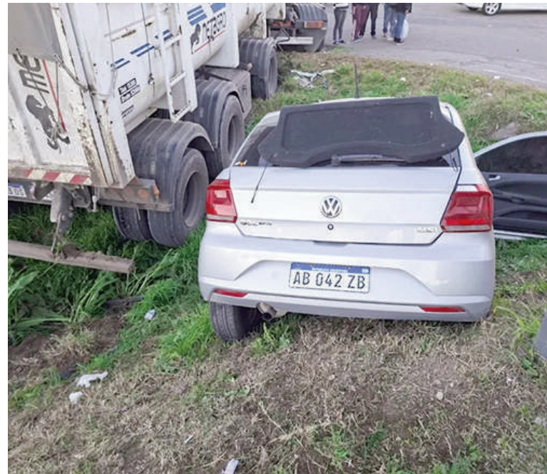
El choque entre el camión y el auto ocurrió frente a la Escuela Agropecuaria.

Tras el choque, personal del Sistema de Atención Médica de Emergencias asistió a la conductora en