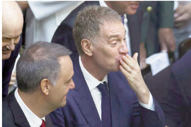
El equipo de Santilli ya trabaja en la sucesión de Adorni como jefe de Gabinete.

Tras la confirmación de Diego Santilli como nuevo jefe de Gabinete, dirigentes del oficialismo y del PRO expresaron su respaldo a la decisión del presidente Javier Milei y le desearon éxito al flamante funcionario de cara