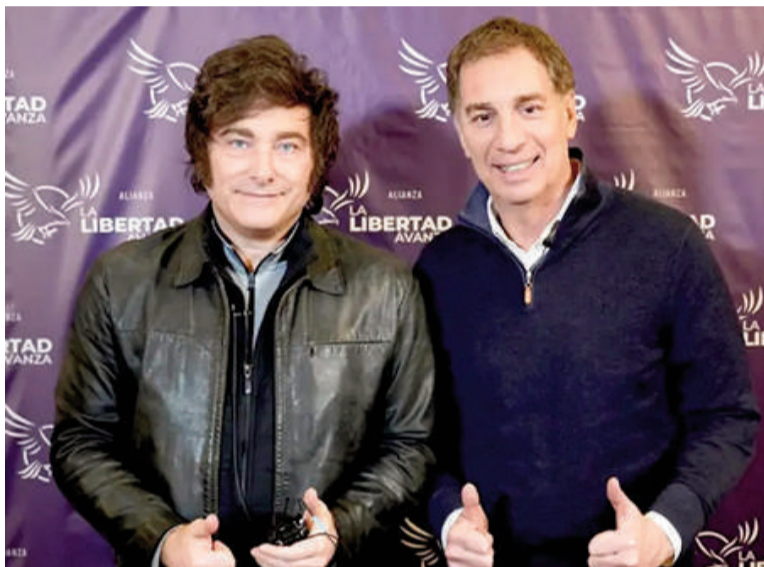
El Presidente junto al electo jefe de Gabinete.

vocó a diputados y senadores de LLA para el próximo miércoles a las 9.30 a una reunión en la Casa de Gobierno, para ordenar cómo avanzará la agenda del oficialismo en el Congreso.