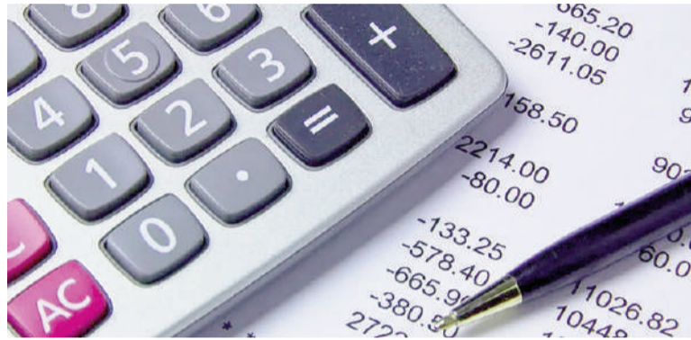
PBA cada vez menos transparente.

Buenos Aires quedó, junto a Mendoza y otras seis provincias, dentro del grupo de jurisdicciones que presentaron mayores niveles de incumplimiento en la publicación de in-