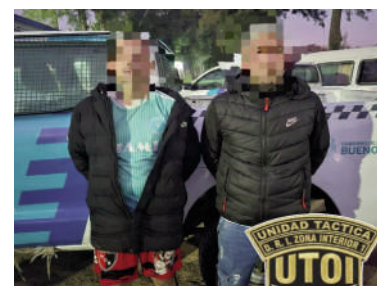
Los aprehendidos en Baradero.

La causa fue caratulada como «Evasión – Detención». De acuerdo con la información oficial, durante el procedimiento no se secuestraron elementos.