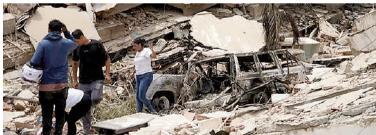
Continúa aumentando la cifra de muertos en Venezuela.

«En el parte del día de hoy (domingo) debemos reportar que la cifra de fallecidos llega a 1.450 personas, mujeres y hombres que perdieron la vida como consecuencia de la más brutal catástrofe natural que haya sufrido nuestro país en su historia», señaló Rodríguez en un balance transmitido por el canal estatal Venezolana de Televisión (VTV).