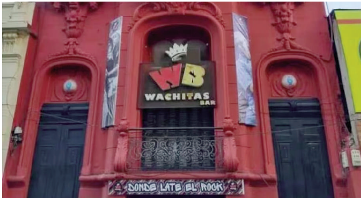
El bar «Wachitas» fue clausurado.

Alvear», un lugar que, según sostuvo Carla, funciona «igual» que Wachitas y otros locales similares en cuanto al sexo, la prostitución y los estupefacientes.