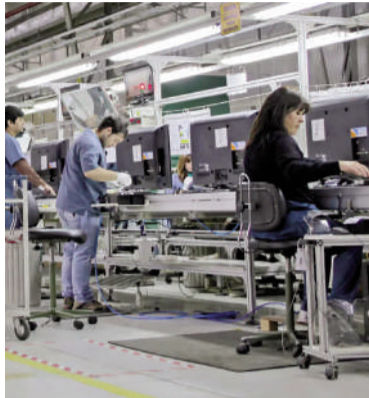
El empleo privado perdió 7600 puestos de trabajo en marzo.

El reporte puntualiza en la dinámica contrastante entre la actividad y el empleo, señalando que mientras que el Producto Interno Bruto (PIB)