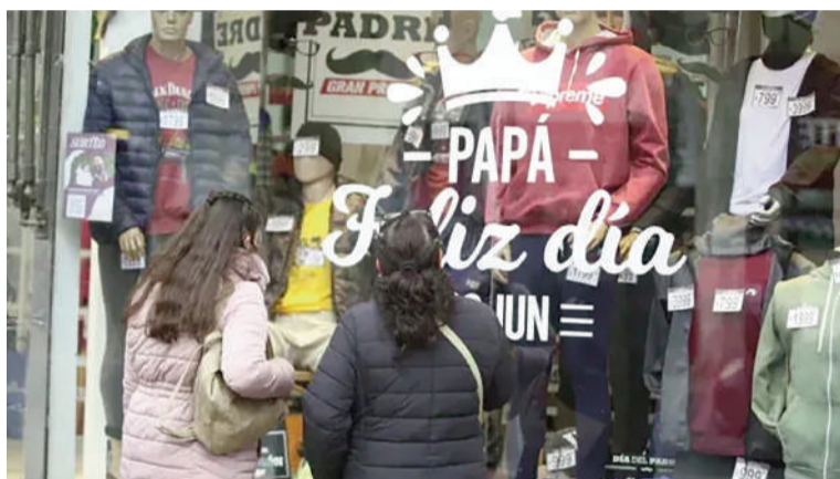
Las ventas del Día del Padre volvieron a mostrar cautela por parte de los consumidores

En tanto, apenas el 7,4% sostuvo que la fecha fue determinante para impulsar la actividad comercial, mientras que el 18% aseguró que no produjo ningún