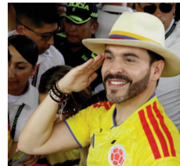
Abelardo de la Espriella.

Según los resultados del preconteo expuestos por la Registraduría Nacional del Estado Civil, el aspirante de la derecha alcanzó 12.941.992 votos, mientras que el de la izquierda logró 12.694.863 votos.