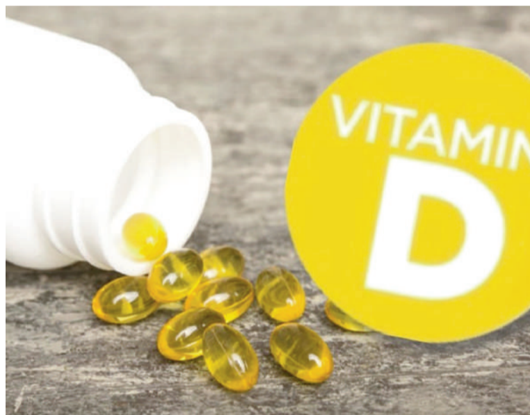
La constancia diaria define el impacto de la suplementación con vitamina D.

No obstante, Ehsani reconoce que quienes comen fuera de casa o tienen horarios poco predecibles pueden tener dificultades para acompañar el suplemento de una comida. En estos casos, consultar con un profesional sanitario permite ajustar la pauta de manera personalizada.