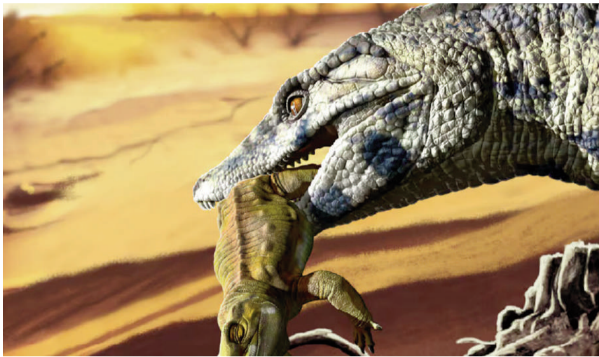
Antusuchus rionegrinus era un cocodrilo terrestre del tamaño de un perro mediano, adaptado a la vida en tierra firme.

llados cerca de La Piedra Sola se realizó mediante técnicas de vanguardia que permitieron analizar los fósiles sin dañarlos. Entre los métodos utilizados se destacan las tomografías computadas de alta resolución para observar estructuras internas, la microscopía electrónica y la preparación mecánica (utilizada para extraer y limpiar fósiles en rocas) realizada por especialistas de la Fundación Azara.