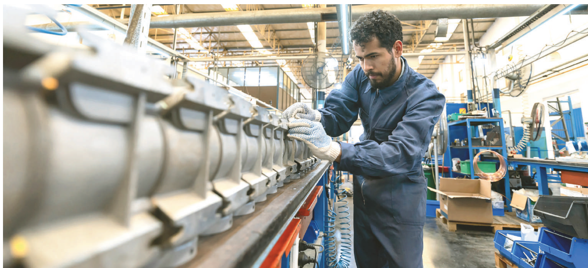
En el aglomerado San Nicolás-Villa Constitución, el desempleo golpea especialmente en las pymes metalúrgicas.

El último relevamiento del Instituto Nacional de Estadística y Censos consignó que en el cuarto trimestre de 2025 la desocupación alcanzaba al 9,4% de la población económicamente activa del aglomerado urbano San Nicolás-Villa Constitución. Aquella fue la tercera cifra más alta de la última década, detrás de lo que ocurría en el primer trimestre de 2020 (11,5%) y el mismo periodo de 2019 (11,7%). Hoy se conocerá el reporte de Mercado de Trabajo centrado en lo que dejó el primer tramo de este año.