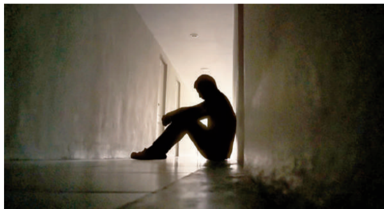
En 2025 en San Nicolás hubo 23 suicidios consumados.

de muertes por suicidio y cuantificación es limitada debido a que las defunciones atribuibles a causas externas presentan particular complejidad en su registro y análisis para establecer con precisión la naturaleza, circunstancias e intencionalidad de los decesos.