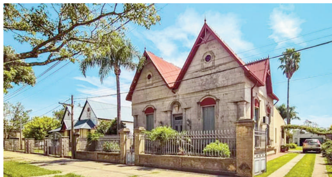
Zenón Pereyra, la localidad santafesina que pugna por el premio.

Fueron seleccionados entre 56 postulaciones presentadas por localidades de 19 provincias.