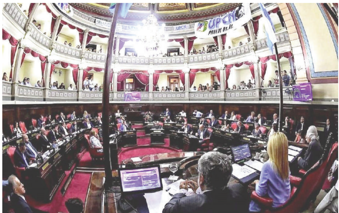
Volverá la actividad al recinto.

La convocatoria del próximo 24 de junio también podría marcar el regreso de la prensa al recinto. Según se supo existe la expectativa de que vuelvan a habilitarse los palcos destinados a periodistas, cerrados desde hace más de un año por decisión de Magario. Las acreditaciones ya fueron cursadas.