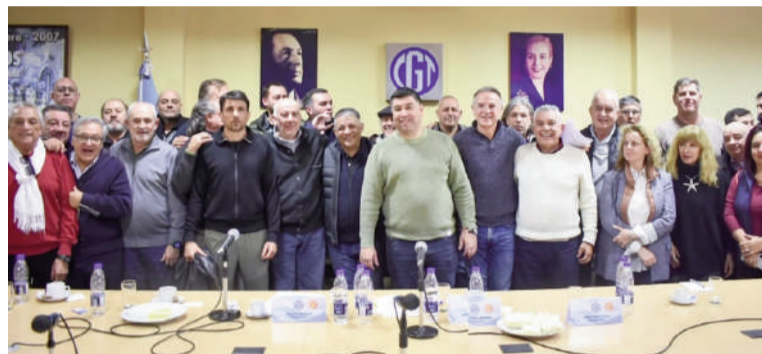
La CGT analiza implementar medidas de fuerza escalonadas, por actividad.

Luego de un paréntesis de sus reuniones por el viaje de algunos dirigentes a la conferencia de la Organización Internacional del Trabajo (OIT), que finalizó el viernes pasado, los líderes de la CGT convocaron a las confederaciones sindicales para empezar a debatir cómo seguirá el plan de lucha y en el encuentro de ayer miércoles, a partir de