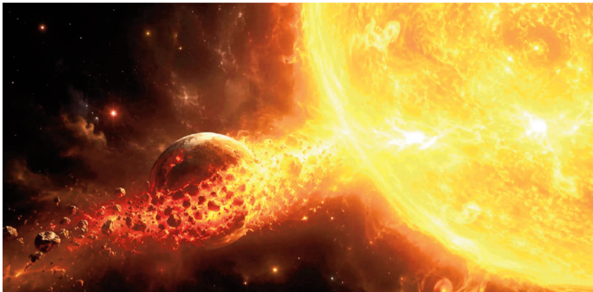
El proceso de engullimiento, cuando una estrella absorbe uno de sus propios planetas, ayuda a explicar la anomalía química de TOI-5882.

Para detectar la composición química de las estrellas, los astrónomos analizan la luz que emiten utilizando instrumentos llamados espectrógrafos. Estos aparatos descomponen la luz estelar en un espectro, mostrando líneas oscuras y brillantes que funcionan como huellas dactilares de cada elemento. Al estudiar la intensidad y la posición de estas líneas,