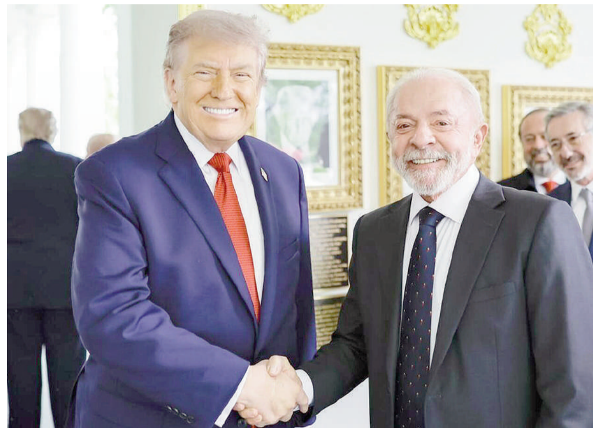
Donald Trump y Lula Da Silva en tiempos cordiales.

El presidente estadounidense afirmó que el país sudamericano es "un poco peligroso políticamente".