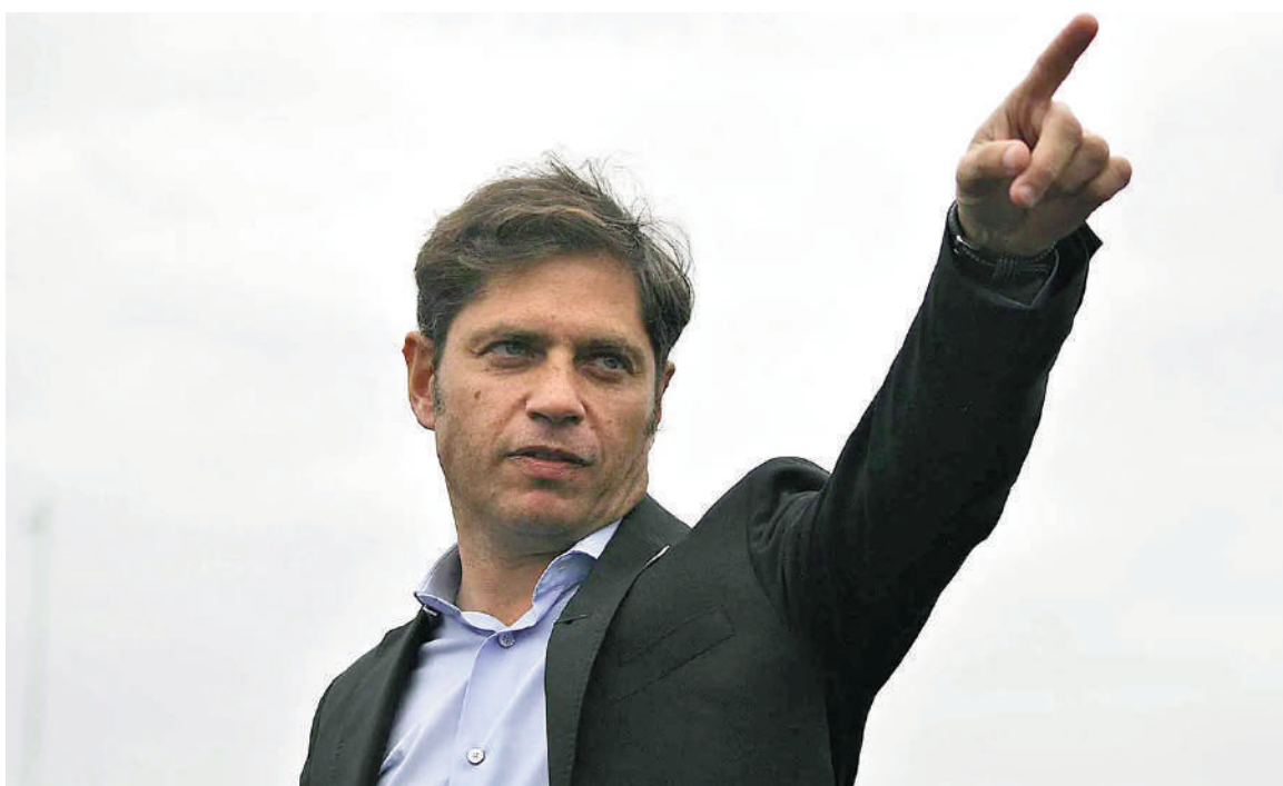
Desde la Gobernación bonaerense confirmaron las actividades de Kicillof en Pergamino, Ramallo y San Pedro.