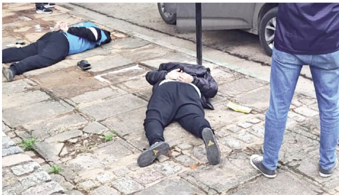
Los operativos dejaron varias detenciones.