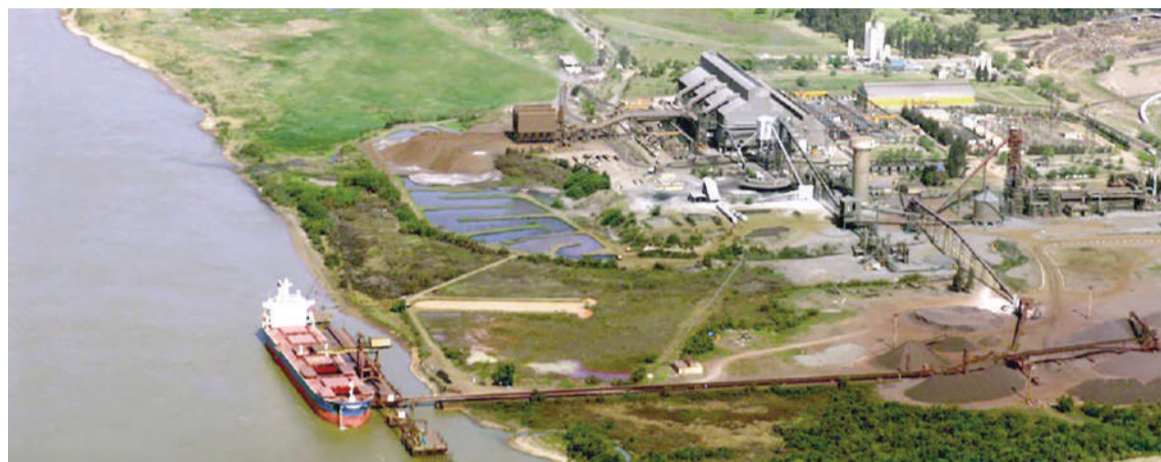
La planta de Villa Constitución frenará la producción de la acería durante la próxima semana.

La decisión apunta a evitar tener niveles de stocks demasiado elevados, con los costos que ello implica. En este caso, entre enero y mayo se acumularon aproximadamente 10.000 toneladas de más - a razón de 2.000 por mes- que hoy