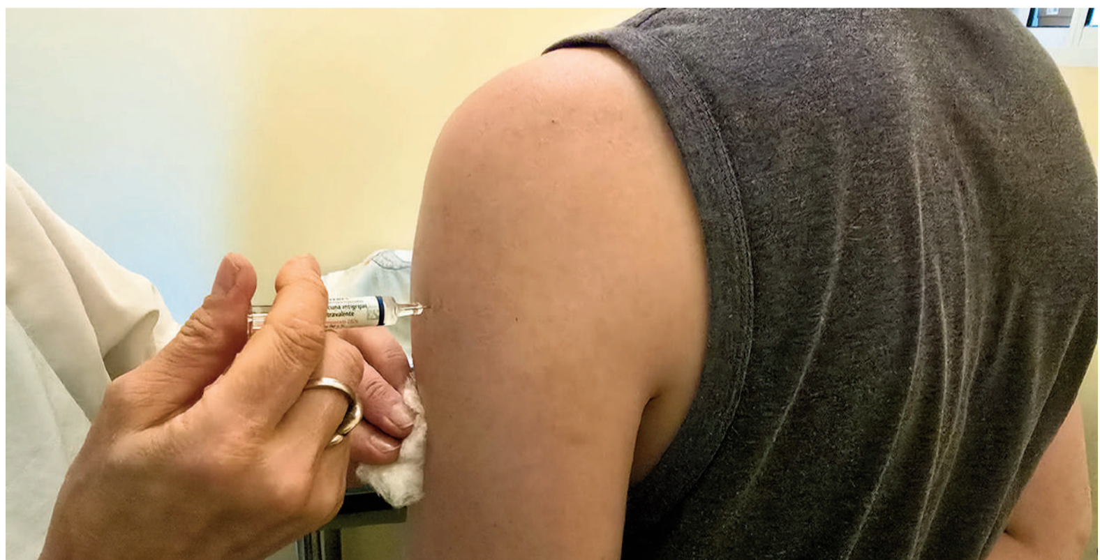
La vacuna antigripal es la medida de prevención más eficaz para evitar cuadros graves de la enfermedad.

de la vacunación. "Ante el aumento de casos, mucha gente que aún no estaba vacunada se acercó a los vacunatorios, tanto pediátricos como para adultos, principalmente los adultos mayores", comentó la funcionaria, quien señaló que alrededor de 19.000 nicoleños ya se aplicaron la vacuna antigripal.