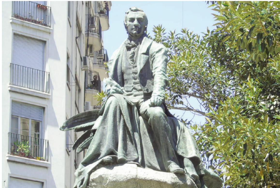
Como hombre de Mayo, Mariano Moreno creó la biblioteca pública y el órgano oficial del gobierno revolucionario La Gazeta .

"Ha resuelto la Junta formar una biblioteca pública, en que se facilite a los amantes de las letras un recurso seguro para aumentar sus conocimientos [...]. Por fortuna tenemos libros bastantes para dar principio a una obra que crecerá en proporción