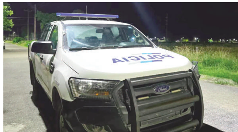
La DDI San Nicolás y la UFI N° 2 investigan el robo a mano armada.