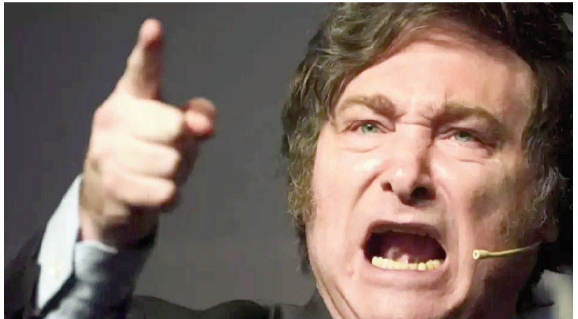
Los reiterados ataques del presidente Javier Milei a los periodistas erosionan la libertad de prensa en la Argentina.

El informe de RSF no solo advirtió sobre la situación argentina, sino que trazó un panorama preocupante a escala mundial. La edición 2026 marcó el peor nivel de libertad de prensa en los últimos 25 años. Más de la mitad de los países evaluados se encuentran actualmente en condiciones "difíciles" o "muy graves", un contraste marcado con el escenario de 2002, cuando esos niveles eran excepcionales. Entre las causas del deterioro global, la organización señaló la expansión de marcos legales restrictivos y el aumento de la criminalización del periodismo, incluso