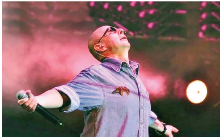
Hoy despiden los restos del "Indio" Solari.

portivo público de 10 hectáreas ubicado en Villa Domingo, en el partido de Avellaneda del Gran Buenos Aires. Habrá un operativo de seguridad de 1500 personas, 700 de los cuales se presentaron desde ayer a la mañana en el lugar. Cabe mencionar que entre la tarde del viernes y las primeras horas del sábado, el lugar del velatorio del Indio Solari quedó en el centro de una disputa que involucró al Gobierno nacional, la familia del músico y distintos organismos del Estado. Mientras el cuerpo fue trasladado a la morgue de Ituzaingó para la autopsia, la familia avanzó en conversaciones con Racing Club para realizar el homenaje en el estadio del club de Avellaneda, que fue la primera opción firme, aunque se fue diluyendo con el paso de las horas.