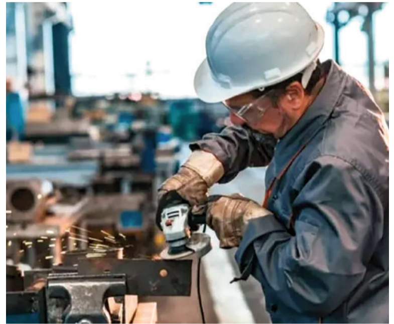
El MDI subió, pero la UIA advirtió que la mejora es estacional.

El MDI de abril continuó mostrando señales de debilidad, donde