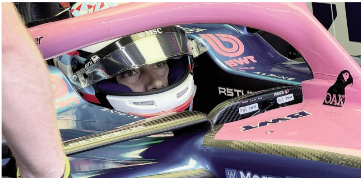
Franco Colapinto partirá desde la 14ta. posición en Mónaco.

El argentino pasó a la Q2 en la clasificación del Gran Premio de Mónaco y partirá en el puesto 14 en la final que se disputará desde las diez de la mañana de nuestro país. No viene siendo un fin de semana ideal para Franco. "Hice lo mejor que pude", dijo ayer.