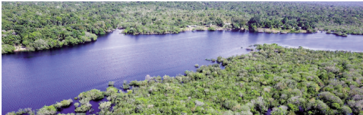
Un estudio publicado en Science Advances detalla la desoxigenación generalizada y persistente que afecta a los ecosistemas fluviales a nivel global.

El estudio demostró que la mayor caída de oxígeno se observa en ríos tropicales ubicados entre los 20° al sur del ecuador y los 20° al norte del