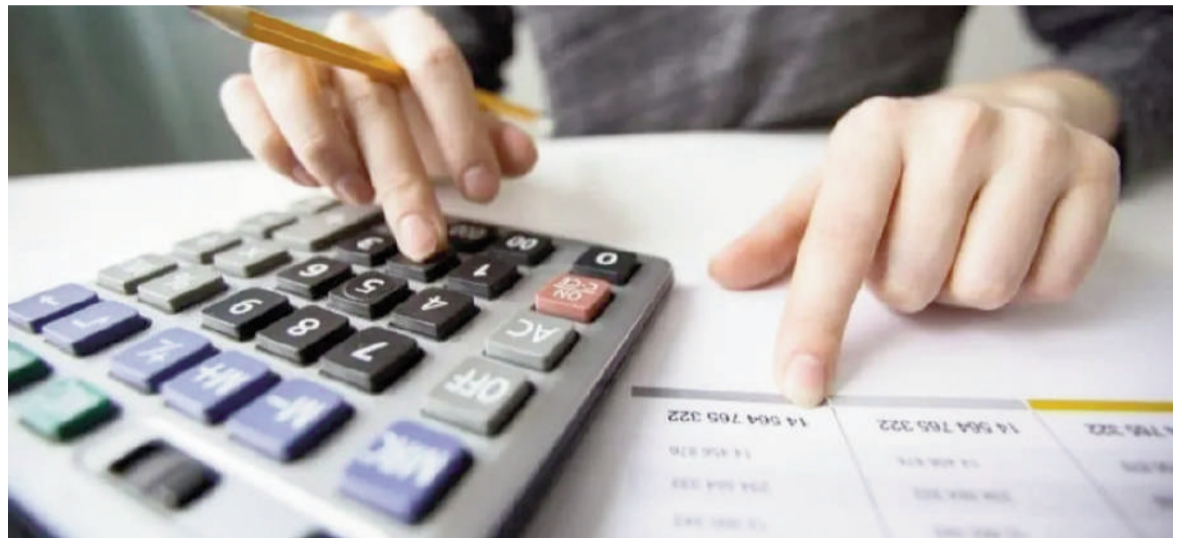
Se vienen aumentos en casi todos los sectores.

Este aumento se basa en el mecanismo de actualización de tarifas que sigue la inflación más un adicional de 2 puntos porcentuales.