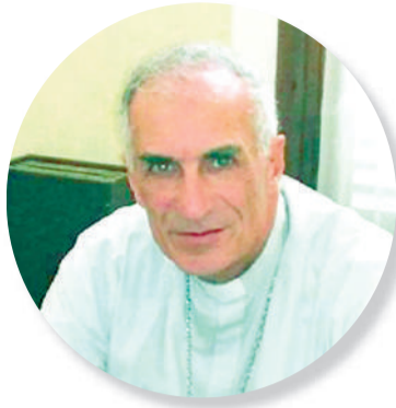
Por monseñor Hugo Norberto Santiago Obispo de la Diócesis de San Nicolás

1966 - GOLPE DE ESTADO. La autodenominada Revolución argentina encabezada por el general Juan Carlos Onganía derroca al presidente constitucional Arturo Umberto Illia, apodado "la Tortuga" por influyentes medios de prensa. Lo acusaban de "una inflación galopante" del 12% anual, entre otros reproches.