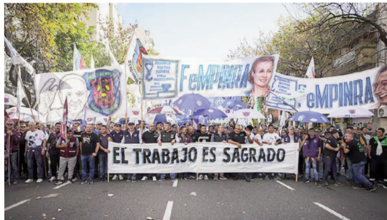
Cae el empleo público e independiente.

Mientras que el trabajo independiente registró una caída intermensual del 0,6% también en todas sus variantes, desagregándose en bajas en el monotributo social con un -2,1%, autónomos con un -1,3% y el monotributo con un -0,3%. En comparación con el mismo período del año anterior, el empleo asalariado se redujo 1,2%, lo que equivale a 116.500 trabajadores menos, registrándose mermas en el sector asa-