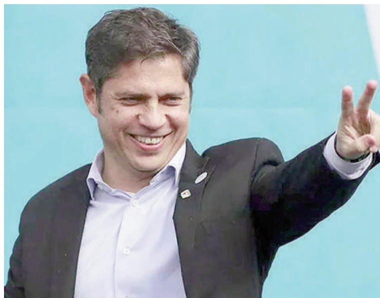
El gobernador bonaerense Axel Kicillof.

traban representantes sindicales de distintos sectores, entre ellos