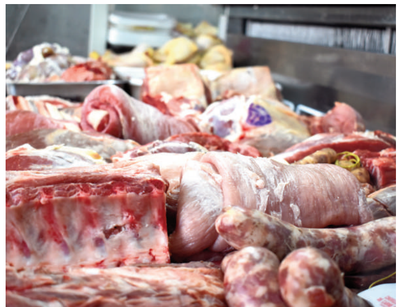
El de las carnes vacunas fue el segmento que mayores incrementos registró en los últimos once meses.

El relevamiento mensual que realiza EL NORTE compara los precios de los mismos productos en las sucursales de Carrefour (Mitre 264), Joki (Rivadavia y Paraná), 3M (Illia 597), José Market Express (Lavalle 71), Supermer-