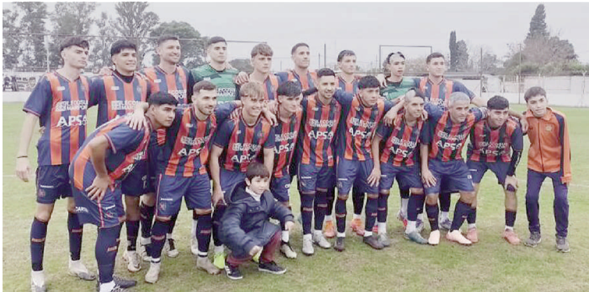
El conjunto de la ribera ganó como visitante y se consolidó en la cima.