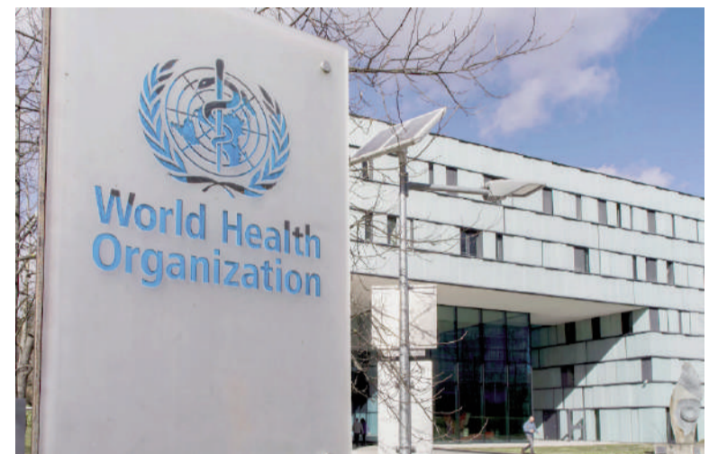
La OMS y un llamado de atención a la Argentina.

El titular de la organización internacional instó a ambos países a reconsiderar sus decisiones: "Creo que reconsiderarán sus decisiones porque pueden ver lo importante