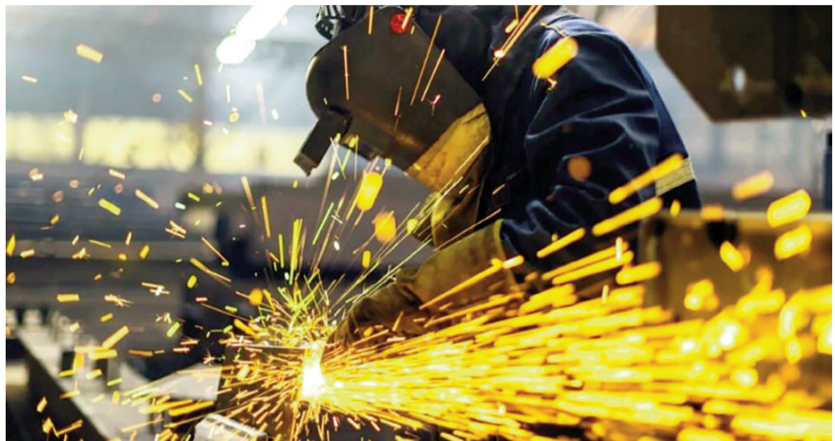
La industria repuntó en marzo, tras ocho meses de caídas.