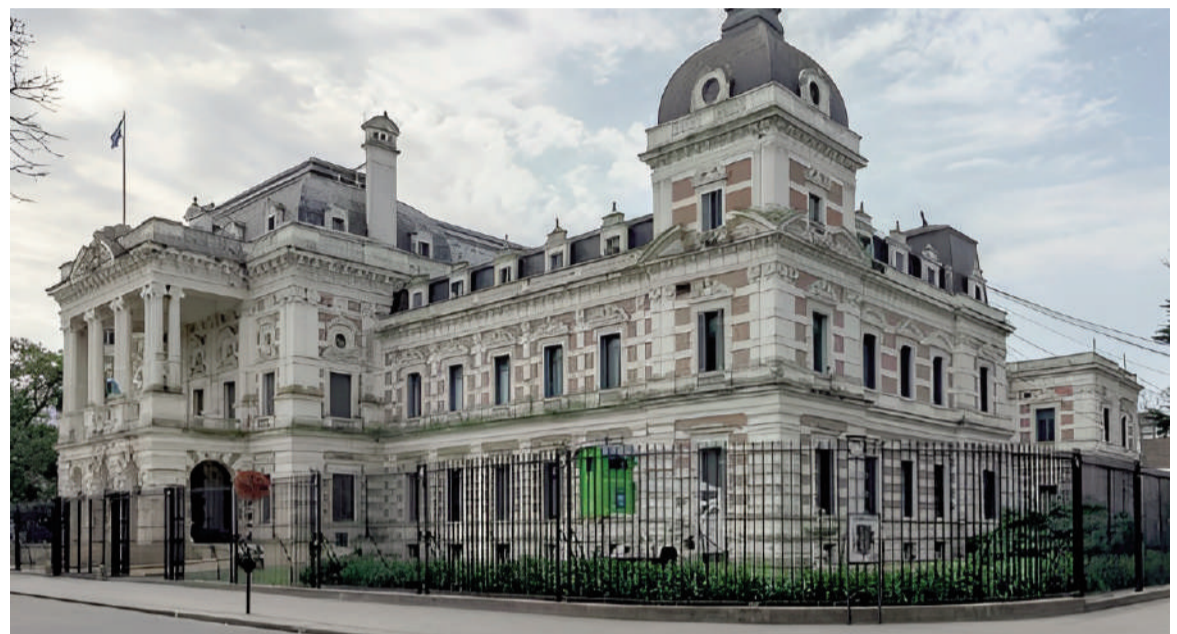
Casa de Gobierno platense.

el pago de sueldos y aguinaldos, lo de las obras en este contexto es secundario", disparó días atrás un intendente radical, sintetizando la preocupación creciente por la caída de la coparticipación y el derrumbe en la cobrabilidad de tasas municipales.