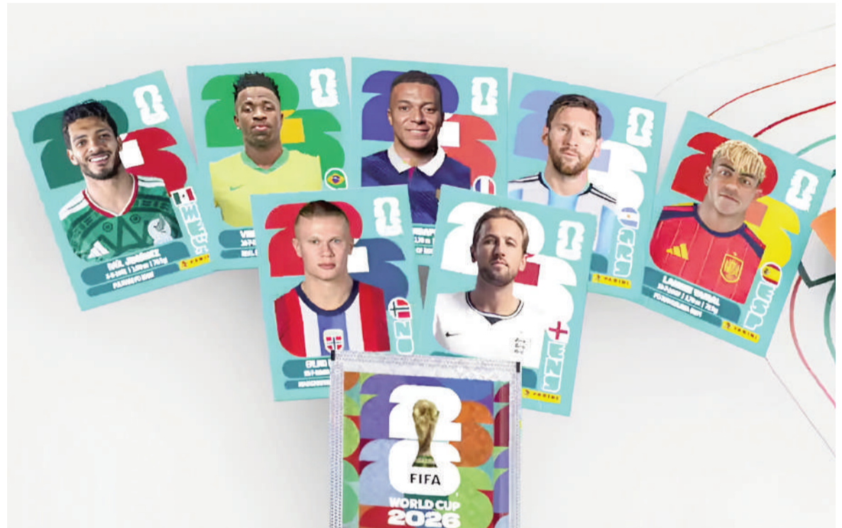
Así es el álbum del Mundial 2026 de Panini.

"Al saltarse al kiosco, el distribuidor se termina 'comiendo' nuestro margen. Nosotros le compramos el paquete al figuretero a $1600 y lo vendemos al público a $2000, que es el precio que fija Panini, y esos