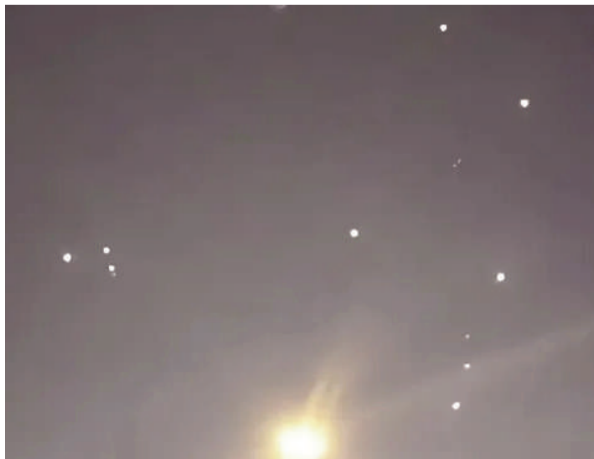
El intercambio de ataques se produjo en las inmediaciones del estrecho de Ormuz.

Washington aseguró que respondió a ataques "no provocados" de Irán contra buques estadounidenses que atravesaban el estrecho de Ormuz. Teherán denunció bombardeos sobre zonas civiles y acusó a Donald Trump de violar la tregua vigente desde abril.