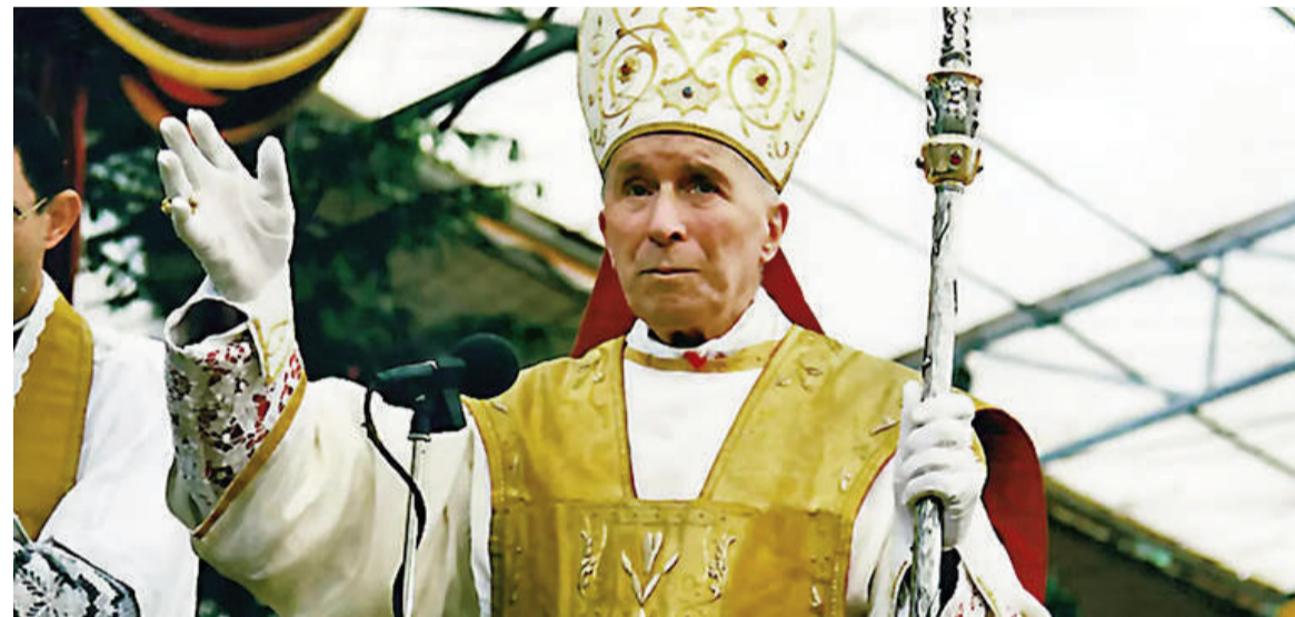
El fallecido Marcel Lefebvre, arzobispo francés y fundador de la Fraternidad San Pío X, fue excomulgado por ordenar obispos sin permiso del Papa.

La Fraternidad San Pío X, fundada por el arzobispo francés Marcel Lefebvre en oposición a las reformas del Concilio Vaticano II, planea ordenar cuatro obispos en julio sin autorización pontificia. Es la crisis más grave entre Roma y los lefebvristas desde 1988.