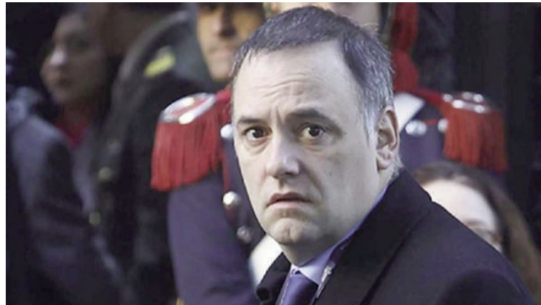
Ahora investigan a Adorni por criptomonedas no declaradas.

La investigación también podría sumar en los próximos días la intervención de ARCA para profundizar el análisis sobre presuntos pagos no registrados. Según trascendió, el objetivo