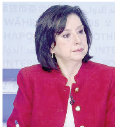
La vocera del FMI, Julie Kozack.

En abril, luego del anuncio de la aprobación de la revisión por parte del staff técnico, el Fondo destacó, en un comunicado, que como resultado de las medidas acordadas y previamente mencionadas, "las compras de divisas del banco central superaron los USD 5.500 millones en lo que va del año", lo que permitió una mejora en la capacidad del país para "gestionar shocks". El comunicado puntualizó que la Argentina seguía resistiendo bien los efectos derivados de la guerra en Medio Oriente, dados los avances en sus fundamentos y su condición