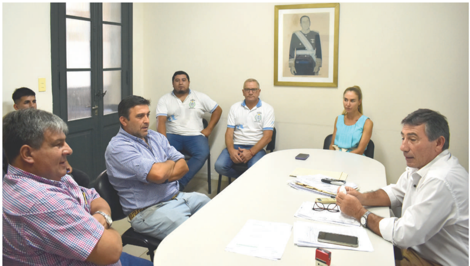
UTA y EVHSA tuvieron ayer una audiencia de conciliación en la delegación local del Ministerio de Trabajo bonaerense.

"Hoy hubo audiencia entre la empresa Vercelli y UTA, sin posibilidad de que llegásemos a un acuerdo por la deuda que la prestadora mantiene con los trabajadores. No llevaron al Ministerio ninguna propuesta y adujeron, además, que pueden llegar a suspender gente o despedir trabajadores. La UTA ha