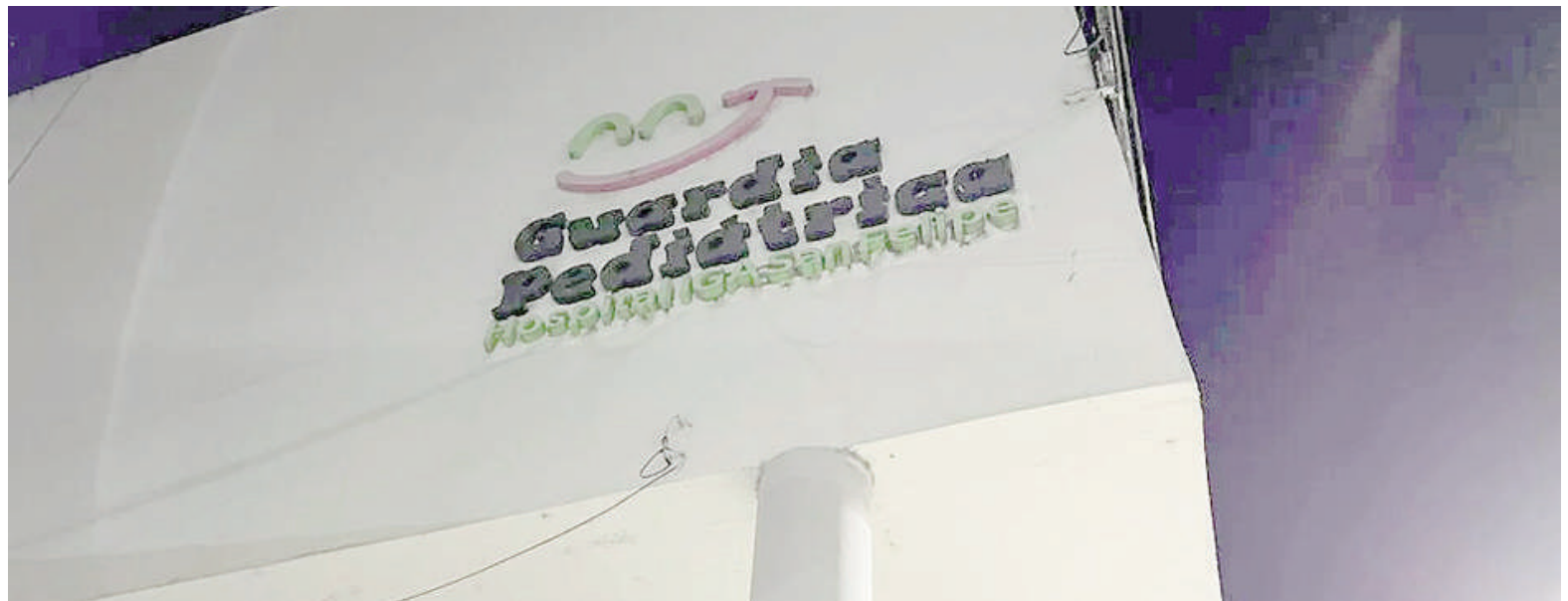
Se investiga la muerte de un bebé en el Hospital San Felipe.

Sin embargo, la investigación busca determinar con precisión los factores previos que desen-