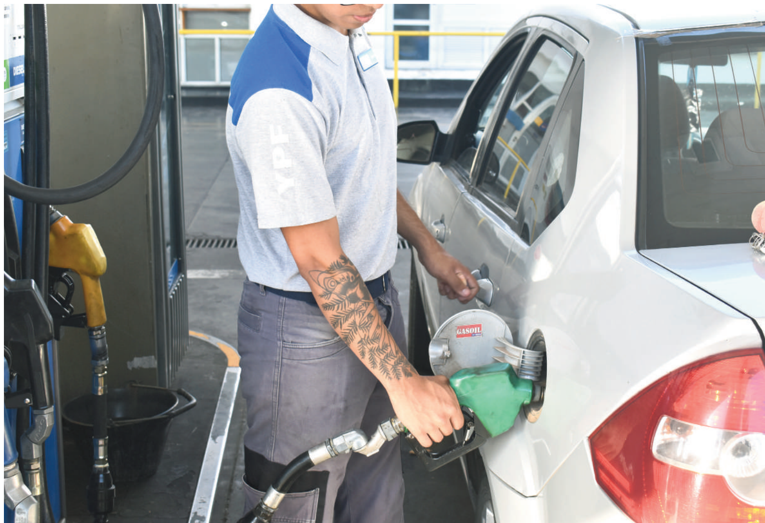
En San Nicolás, el litro de nafta súper costaba $1668 antes de la guerra y ahora, $2111.

“Reiteramos nuestro compromiso honesto y moral con todos los consumidores, preservando la demanda en un contexto de libre