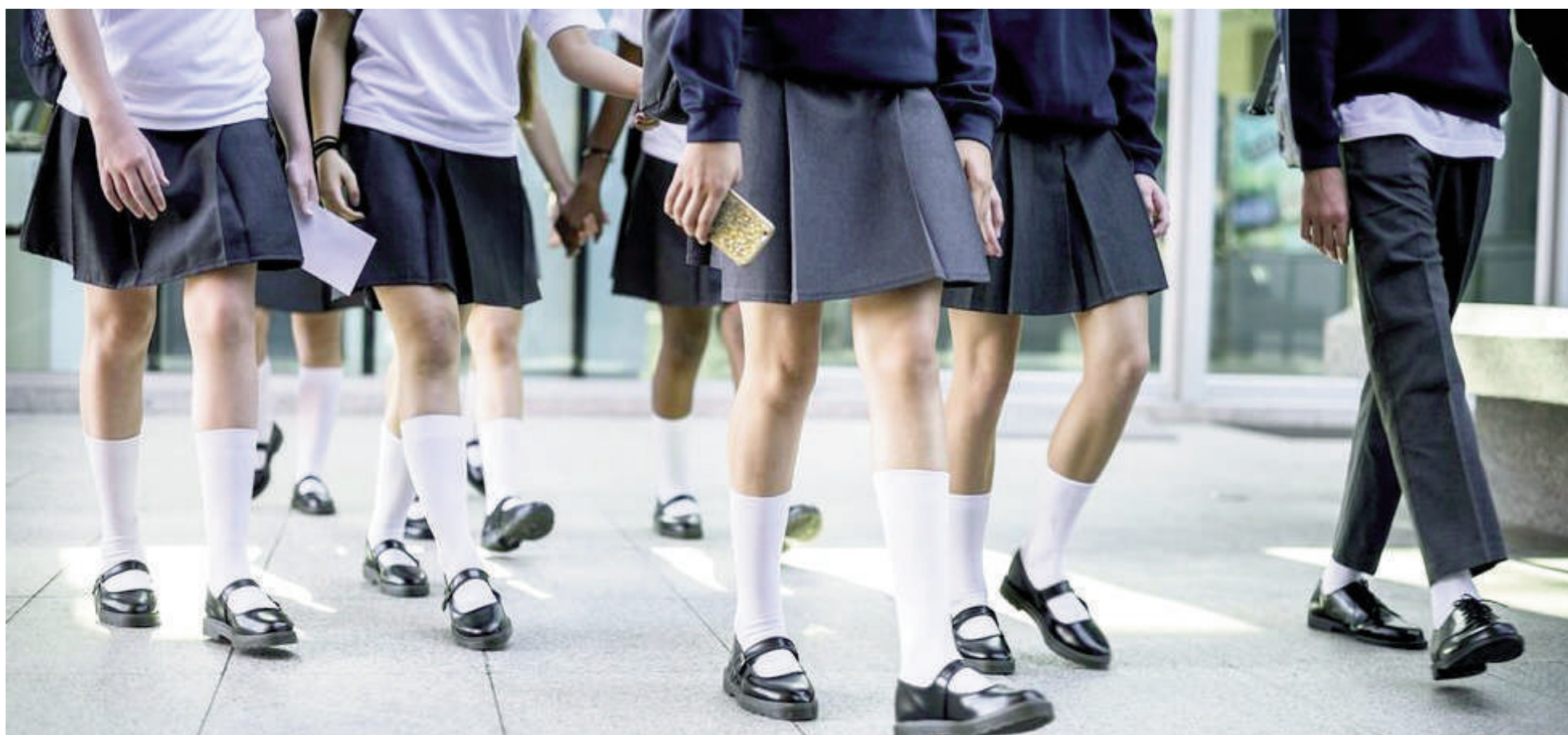
El aumento en las cuotas de colegios privados alcanza a los establecimientos que reciben aportes estatales para afrontar los gastos de funcionamiento.

Desde el inicio del ciclo lectivo a la fecha, las cuotas de colegios privados aumentaron en el territorio bonaerense un 13,5 por ciento. La cifra supera la inflación acumulada en Argentina durante el primer trimestre de 2026 (enero-marzo), que fue del 9,4% según el informe del Indec, aunque todavía no se conocen las estadísticas correspondientes a abril y mayo. La Asociación de Institutos de Enseñanza Privada de Argentina (Aiepa) afirma que hay desfinanciamiento del sector.