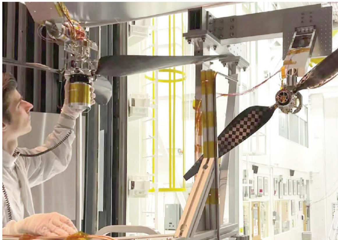
Los nuevos helicópteros podrán transportar instrumentos científicos avanzados y baterías de larga duración.

El Laboratorio de Propulsión a Chorro (JPL) de la NASA en el sur de California fue el escenario donde un equipo de ingenieros llevó al límite los nuevos rotores destinados a futuras misiones marcianas. De acuerdo con la agencia espacial, los ensayos permitieron que las puntas de los rotores superaran Mach 1, la velocidad del sonido, sin que se produ-