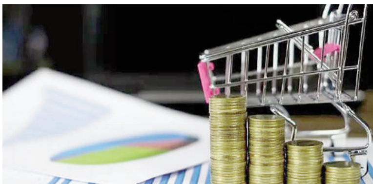
El 56,8% de las familias no logró cubrir la canasta alimentaria en abril.

Sin embargo, el informe advierte que este último punto no responde a una mejora estructural, sino a la contracción de la demanda por el deterioro del ingreso real. En el acu-