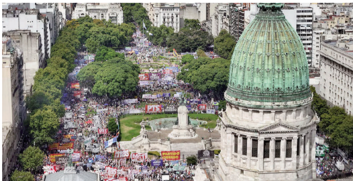
La reforma la aprobó el Congreso.

Según se pudo saber, el Gobierno —a través del Ministerio de Capital