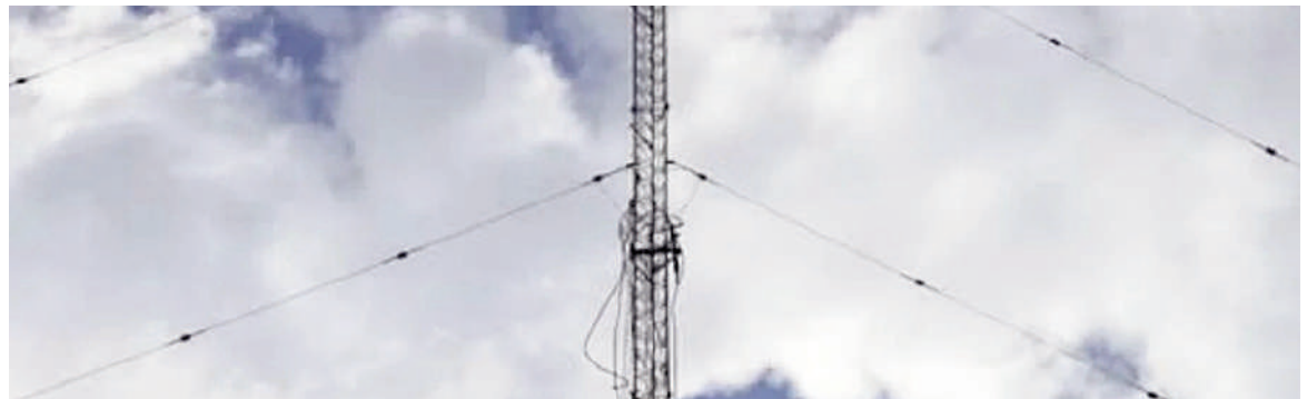
El hombre estaba en lo más alto cuando cayó.

Luego del llamado de los vecinos, varios móviles policiales y una ambulancia del Sistema Integrado de Emergencias Sanitarias (SIES) llegaron al lugar, donde se montó un operativo.