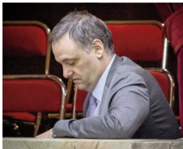
El jefe de Gabinete Manuel Adorni.

de una propiedad en exaltación de la Cruz por USD 13.000. Y les pagó 30.000 dólares a dos jubiladas por el departamento Caballito.