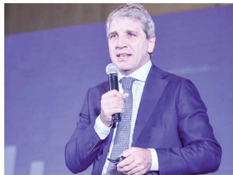
El ministro Luis Caputo.

Y cerró diciendo que es “un cambio fundamental”.