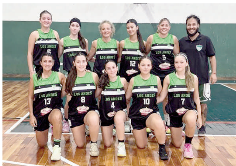
Los Andes sumó su primer triunfo.

Próxima fecha (7ma): Somisa-Automóvil, Sports-Riberas, Los Andes-Sacachispas y Regatas-Belgrano. Libre: Don Bosco.