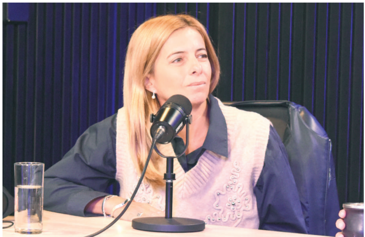
La senadora provincial Emilia Subiza, entrevistada en El Norte Stream.

Subiza remarcó que la experiencia local se convirtió en una referencia para otros distritos bonaerenses. “Se trabaja con una agenda común de qué se puede exportar del modelo San Nicolás a otras ciudades”, explicó,