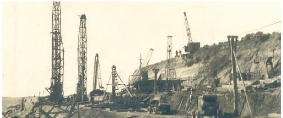
Inicio de obra de la usina de Central Térmica (Colección: Rocío Solé). IMAGEN FOTOTECA SAN NICOLÁS

En 2006, la empresa anunció una inversión de 30 millones de pesos para ejecutar obras en cuatro de sus cinco bloques de generación, lo cual