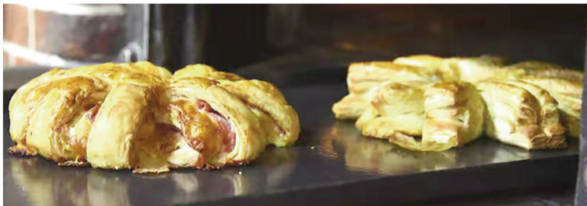
Las cremonas tendrían también un origen ligado al anarquismo.

El asunto es que muchos de esos anarquistas comenzaron a trabajar como panaderos. Dos de ellos, provenientes de Italia, serían los abanderados de la lucha por mejorar las precarias condiciones en que se