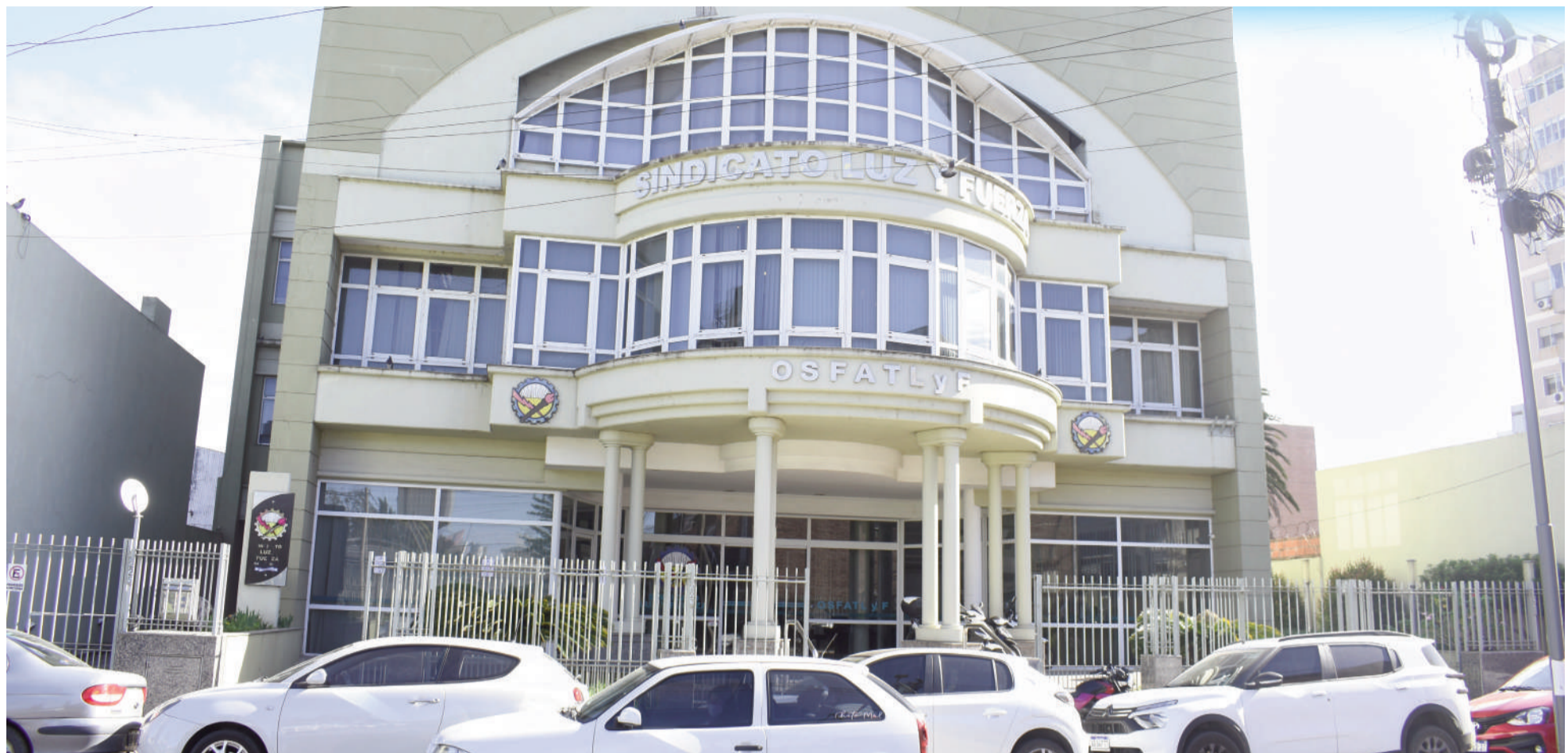
En Garibaldi 221 se encuentra la sede del sindicato de Luz y Fuerza San Nicolás, con los servicios vinculados.