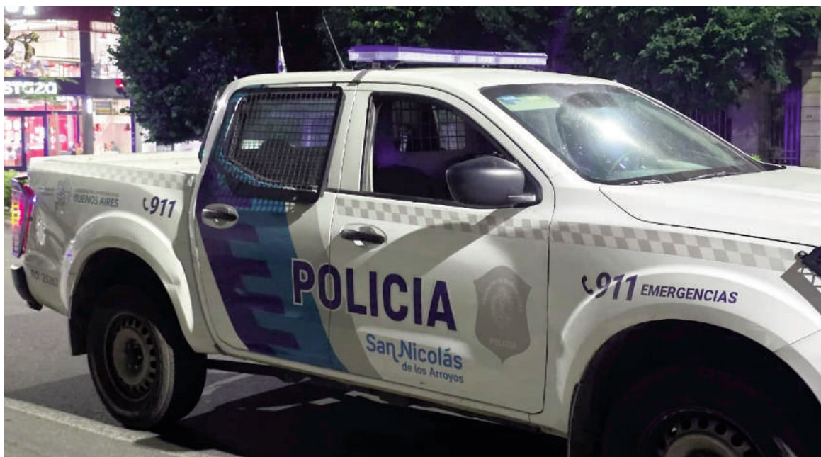
Una familia fue asaltada en su vivienda camino a La Emilia.

Con relación a los responsables, la denunciante indicó que todos eran hombres y que se encontraban completamente encapuchados; además, vestían gorras con visera y prendas que ocultaban sus cuer-