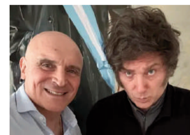
Espert y Milei.

El jefe de Estado defendió además la trayectoria personal y profesional