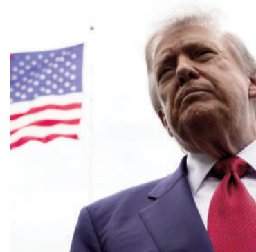
Presidente Donald Trump.

Dijo que Washington cumplió el 70% de sus objetivos en el conflicto y que podría seguir atacando dos semanas más.