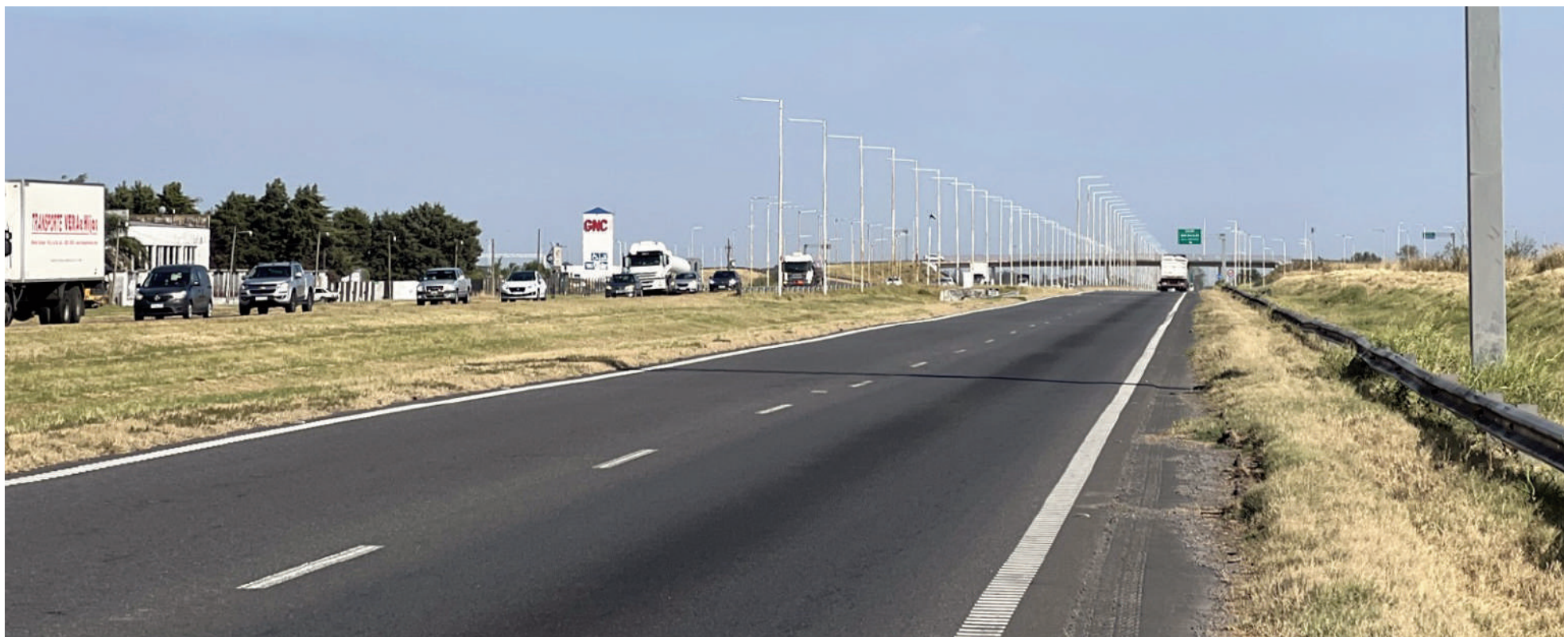
El denominado «Tramo Portuario Sur» incluye los segmentos de las rutas 9 y 188 que atraviesan el partido de San Nicolás. EL NORTE

A las 13:00 de este lunes se producirán los actos oficiales de apertura de sobres en el marco de nuevas licitaciones de la Red Federal de Concesiones. Está contenido el denominado «Tramo Portuario Sur», conformado por los segmentos de las rutas nacionales 9 y 188 que atraviesan el partido de San Nicolás. Se conocerán, entonces, las propuestas de las firmas interesadas en adjudicarse el mantenimiento de los corredores.