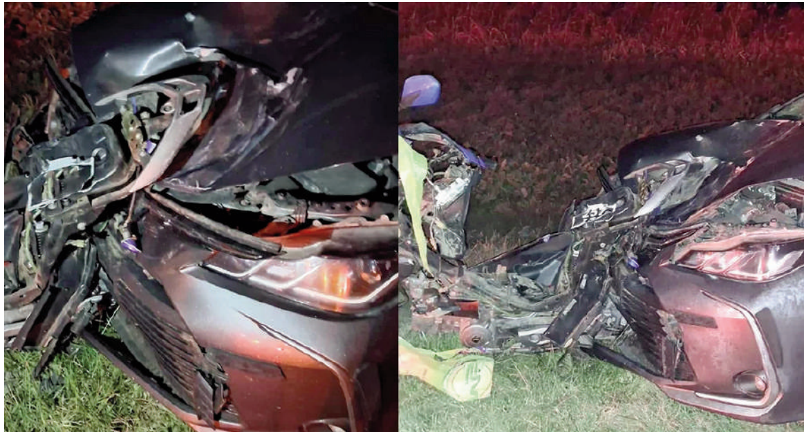
Un joven perdió la vida en la Ruta 188.

El siniestro vial ocurrió alrededor de las 6:15 a la altura del kilómetro 58, en el carril ascendente con sentido San Nicolás-Pergamino. Según informaron fuentes policiales y del Departamento Operativo de Seguridad Vial Zona VIII Junín, por causas que todavía son materia de investigación, colisionaron un automóvil Toyota Corolla y una motocicleta Gilera 110 cc. El auto era conducido por un hombre domiciliado en Pergamino, quien resultó ileso tras el impacto. En tanto, el conductor de la motocicleta falleció en el lugar como consecuencia de las heridas sufridas. Horas más tarde,