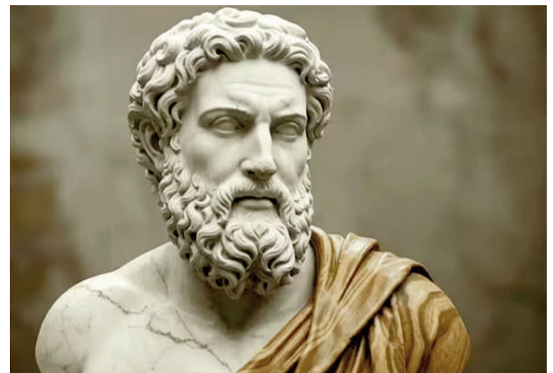
El filósofo griego Aristóteles.

El filósofo escribe en su obra que tratarse de esta forma trae felicidad y que la agresión –concepto opuesto– reduce el bien-