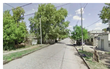
Las calles de barrio Triángulo y Moderno, escenario de uno de los ataques.

Por otro lado, en Pasaje Rezzara y Patricias Argentinas, una mujer de 71 años resultó herida de bala tras una pelea ocurrida entre varias personas. La denuncia a tiempo por parte de vecinos permitió que, mediante una persecución policial, se detuviera a cinco personas involucradas por encubrimiento de los