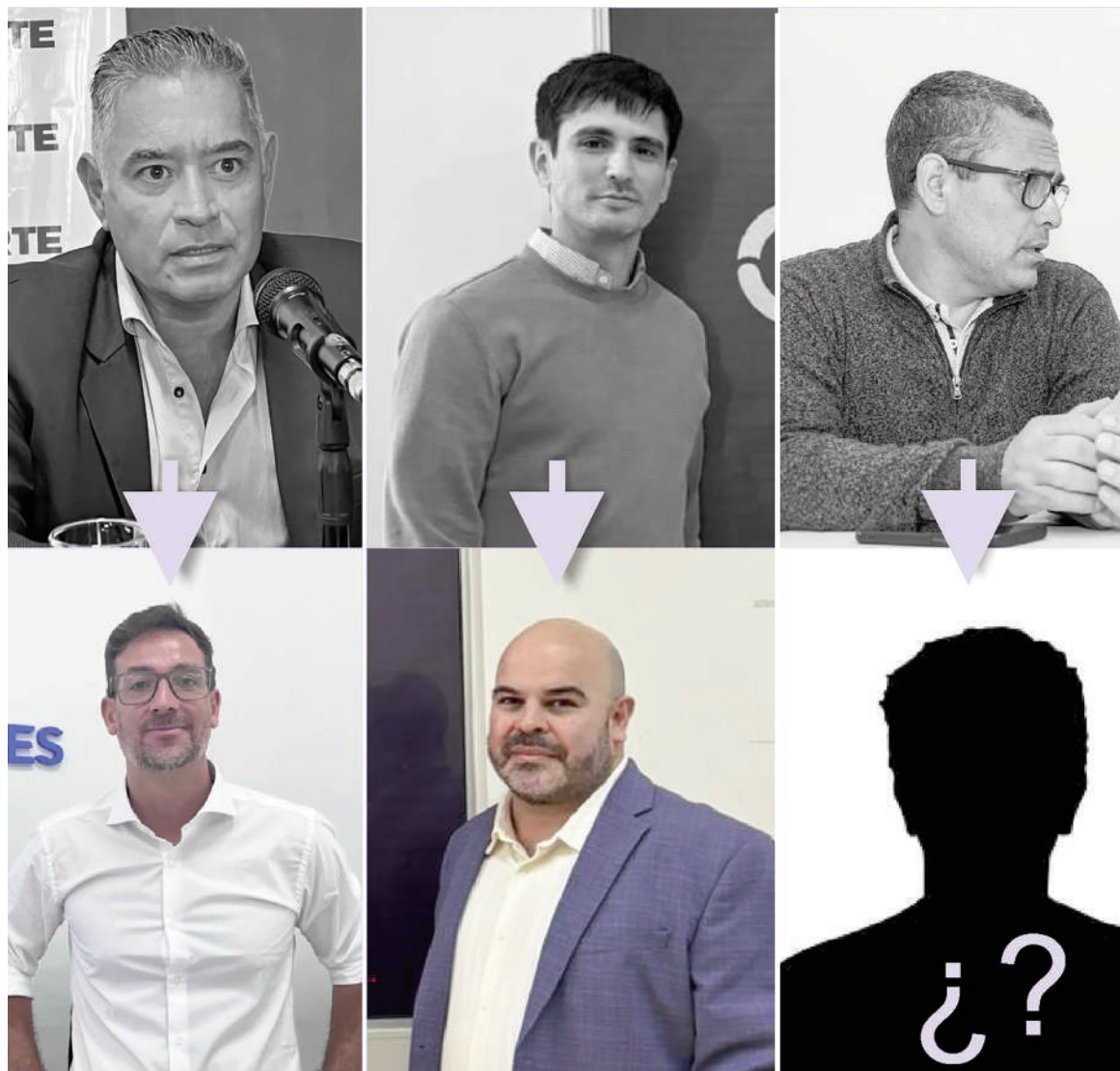
Los cambios producidos en dependencias locales de organismos de la Nación.