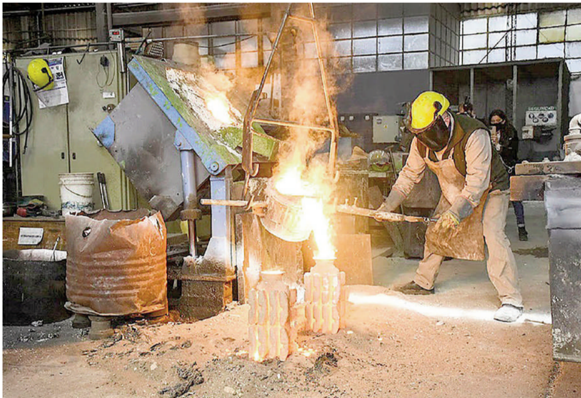
La industria utilizó el 59,8% de su capacidad instalada durante marzo.

Los datos corresponden al informe sobre la utilización de la capacidad