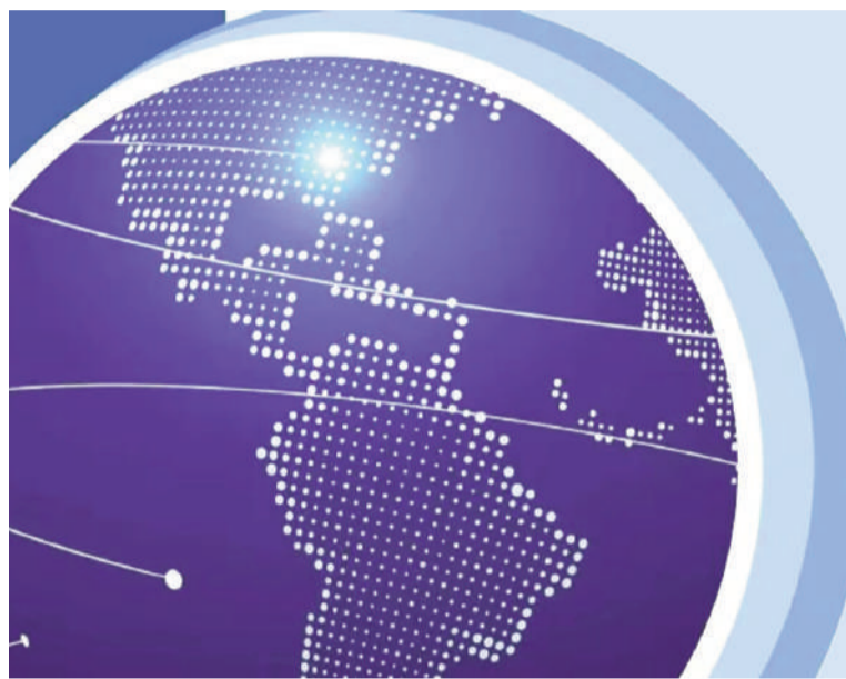
Las barreras principales siguen siendo la inestabilidad normativa y los controles cambiarios.

En contraste, las jurisdicciones más simples para operar este año