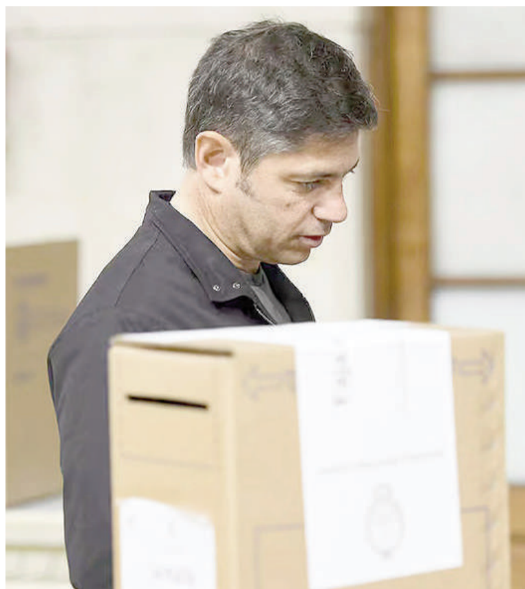
Axel Kicillof ya analiza el calendario electoral de la Provincia para 2027.

Además, la iniciativa propone ampliar de 50 a 60 días el espacio entre la presentación de candidatos y los comicios. La Junta Electoral bonaerense propuso al Poder Eje-