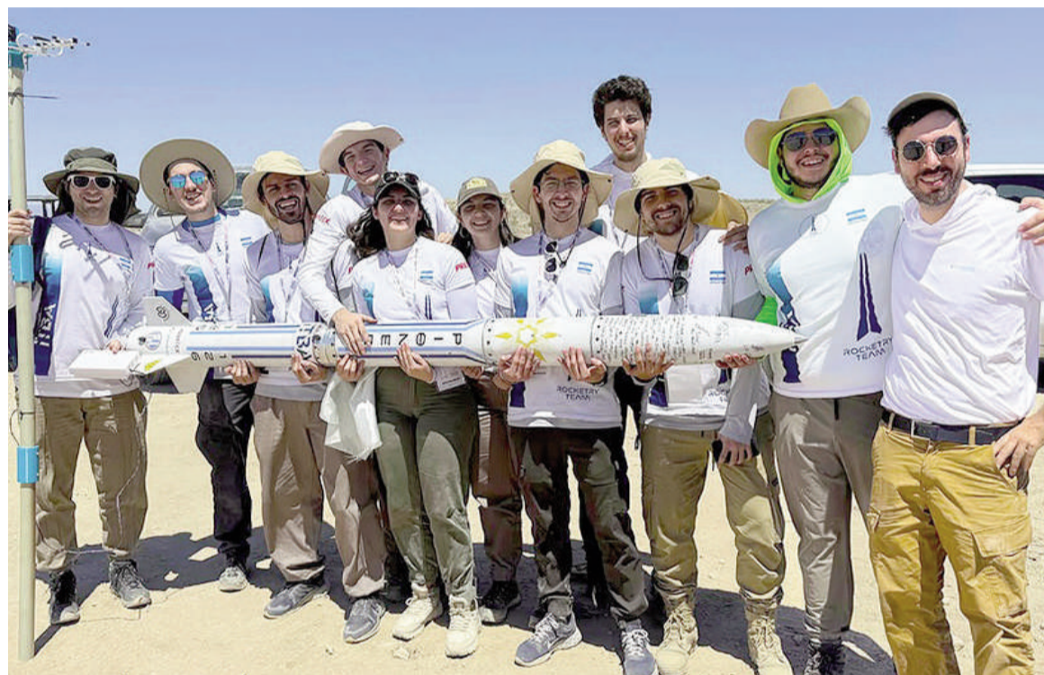
El equipo ITBA Rocketry Team que representará al país en Estados Unidos.

El equipo ITBA Rocketry Team competirá en Texas por tercer año consecutivo.