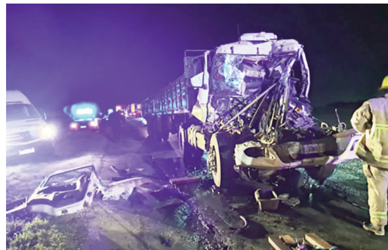
Un nicoleño quedó atrapado entre los hierros del camión.

Tras el rescate y la atención de los heridos, personal de Bomberos y Corredores Viales llevó adelante