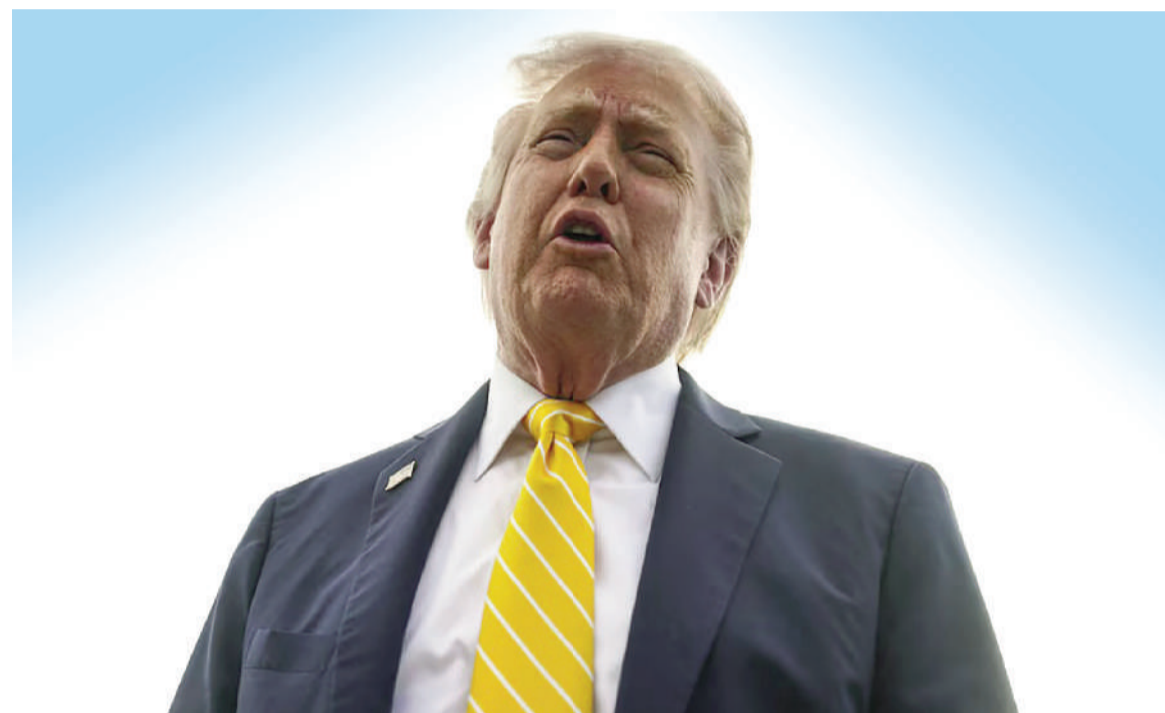
Trump afirmó que revisa un documento iraní para poner fin a la guerra.

El documento, de catorce puntos, incluye demandas como el levantamiento de sanciones y la retirada de fuerzas estadounidenses.