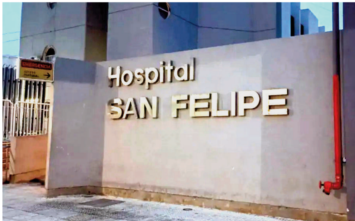
El hombre de 28 años, que presentaba heridas de gravedad, fue trasladado al hospital local donde debieron intervenirlos quirúrgicamente de urgencia.

El hecho se conoció luego de que se identificara al presunto autor del