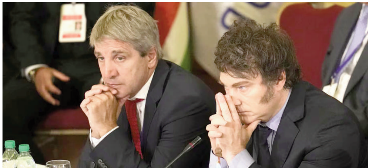
El ministro de Economía Luis Caputo junto al presidente Javier Milei.

Por otra parte, el Gobierno informó que los 12 proyectos aprobados por el RIGI significarán inversiones en el país por US$26.246 millones. A eso se sumarían otros US$764 millones de Diablillos, que ya está aprobado por el comité evaluador. Sin embargo, como publicó TN, los anun-