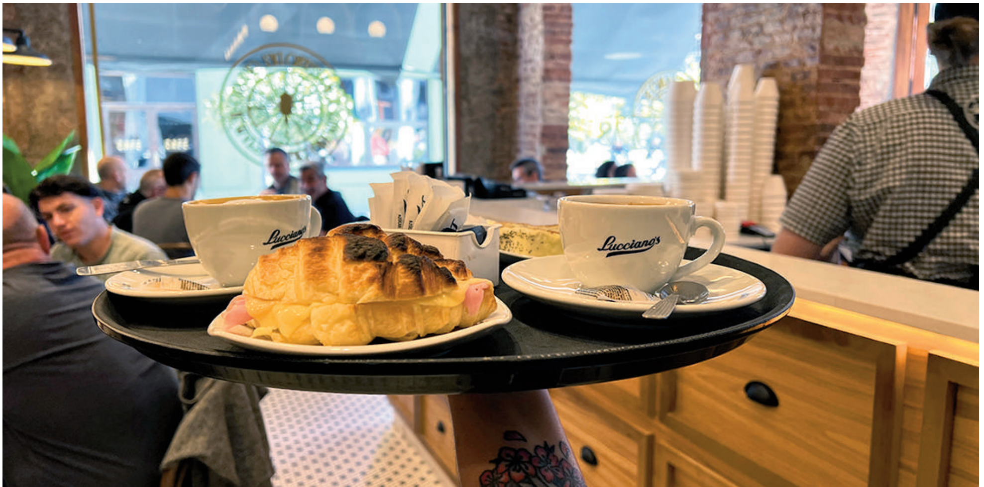
La franquicia potenció sus desayunos y meriendas y dotó de una mayor capacidad sus servicios de mesa. EL NORTE