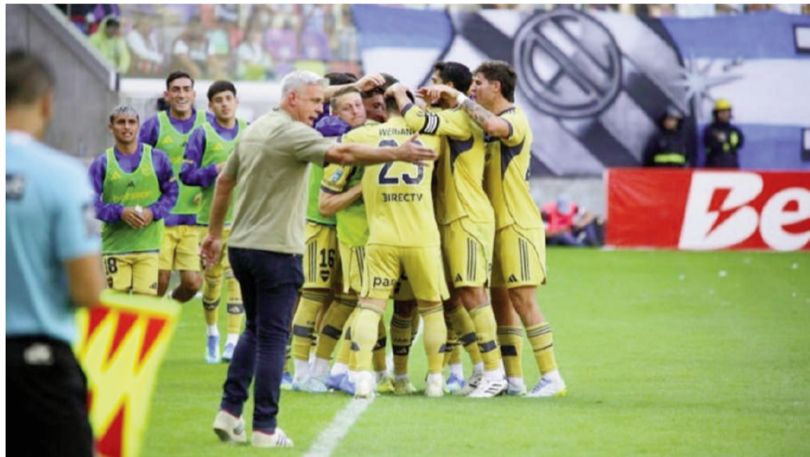
El Xeneize estiró su racha en el certamen local con otra victoria.

El equipo de la Ribera derrotó al Ferroviario por 2 a 1 en Santiago del Estero y quedó como escolta de Estudiantes. Velasco y Giménez anotaron para el auriazul, mientras que Santos descontó para el local.