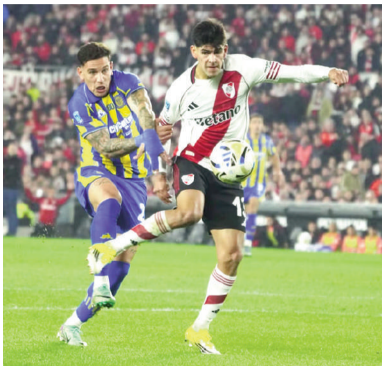
El "Millonario" ganó un duro partido y ahora irá por el título.

Con este resultado, el equipo de Coudet quedó a un paso del título y jugará la final del Apertura ante el ganador del cruce entre Argentinos Juniors y Belgrano.