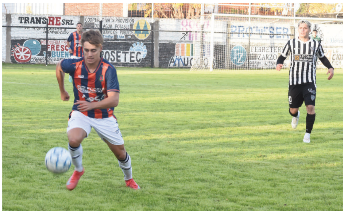
El "Náutico" tendrá un duro escollo en Rivadavia y Necochea. EL NORTE

Regata, uno de los líderes, se medirá ante Social en cancha de Paraná a partir de la 15.30. Mientras que La Emilia, el otro puntero, visitará a San Martín de Pérez Millán.