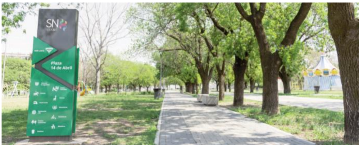
La Plaza 14 de Abril, en la zona norte de la ciudad, recuerda la efeméride de hoy.