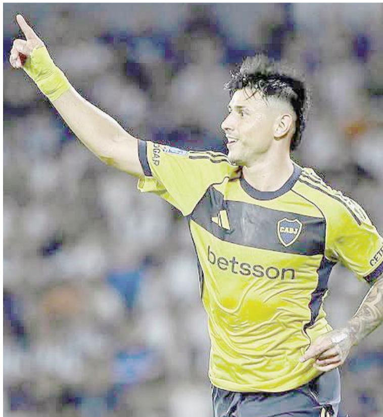
El equipo de la Ribera intentará extender su racha invicta.

El León tiene la clasificación a playoffs del Apertura encaminada, y ahora buscará darle valor al empate conseguido en Colombia la semana pasada 1-1,