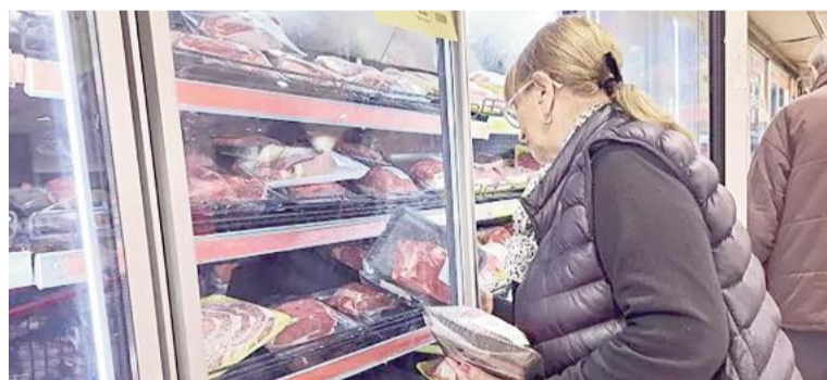
Solo en el primer trimestre la suba de los precios de la canasta de los trabajadores llegó al 9%.