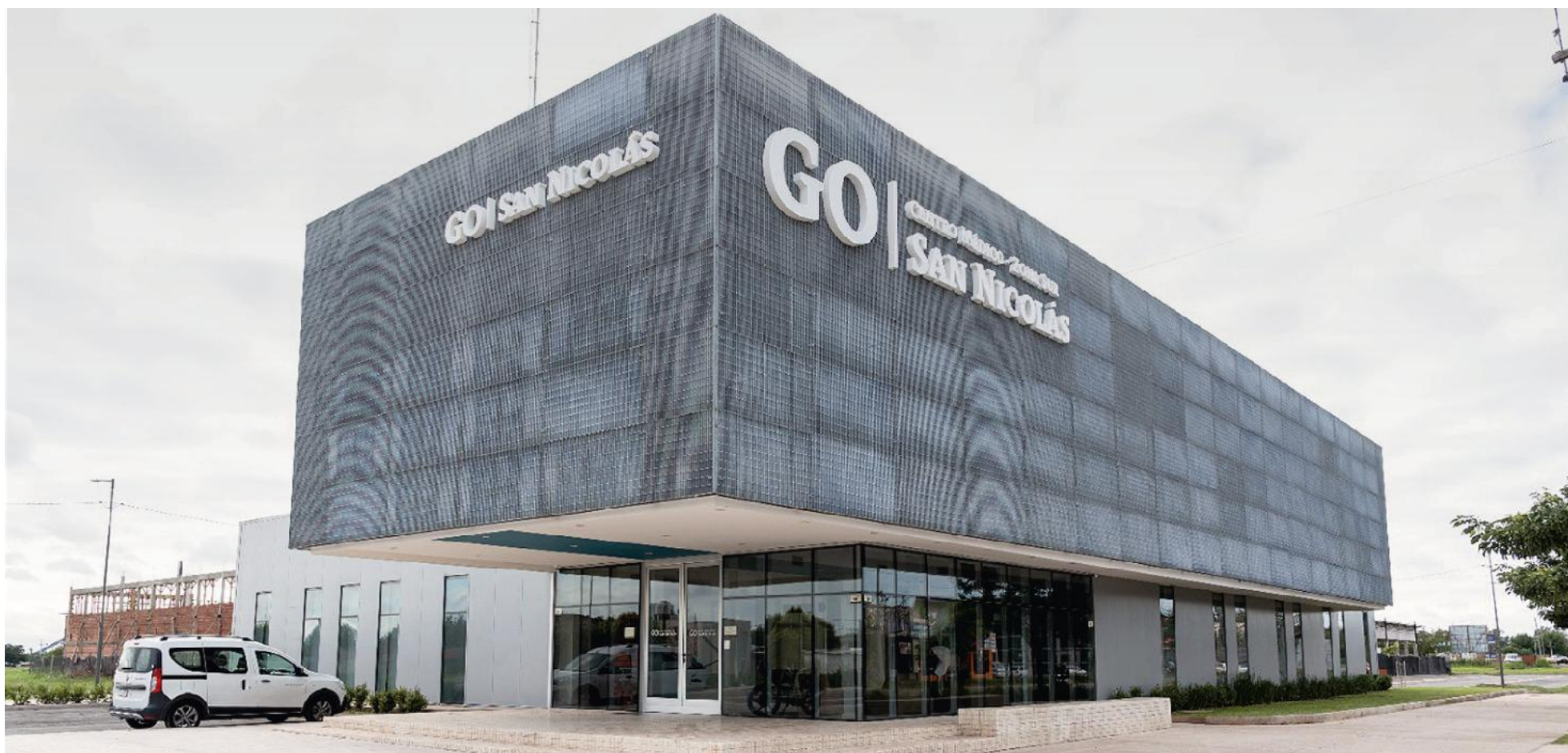
El nuevo Sanatorio GO funcionará en un edificio de dos plantas y 1140 metros cubiertos construido y concesionado por la Municipalidad de San Nicolás.