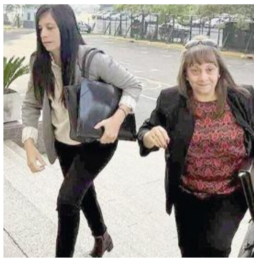
Declararon dos de las prestamistas de Adorni.

Asimismo, confirmaron que el acuerdo tiene "cuotas mensuales vigentes" y "un vencimiento final pactado para noviembre de este año". Aparentemente, el crédito se otorgó "con