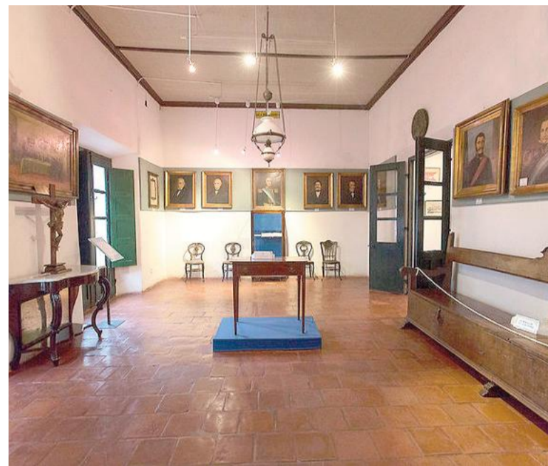
Museo Casa del Acuerdo.

La confluencia de hechos históricos invita a reflexionar sobre cómo un pequeño pueblo del litoral se transformó en un actor clave en la formación de la Argentina que conocemos actualmente.