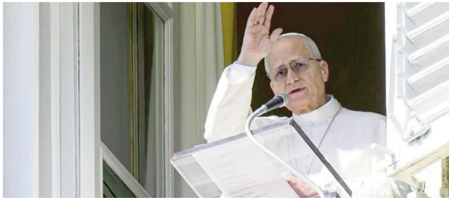
León XIV instó a las potencias a no ignorar el drama humanitario antes de su gira africana.

El domingo por la noche, el presidente de Estados Unidos arremetió contra el pontífice en la red Truth Social, calificándolo de «débil en materia de seguridad y pésimo en política exterior».