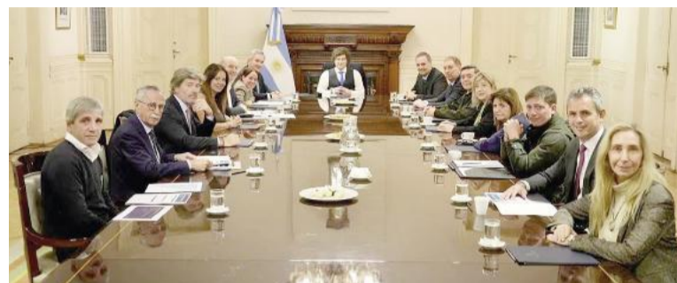
El presidente Javier Milei, durante una reunión con su gabinete en la Casa Rosada.

En lo que va del año, varias partidas mostraron caídas significativas. Los salarios del sector público, uno de los componentes más relevantes del gasto, registraron una baja del 6,1% en el primer trimestre, al pasar