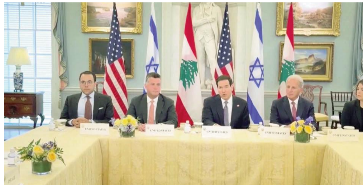
Israel y el Líbano mantuvieron las primeras conversaciones directas en más de tres décadas.

La tregua inició tras las conversaciones telefónicas de Donald Trump con el presidente del Líbano, Joseph Aoun, y el primer ministro de Israel, Benjamin Netanyahu. El grupo chií en desacuerdo con negociar con EE.UU.