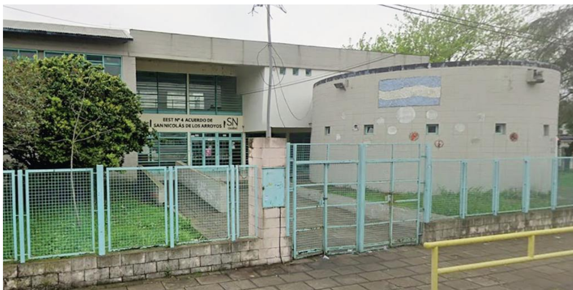
Escuela Técnica N° 4 de San Nicolás.

El episodio no finalizó dentro del aula. Al dirigirse nuevamente a preceptoría, el menor se cruzó en una escalera con familiares del presunto