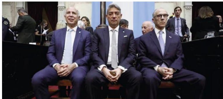
Los miembros de la Corte Suprema en el Congreso