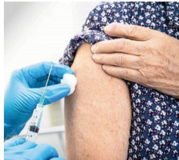
Con importantes faltantes de dosis para adultos, efectores de salud esperan la llegada de una nueva tanda de vacunas antigripales. ILUSTRACIÓN

Asimismo, desde el vacunatorio del Sanatorio GO (hospital de zona oeste) afirmaron que, al momento, tienen antigripales pediátricas, pero no cuentan con dosis para adultos en lo que hace a la campaña pública gratuita. Similar situación se observa en el recientemente habilitado Hospital Zona Sur, donde ayer había vacunas pediátricas y se estaban aplicando las últimas dosis de adultos. “Estamos a la espera del envío de nuevas dosis desde