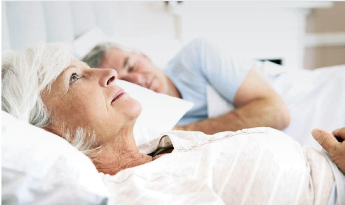
Investigadores hallaron que el insomnio grave puede anticipar la aparición de alzhéimer años antes de los síntomas de memoria.

Esta alteración desencadena un desequilibrio entre señales estimulantes y calmantes en el cerebro, impidiendo la entrada en las fases profundas del sueño. En palabras de Macauley: "El cerebro