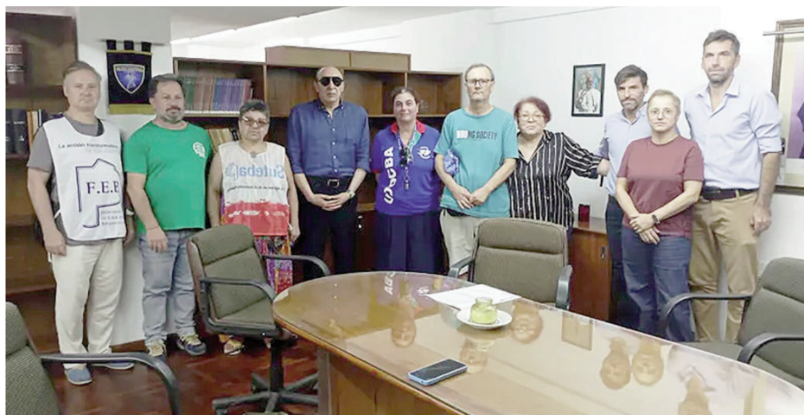
Días pasados, en el marco de un paro y movilización docente, referentes gremiales mantuvieron un encuentro con autoridades de la Fiscalía.

El nuevo protocolo no es una medida aislada, sino que se asienta sobre un robusto andamiaje legal. Se fundamenta en la Convención so-