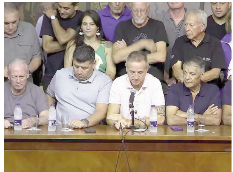
La CGT anunció una marcha en contra del Gobierno el 30 de abril.

El sindicalista también cuestionó la falta de diálogo con el Ejecutivo al señalar que "no se están teniendo interlocutores con el Gobierno" y que "no los hubo para la reforma laboral y menos para estos debates". Sobre el plano político, consideró