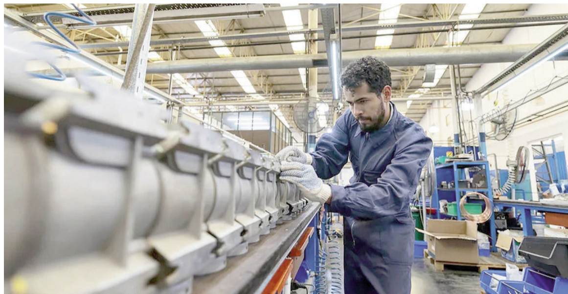
La actividad económica en retroceso, según el Indec

La construcción también perdió terreno. El indicador sintético de la actividad de la construcción (ISAC) cayó en febrero luego de haber re-