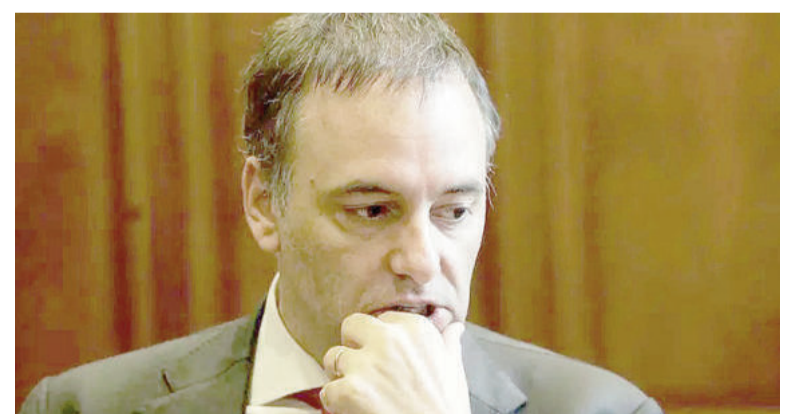
Nuevo dolor de cabeza para Adorni.

La causa se originó con el viaje a Punta del Este en febrero para el fin de semana del feriado de carnaval, en vuelo privado. Al respecto, la factura, según testimonios que están en el expediente, tiene fecha 4 de