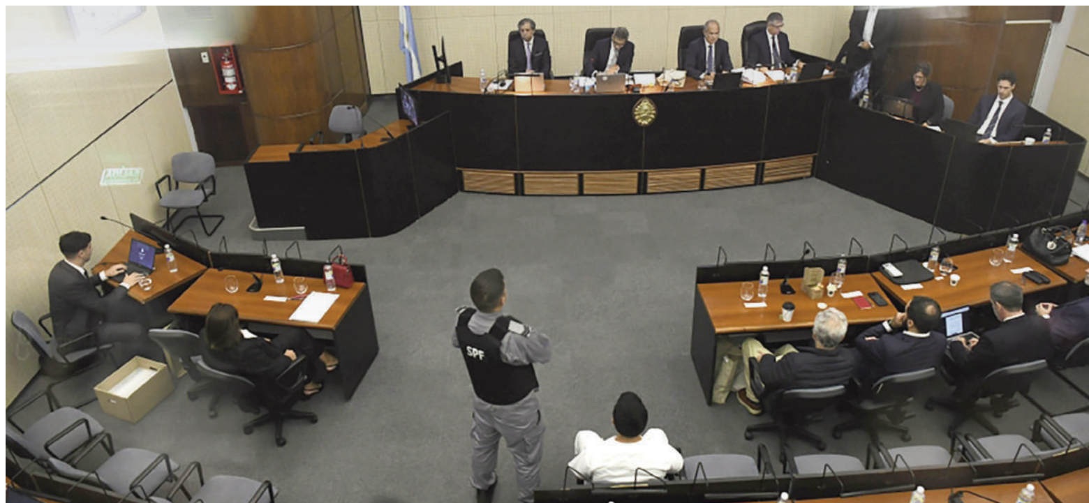
La Sala Auditorium de los Tribunales Federales de Retiro donde se desarrolla el juicio por la causa Cuadernos.