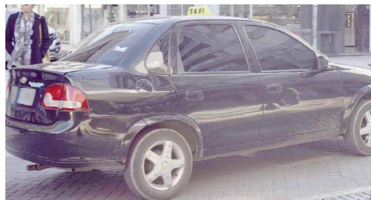
Asaltaron a un taxista y a un remisero mientras trabajaban el jueves en San Nicolás.

La víctima describió al ladrón como un hombre de complexión delgada, de aproximadamente 1,75 m de altura, de unos 40 años, con calvicie en la parte superior de la cabeza y cabello corto en los laterales.