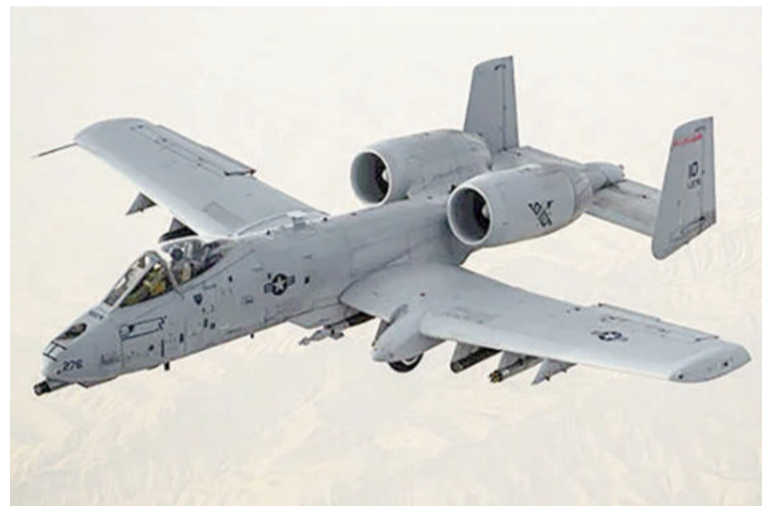
Un A-10 Warthog, como el derribado.

Por su parte, Israel pospuso algunas de sus ofensivas planificadas en Irán el viernes para no interferir con los esfuerzos de búsqueda y rescate de Estados Unidos, confirmó a