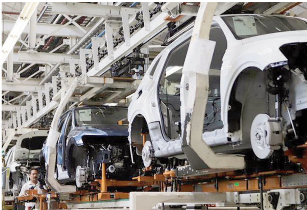
La industria automotriz sufrió un fuerte retroceso mensual en febrero.

En un informe, la consultora resaltó que «la caída (anual) más pronunciada se observó en la inversión en maquinaria de origen importado, en un contexto de mínimos históricos para la utilización de la capacidad