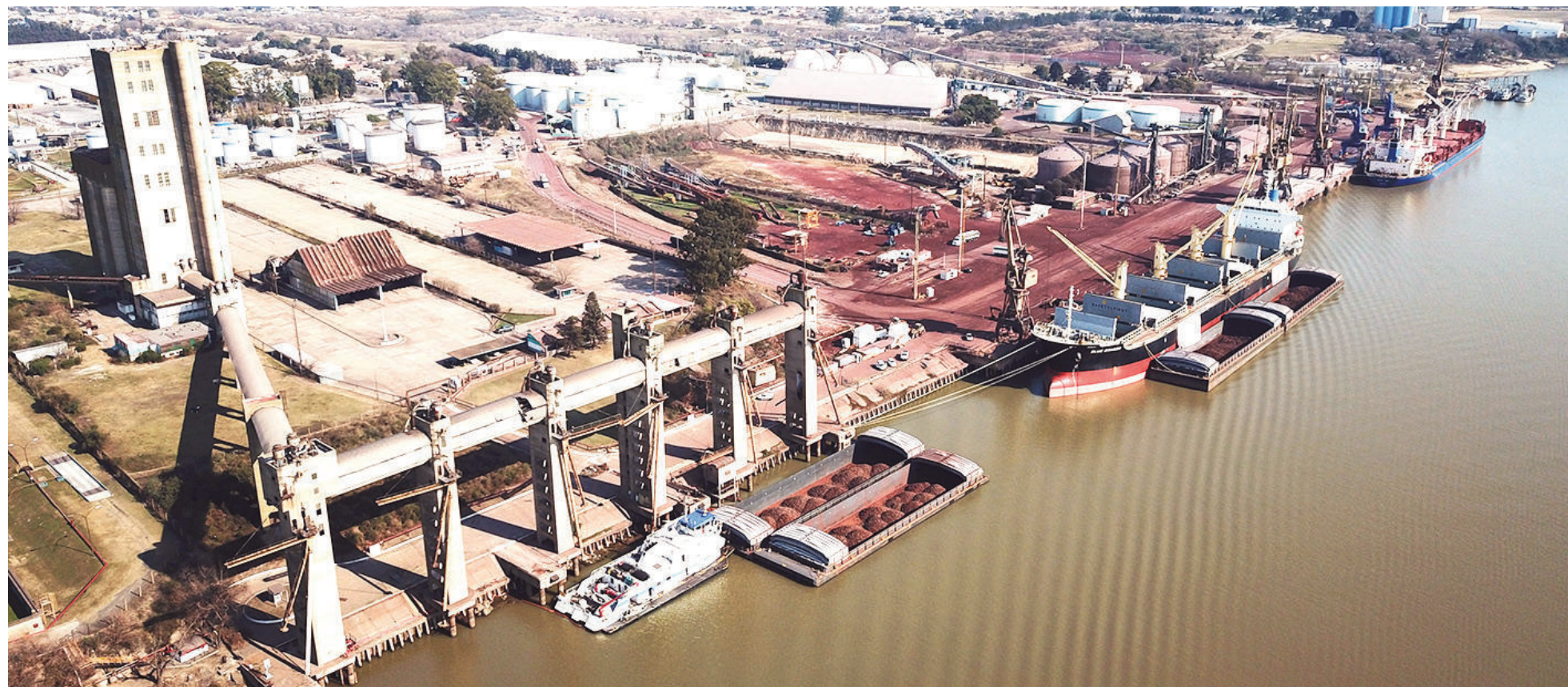
Las principales mercaderías movilizadas están vinculadas al entramado industrial, con un claro predominio de los fertilizantes por sobre el resto.

Durante el año se movilizaron 2,9 millones de toneladas y se operaron más de 500 buques, con subas interanuales significativas. El puerto mantiene un perfil orientado a las importaciones y al abastecimiento industrial. Los fertilizantes lideran el volumen de mercaderías.