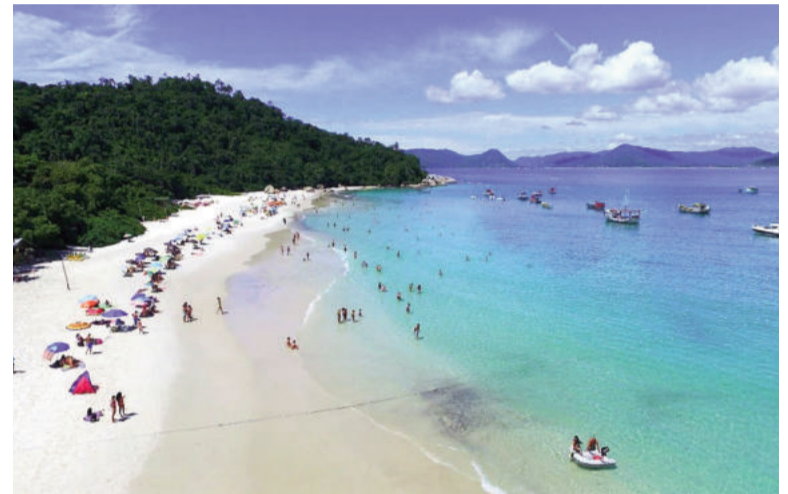
Nicoleños habían contratado viajes a Florianópolis, pero antes de partir los organizadores indicaron que el destino sería Canasvieiras. ILUSTRACIÓN

a la esposa del acusado, imputada por estafa reiterada. La captura del hombre en Misiones representó un avance clave para esclarecer la maniobra, que afectó a unas 50 personas y un monto total estimado en 30 millones de pesos. La causa sigue abierta mientras las víctimas esperan recuperar su dinero y conocer todas las responsabilidades de los involucrados.