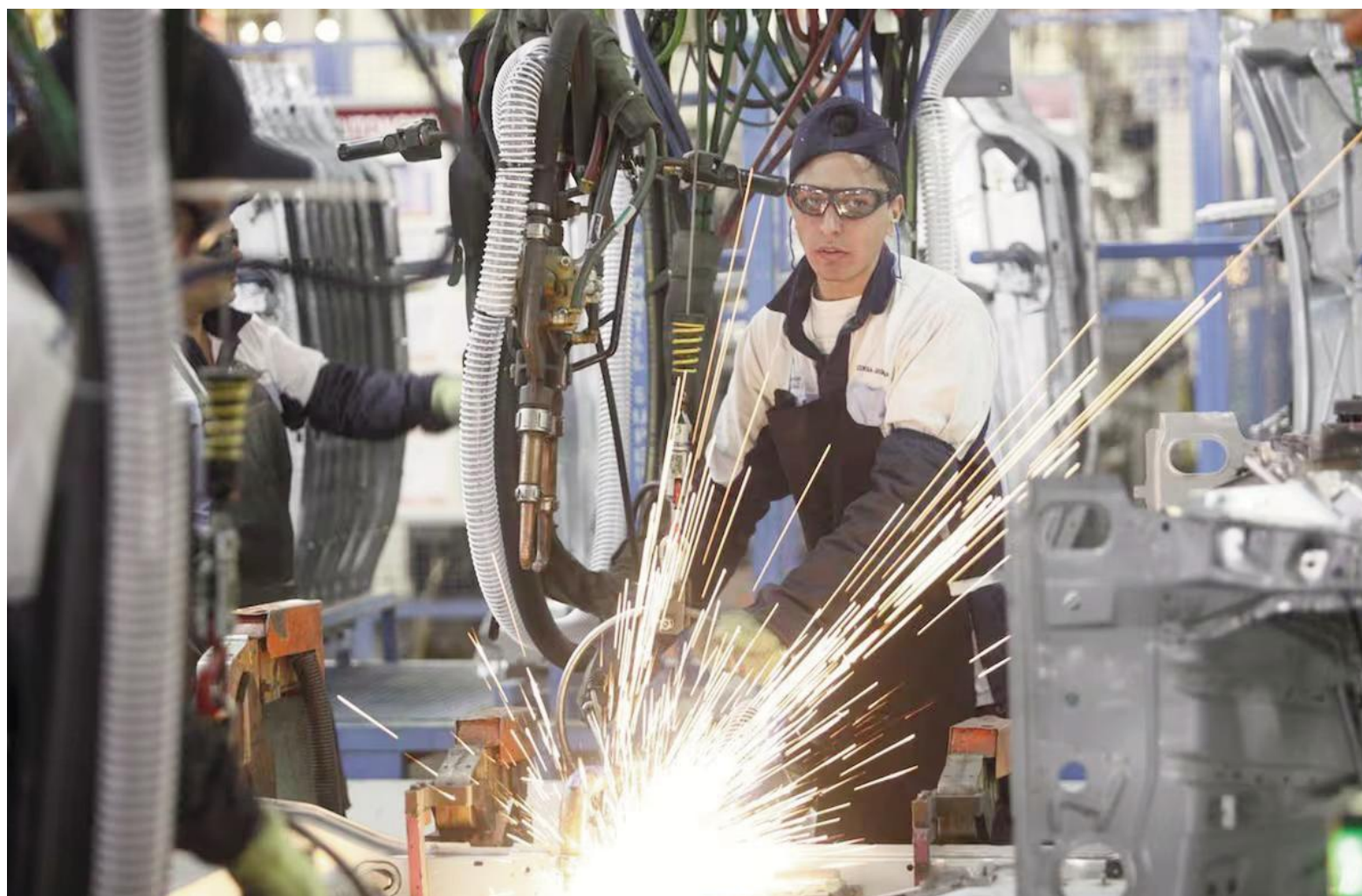
En las empresas de la Rama 17, en abril se abonó el último tramo del aumento del 14% acordado en diciembre de 2025.

Según explicó, los datos del Centro de Estudios Económicos de la entidad reflejan una baja del 4,6% interanual en marzo, que se suma a caídas pre-