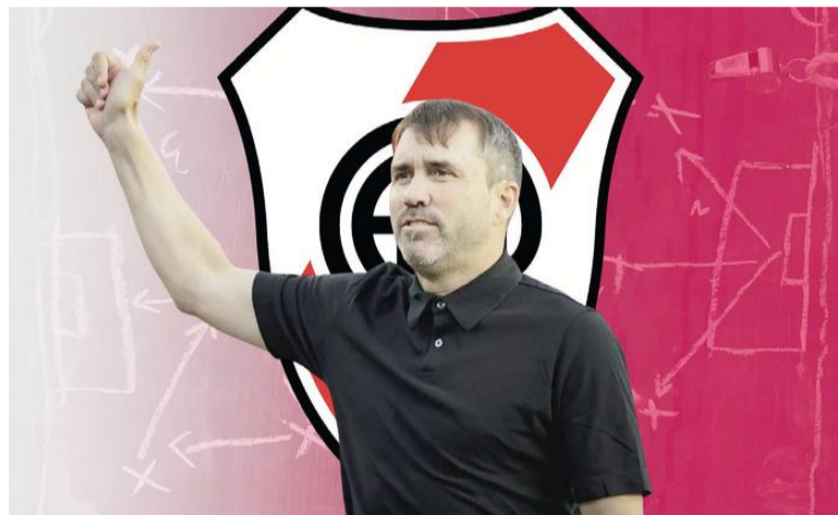
El equipo "Millonario" intentará volver a sumar de a tres.

Aldosivi, por su parte, es uno de los peores equipos en lo que va del 2026 en la Primera División