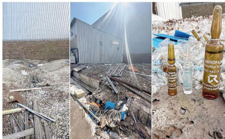
Imágenes del allanamiento en el laboratorio de Ramallo.