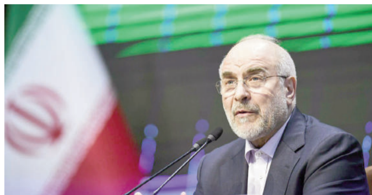
Mohammad Bagher Ghalibaf, jefe del Parlamento iraní.

historial de conversaciones previas no es alentador. “Lamentablemente, nuestra experiencia de negociar con los estadounidenses siempre terminó en fracaso y violaciones