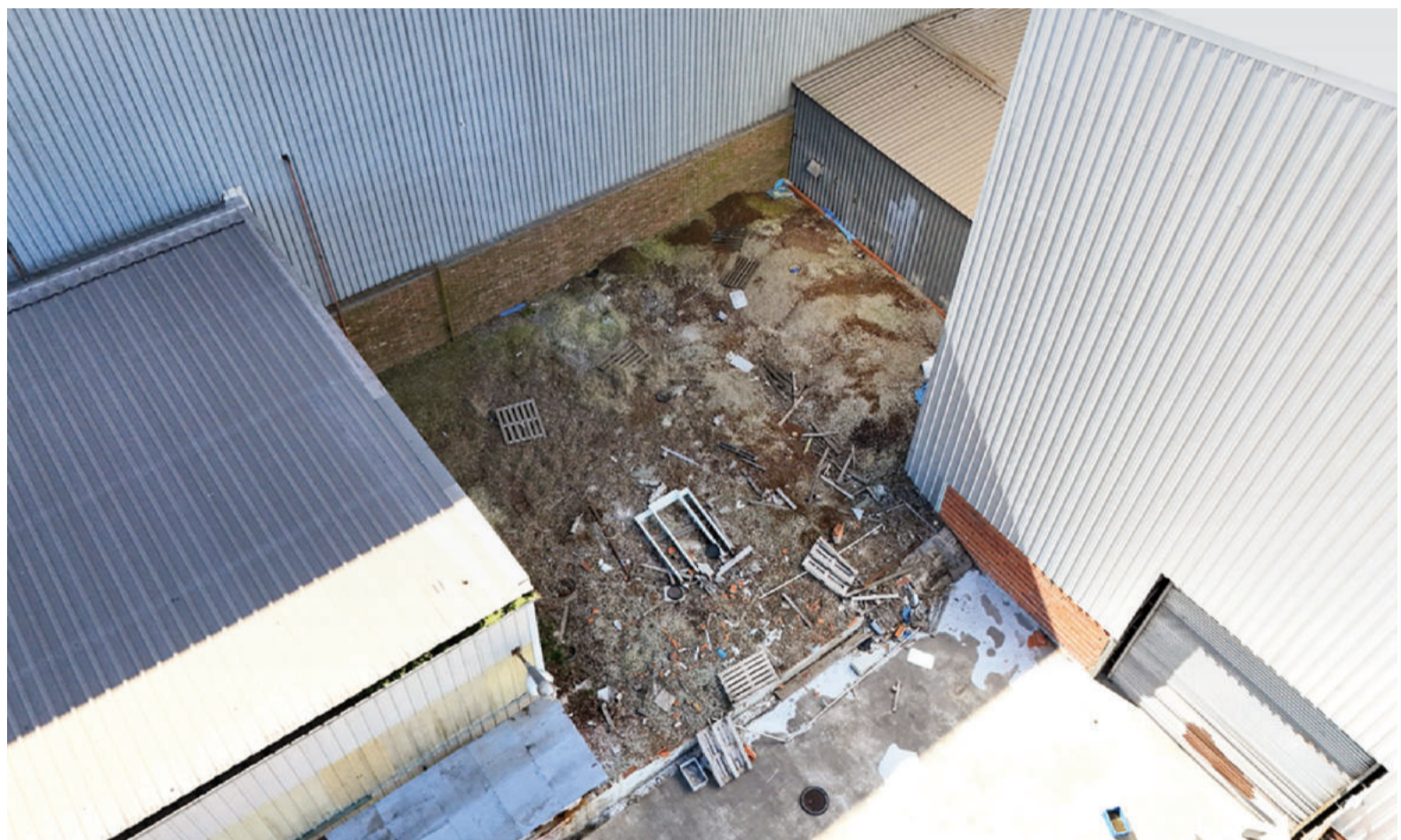
En 2025, la Anmat ya había inhibido las actividades de Laboratorios Ramallo y prohibido la comercialización de todos sus productos.

La Disposición 3158/2025 de la Anmat, publicada en el Boletín Oficial, marcó el primer cese total de actividades para HLB Pharma Group S.A. y Laboratorios Ramallo S.A., tras detectarse una serie de irregularidades graves vinculadas a la calidad, seguridad y trazabilidad de medicamentos producidos por ambas firmas. Según la comunicación oficial citada por la Anmat, uno de los elementos más contundentes fue la contaminación microbiana detectada en el producto fentanilo HLB.