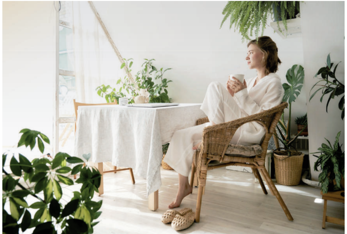
La elección de materiales naturales aporta serenidad y conexión con la naturaleza dentro del hogar.

Para Cajal, el objetivo no es vaciar el hogar, sino dotarlo de autenticidad y sentido a través de la belleza de la imperfección, inspi-