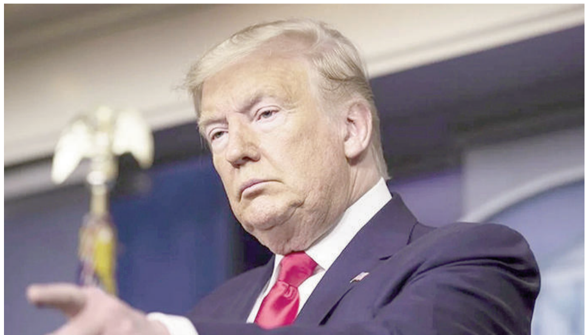
Presidente de EE.UU. Donald Trump.

Libano también constituye un punto de fricción importante. Israel continuó sus ataques en el país con-