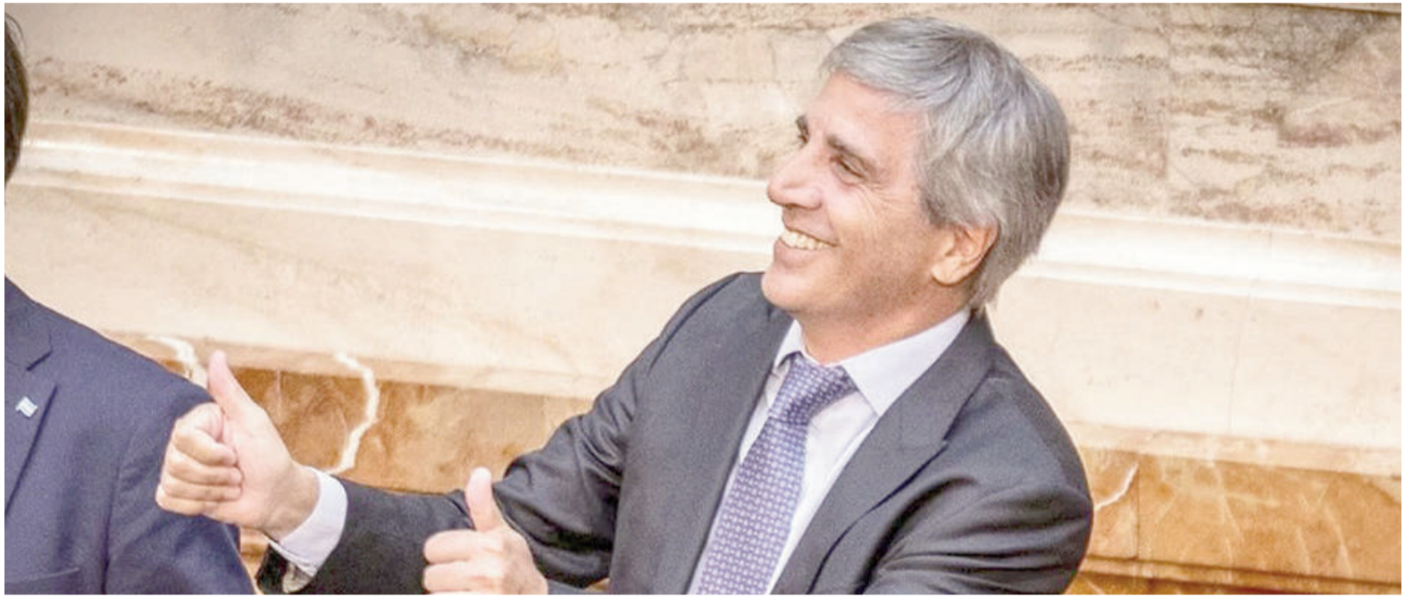
Ministro de Economía Luis Caputo.

Tal como indica el Ministerio de Economía, a través de la Secretaría de Agricultura, Ganadería y Pesca, los datos fueron procesados por la Subsecretaría de Mercados Agroali-