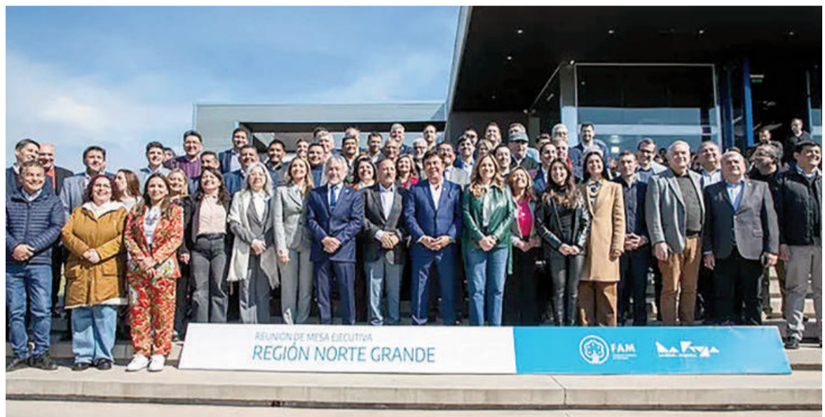
Los intendentes de la FAM irán el martes al Ministerio de Economía.

comenzó a circular otro llamado para esa misma jornada, impulsado desde el entorno de Katopodis.