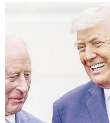
El rey Carlos III de Inglaterra junto a Donald Trump.

En medio de la tirantez con el Gobierno británico, el presidente de EE.UU. afirmó que su país mantiene una "relación especial" con el Reino Unido.