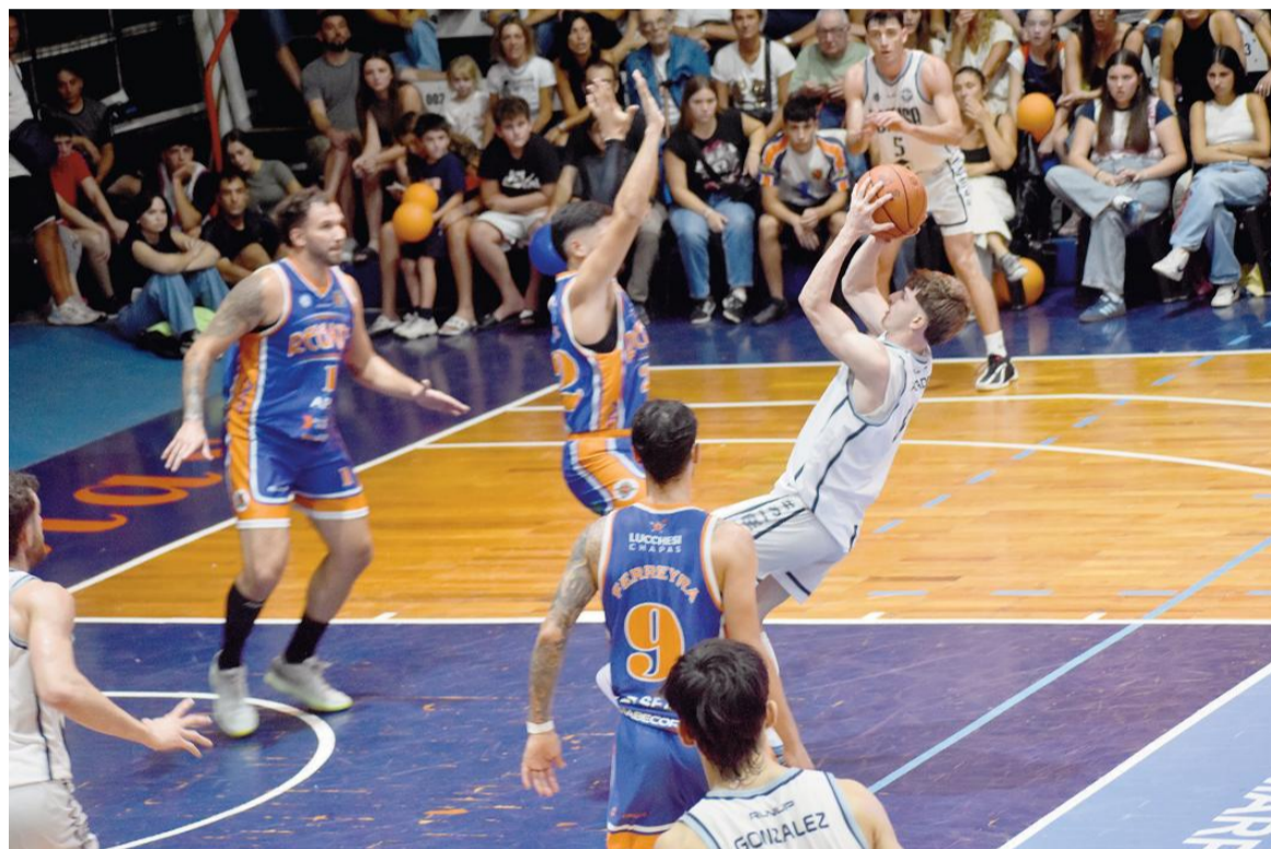
En la rueda inicial, Regatas se impuso como local por 72 a 55 ante Somisa.

Desde las 21.00 se enfrentarán en el "Socios Fundadores" y con hinchas de los dos clubes. Ambos ocupan los principales puestos de la tabla en la Subzona B de la Conferencia Sudeste, pero deben levantar su nivel pensando en lo que viene.