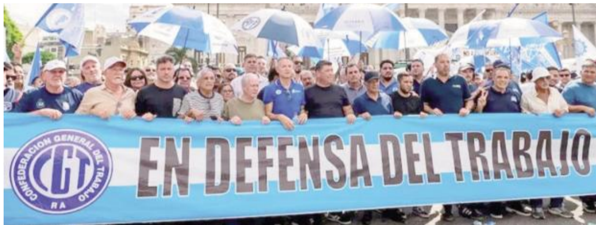
El Gobierno se anotó una victoria y logró que la demanda de la CGT cambie de fuero.