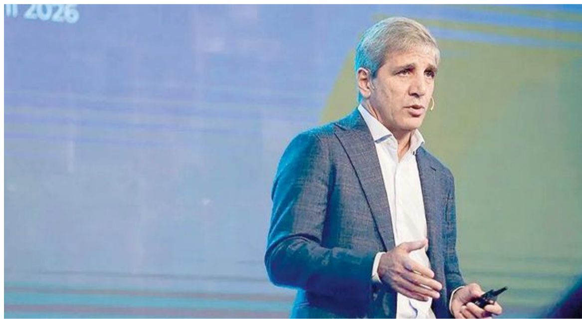
El ministro de Economía, Luis Caputo, en la apertura de la ExpoEFI.

También dijo que va a ayudar a reactivar el inicio de obras en 9.000 kilómetros de rutas con la licitación de concesiones a privado. Y que luego se licitarán otros 12.000 kilómetros