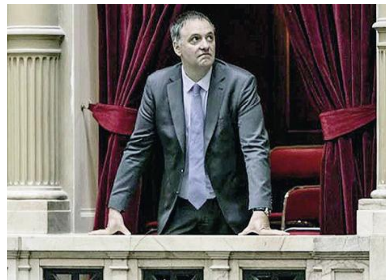
El jefe de Gabinete enfrentará a los legisladores en su peor momento político.

Más allá de la disputa por el clima de la sesión, el contenido del debate anticipa un escenario complejo para el jefe de Gabinete. Aunque el oficialismo buscará centrar la exposición en la gestión y los indicadores económicos, la oposición prepara preguntas que apuntan directamente a los puntos más sen-