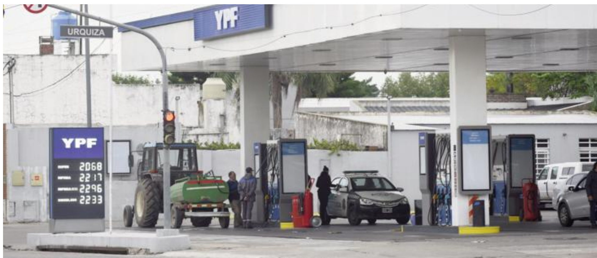
Las estaciones de servicio YPF de San Nicolás modificaron sus tableros de precios a primera hora de este martes.

A primera hora de este martes, la petrolera estatal introdujo cambios en los precios de sus combustibles, algo que no ocurría desde hacía un mes. La quietud anterior obedecía a una política empresarial en medio de la disparada del valor internacional del petróleo provocada por la guerra entre Estados Unidos e Israel con Irán. En San Nicolás, los recientes ajustes fueron mínimos, pero la estabilización se asienta sobre precios que están entre 17% y 24% por encima de los niveles previos al conflicto en Medio Oriente.