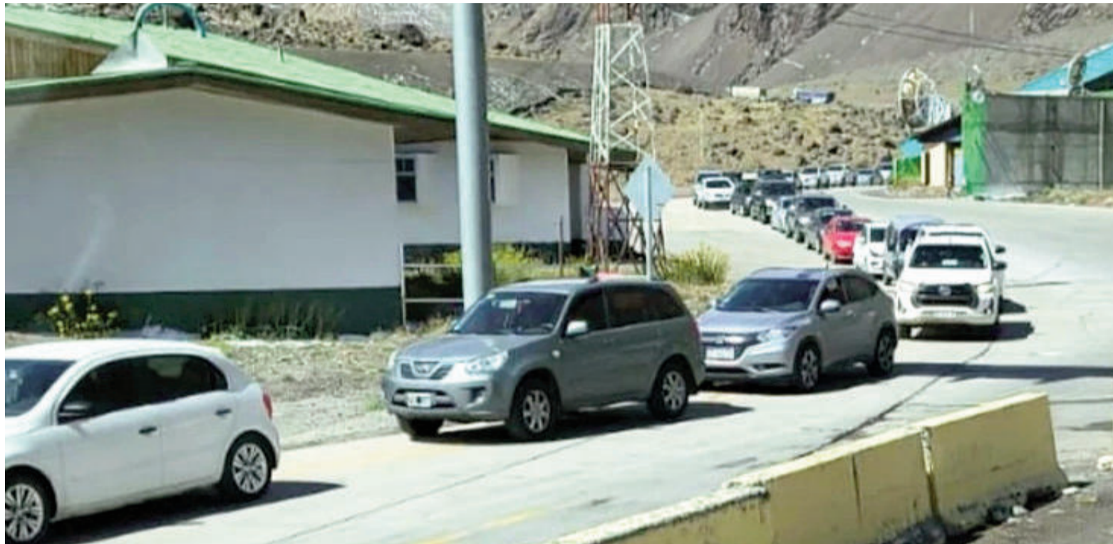
Paso Cristo Redentor.

Será a partir del 4 de abril. Este cambio afectará a los viajeros entre ambos países.