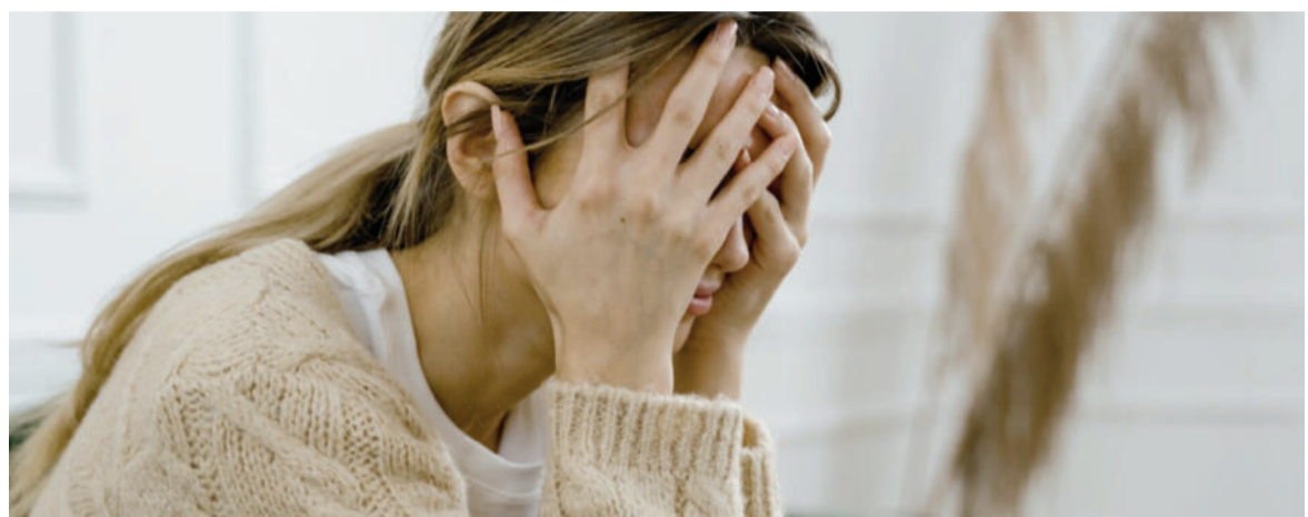
Se apunta a fortalecer la red pública de salud con dispositivos de atención inmediata en hospitales.

En los fundamentos de la iniciativa también se citan datos oficiales sobre la magnitud del problema. Según se señala, una parte significativa de la po-