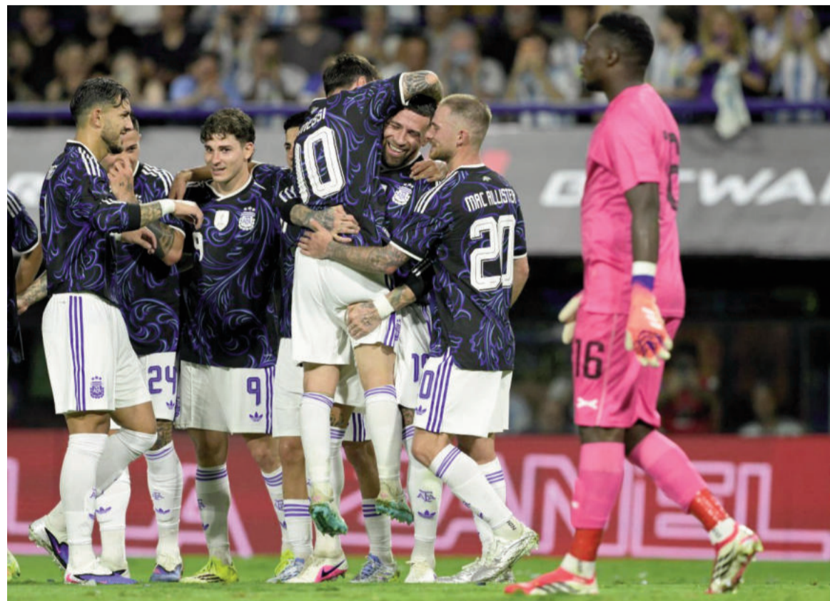
La Selección Argentina mostró su clara supremacía sobre un débil rival.

El conjunto de Scaloni demolió al conjunto africano por 5 a 0 en la Bombonera con goles de Julián Álvarez, Messi, Otamendi (de penal), Chanda en contra y Barco.