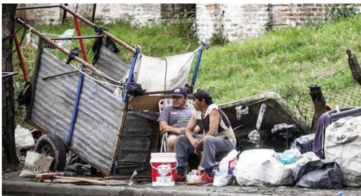
En el segundo año de mandato de Javier Milei la pobreza registró una nueva baja.

«Algo novedoso es que esta baja se da, por primera vez desde la asunción de Milei, en un contexto donde en todo el semestre promedio mensual la inflación fue al 2,3% y las canasta básica total subió al 2,5%, es decir, que la canasta básica total estuvo por encima de la inflación. Sobre todo al final del año pasado, cuando la carne subió mucho. Que siga bajando la pobreza en un contexto donde la CB ya no corre por debajo de la inflación, es un dato positivo»,