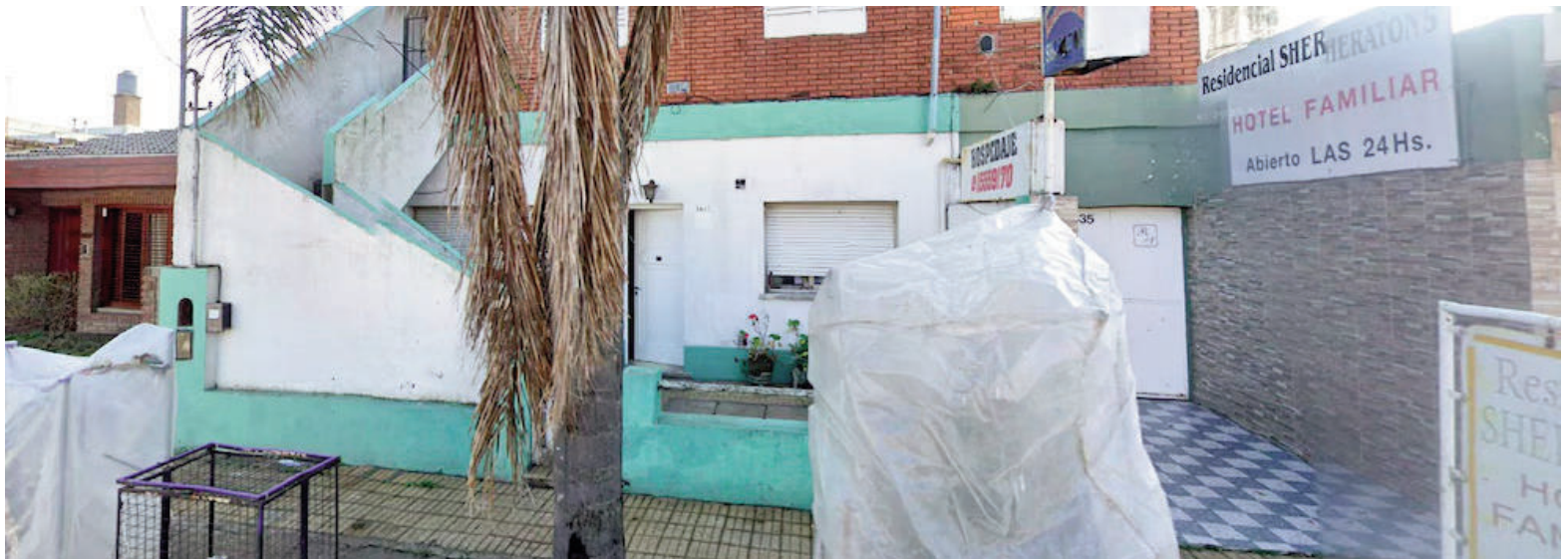
La fachada del hospedaje en Pergamino «Residencial Sheraton's Hotel Familiar».

La joven declaró que había estado consumiendo bebidas alcohólicas junto a amigos en la noche del sábado y que el último recuerdo que conserva es haber estado con un hombre identificado únicamente por el apodo de "Cogote". Al despertar, se encontró sola en el hotel, sin información sobre el traslado ni las circunstancias que la llevaron hasta allí.