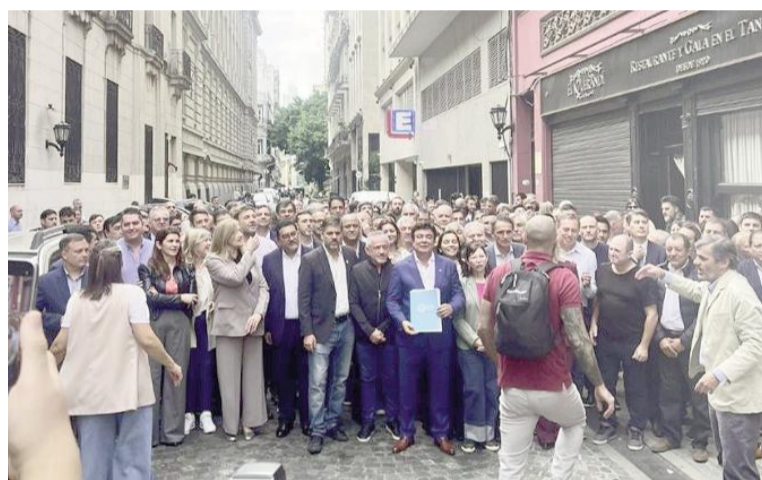
Intendentes le reclaman recursos al Gobierno nacional.

“Vinimos a exigirle al ministro de Economía que retrotraiga el precio de la nafta al 1° de marzo, haga las obras que están obligados por ley y frene el recorte de fondos nacionales”, enfatizó el ministro de Obras Públicas de