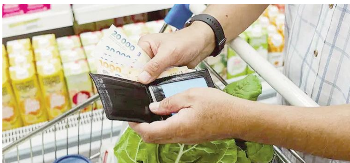
La inflación de marzo saltó al 3,4% y sacude el bolsillo.