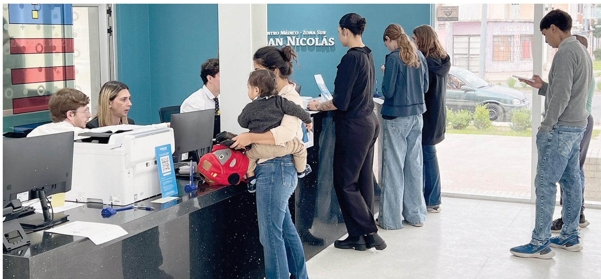
El Sanatorio GO de zona sur beneficiará a más de 40.000 vecinos de nuestra ciudad, con atención médica de calidad.

Con más de un centenar de turnos previamente acordados y otras tantas consultas de demanda espontánea, este martes comenzaron a brindarse prestaciones médicas en el nuevo Sanatorio GO de la zona sur de la ciudad. “Es un paso importantísimo que estamos dando para avanzar en nuestro plan estratégico de salud”, destacó el intendente Santiago Passaglia. Las áreas ya operativas son las de policlínicos, vacunatorio, laboratorio y diagnóstico por imágenes.