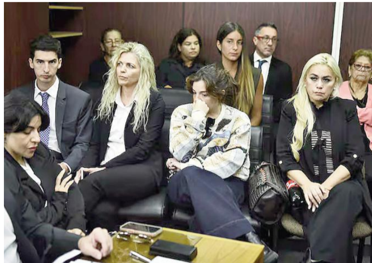
Parte de la familia Maradona en el segundo juicio por la muerte de Diego.