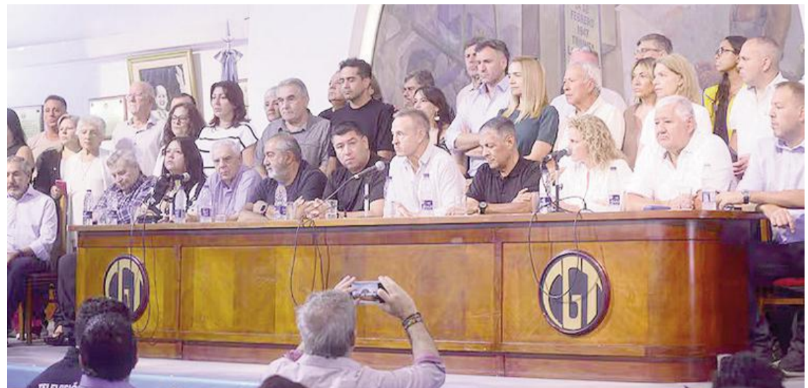
La CGT continúa con sus críticas hacia la reforma laboral.

de un “nuevo contrato social y seguridad jurídica, que hoy con esta ley de reforma laboral no tenemos”.