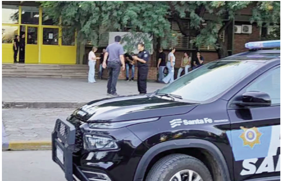
La causa por el tiroteo en una escuela de Santa Fe sumó un nuevo detenido.