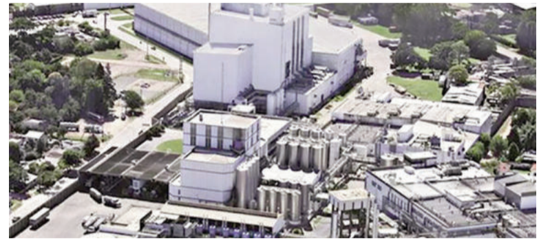
La presión tributaria efectiva del impuesto sobre los Ingresos Brutos en PBA asciende al 4,7%.

El documento también pone el foco en las diferencias de presión tributaria en cadenas específicas. Por ejemplo, en el sector forestal, papel y muebles, la presión en Buenos Aires alcanza el 5,9%, frente al 3,4% en Santa Fe y el 2,7% en Cór-