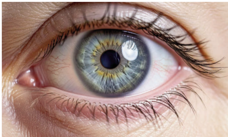
Un estudio permitió saber cómo los ojos ven con nitidez.

Cómo se transmite la información visual en la retina Para entender el hallazgo, es