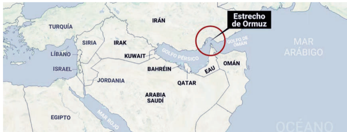
El Estrecho de Ormuz en el centro del conflicto.

Si Pakistán, o en su defecto China, Qatar, o la Unión Europea fracasan en sus planes de inducir una tregua