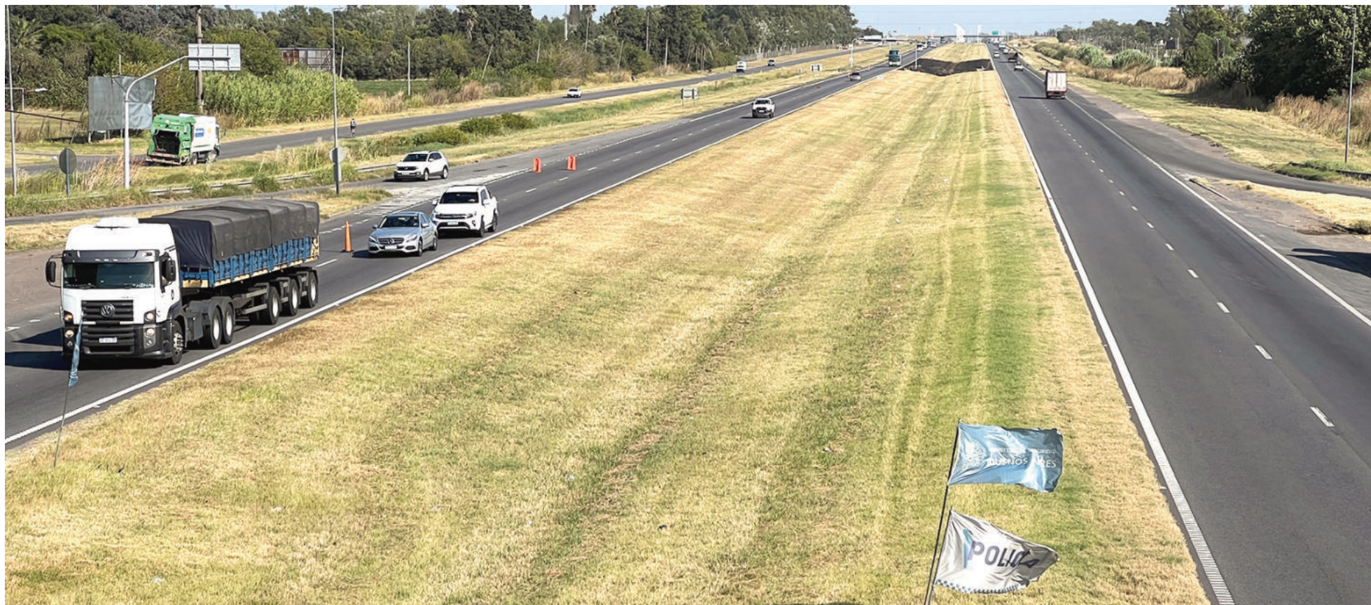
El denominado Tramo Portuario Sur tiene una extensión de más de 636 kilómetros y están incluidas las rutas 9 y 188. EL NORTE

El 7 de mayo próximo está previsto el acto de apertura de sobres en los que se conocerán las propuestas técnicas y cotizaciones en el marco de la licitación pública nacional hacia una nueva concesión de los tramos de las rutas 9 y 188 que atraviesan el Partido de San Nicolás. El pliego contempla la posibilidad de más peajes, aunque no incluye un proyecto por terceros carriles en cada mano de la autopista.