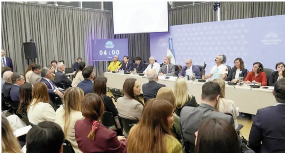
Diputados debaten en comisión la reforma de la Ley de Glaciares.