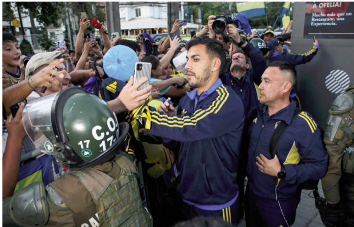
El equipo de la ribera tratará de conseguir un resultado positivo en su estreno.

Luego de dos años de ausencia, el xeneize le apunta a su torneo preferido al visitar hoy desde las 21.30 a Universidad Católica. También debutará Independiente Rivadavia de Mendoza que recibirá a Bolívar de La Paz.