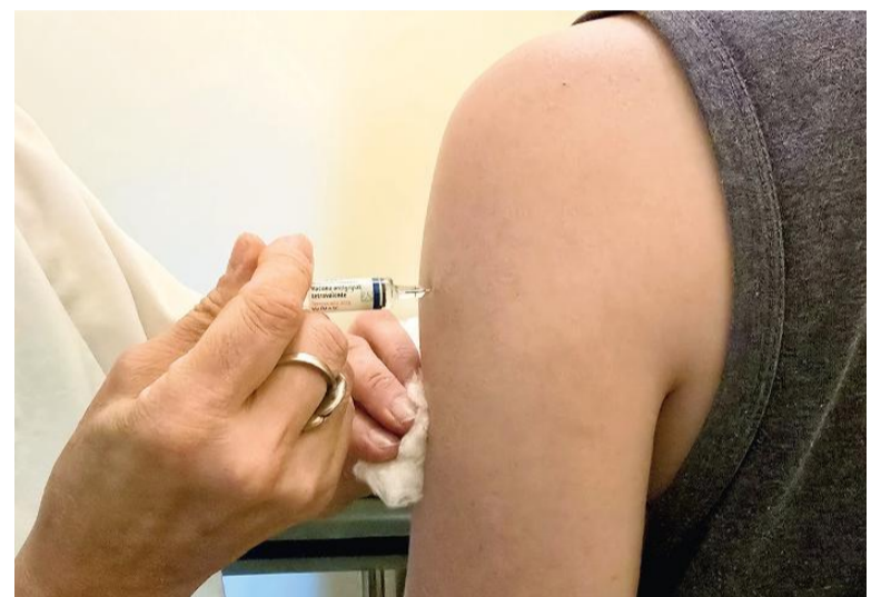
La vacunación antigripal, incluida en el Calendario Nacional, es gratuita y obligatoria para la población objetivo.

Cabe recordar que la vacunación antigripal para grupos específicos, que forma parte del Calendario Nacional, es gratuita. En San Nicolás, los nicoleños pueden acceder a través de los vacunatorios de los hospitales de zona norte (Av. Illia y Zараcondegui), oeste