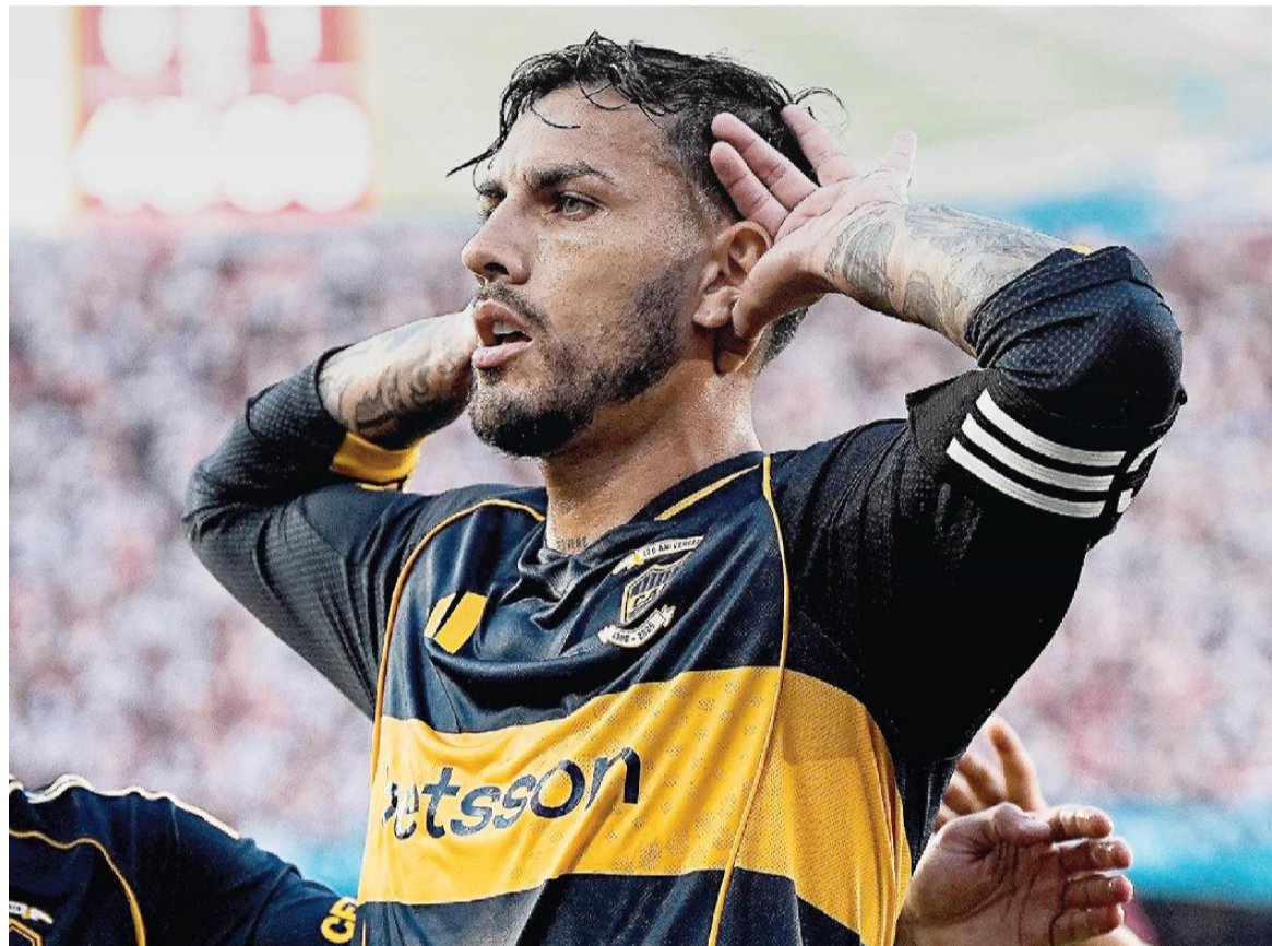
El Xeneize tendrá un compromiso de riesgo en Brasil.

Entonado por su serie invicta de catorce partidos con seis triunfos en los últimos siete juegos, Boca (6 puntos) emprendió viaje a Brasil, donde lo espera de capa caída un Cruzeiro con más historia que presente. En el 12º puesto del campeonato brasileño con 16 puntos y con solo tres en la Copa, producto de un triunfo de visitante ante Barcelona de Ecuador y una derrota inesperada 2-1 de local frente a la Universidad Católica de Chile, Cruzeiro tratará de que Boca no se le escape demasiado. De ganar, el equipo xeneize tendrá puntaje perfecto de nueve puntos sobre nueve posibles y dará un paso muy grande para asegurarse la clasificación