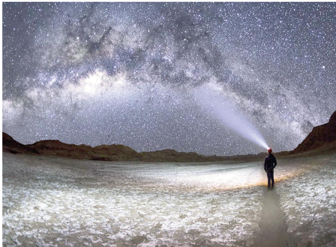
El desierto de Atacama es uno de los mejores lugares del mundo para la observación astronómica, pero enfrenta amenazas por contaminación lumínica.

El desierto de Atacama reúne condiciones climáticas y geográficas excepcionales: extrema sequedad, gran altitud y aislamiento de fuentes de luz artificial. Según explicó Chiara Mazzucchelli, presidenta de la Sociedad Chilena de Astronomía, a Associated Press, este lugar cuenta con más de 300 noches despejadas al