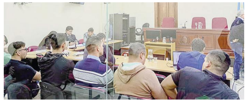
Los gendarmes imputados, de espaldas, y los representantes del MPF, ubicados al fondo de la imagen.