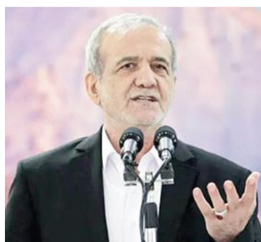
Presidente iraní, Masoud Pezeshkian.

Añadió que en Irán persiste una profunda desconfianza hacia la conducta estadounidense y que las “señales contradictorias y poco cons-