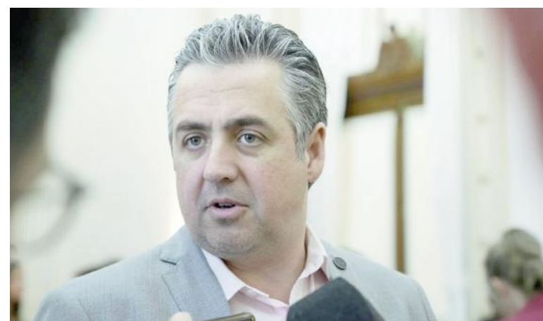
El ministro de Seguridad y Justicia, Pablo Cococcioni.

El nuevo mensaje se suma a una serie de situaciones que mantienen en vilo a San Nicolás, en un contexto donde el temor, la incertidumbre y la demanda de respuestas claras continúan presentes entre padres, alumnos y docentes.