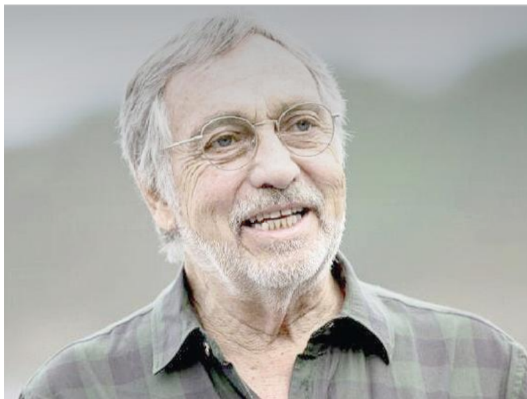
Luis Brandoni falleció a los 86 años.

Fue actor, dirigente sindical y militante político. Nacido como Adalberto Luis Brandoni el 18 de abril de 1940 en Dock Sud (Buenos Aires), consolidó una trayectoria de más de