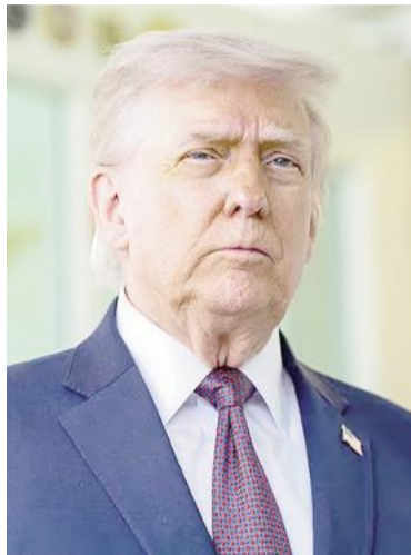
Presidente de EE.UU Donald Trump.

el alto el fuego con Irán, “entonces empezarán a explotar muchas bombas”, dijo esta mañana en una conversación telefónica con PBS News.