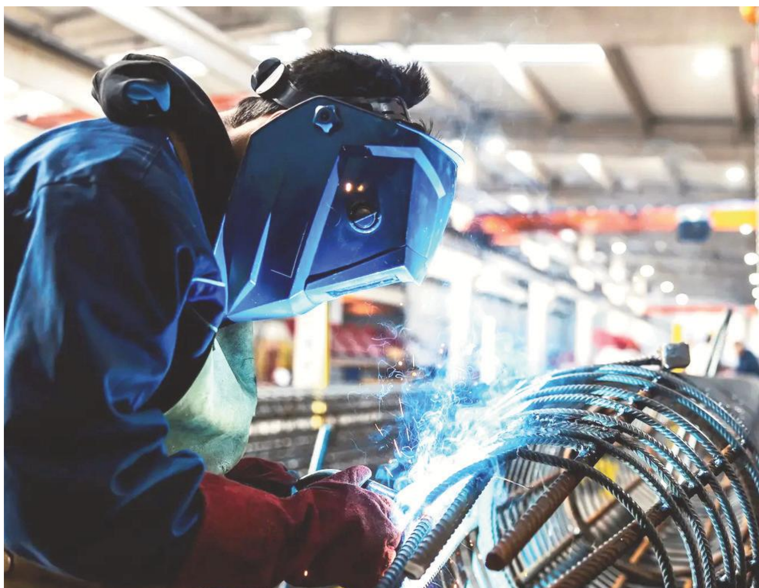
Los datos fueron relevados, elaborados e informados por la Asociación de Industriales Metalúrgicos de la República Argentina (Adimra).

estratégica por su vínculo con la producción automotriz, maquinaria, construcción, energía, equipamiento médico e infraestructura. Por eso, la continuidad de indicadores negativos es seguida de cerca como señal de la salud general del entramado industrial.