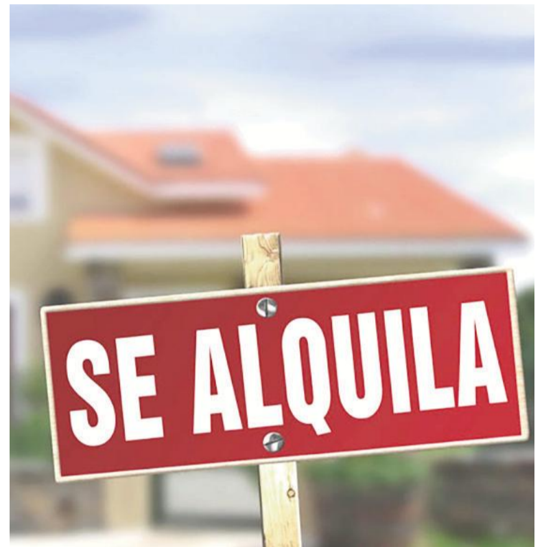
En un contexto complejo, los inquilinos se esfuerzan para mantener al día sus alquileres familiares.

En cuanto al precio de los alquileres, sostuvo que “las actualizaciones –en líneas generales, porque hay libertad de convenir– se hacen cuatrimestrales en mayor medida y trimestrales en menor medida según el índice del ICL, que hoy ronda el 8 o 9 por ciento cuatrimestral”. “Es algo que el inquilino medianamente puede ir soportando. Pero al momento de vencer el contrato y renovar, generalmente no se aplica ese porcentaje, sino un porcentaje un poco mayor, para corregir la ren-