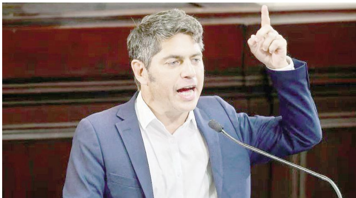
El gobernador bonaerense Axel Kicillof.

Ocurre que, en 2024 y a través de un decreto, el gobierno de Javier Milei suspendió las transferencias de la entidad nacional a las provincias destinadas a cubrir los déficit de las diversas cajas jubilatorias. Ese decreto es el que el gobierno de Kicillof cuestiona en sede judicial, buscando que se declare inconstitucional.