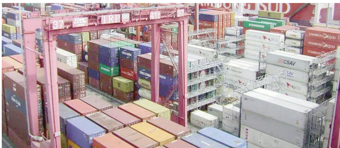
Las exportaciones subieron 30,1%.

Por otro lado, el intercambio comercial aumentó 16,6% en relación a marzo de 2025 y así llegó a un total de 14.766 millones de dólares. Las