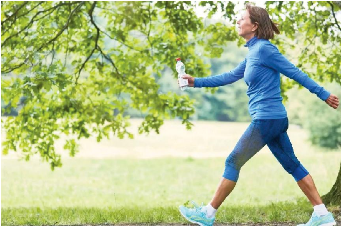
Caminar favorece el control del peso y la reducción de grasa corporal, según estudios médicos recientes.

Desde el punto de vista fisiológico, caminar activa los principales grupos musculares, incrementa el gasto calórico y exige adaptaciones metabólicas. Esta práctica es accesible para la mayoría de las personas, ya que no sobrecarga músculos ni articulaciones, según la Escuela de