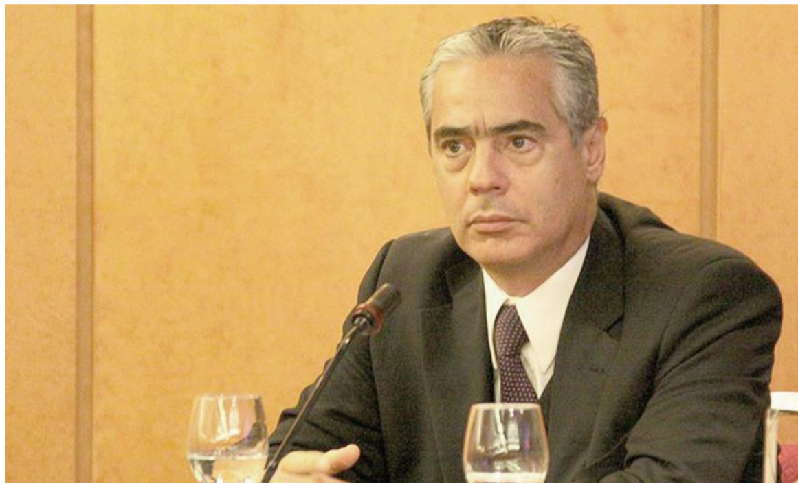
Sergio Torres asumió la presidencia de la Suprema Corte bonaerense.

Este sistema de "presidencias rotativas" busca garantizar que la administración del sistema de justicia bonaerense —el más extenso de la Argentina— mantenga un equilibrio interno y una continuidad que trascienda