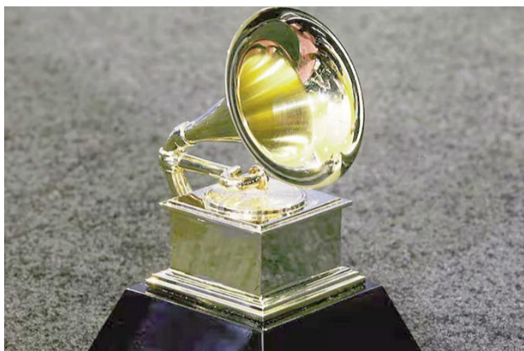
Hace dos años, una canción generada por IA se presentó como candidata a la premiación de los Grammy 2024.