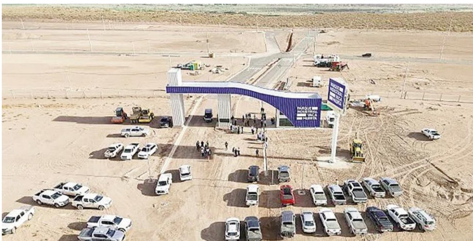
Se profundiza la división entre sectores de la economía con mayor potencial exportador.

Actualmente, la composición del empleo registrado privado muestra el siguiente peso por actividad: