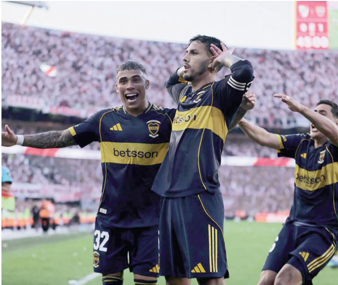
El Xeneize logró la victoria en un intenso partido.

En el segundo y último minuto de descuento de la primera etapa, una mano extendida de Lautaro Rivero dentro del área que cortó un centro de Merentiel generó un penal para el equipo de la ribera. Lo ejecutó Paredes con un gran remate que entró por el ángulo iz-