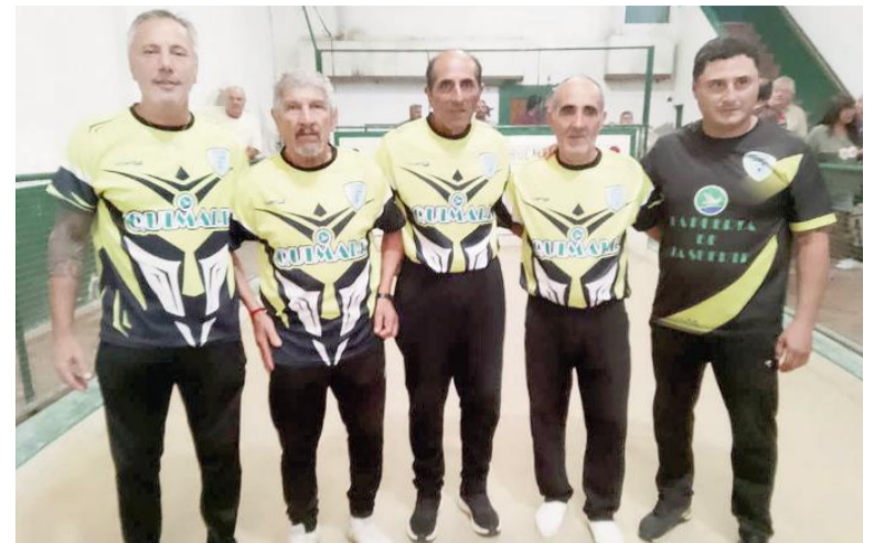
El equipo campeón de Los Toldos. EL NORTE