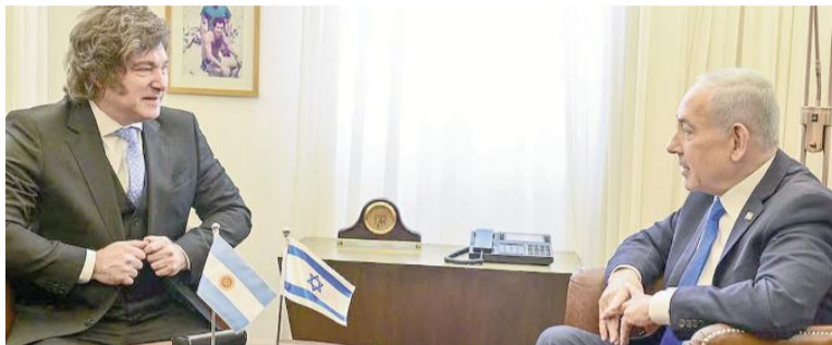
Milei y Netanyahu se reunieron en Jerusalén.

"No es simplemente un amigo personal y alguien a quien admiro profundamente. Es un gran líder, un gran líder económico y un gran líder mundial. También tiene un significado especial la visita porque es la primera vez en la historia de Israel, en setenta y ocho años, que otorgamos a un líder extranjero el honor de encender una