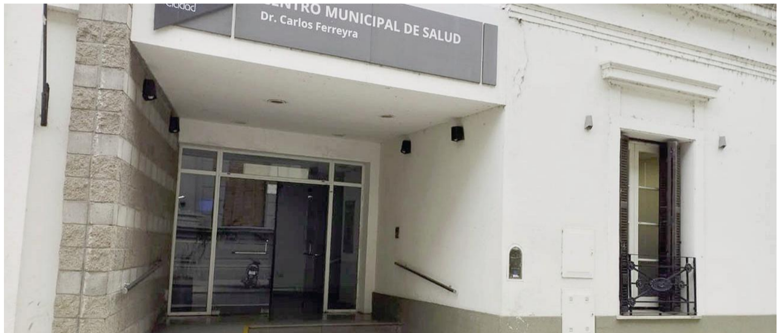
Trabajadores del Cempre afirman que ya este lunes no habrá servicio de vacunación en ese centro sanitario.

Tal como informara EL NORTE días atrás, todos los servicios del Centro de Medicina Preventiva municipal (Cempre) ubicado en Pellegrini 111 son trasladados, de manera gradual y progresiva, al Hospital Zona Norte. El último de ellos sería el vacunatorio, una de las atenciones más requeridas por las familias –especialmente niños pequeños y adultos mayores– que acuden al lugar para recibir las diversas inmunizaciones gratuitas correspondientes al calendario nacional obligatorio. Aunque sin confirmación oficial, trabajadores del área aseguran que el servicio del vacunatorio ya no brindará atención en el Cempre la semana que se inicia. “Desde el lunes 20 de abril ya no habrá servicio de vacunatorio