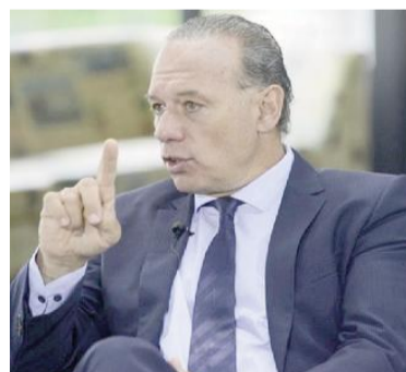
El senador provincial Sergio Berni.

inclinado a que haya una disputa interna en el peronismo a través de elecciones primarias, en lugar de una lista única encolumnada detrás de Massa.