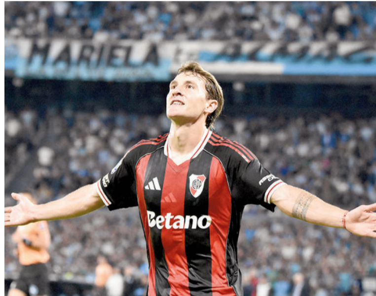
El millonario consiguió una resonante victoria en el clásico.