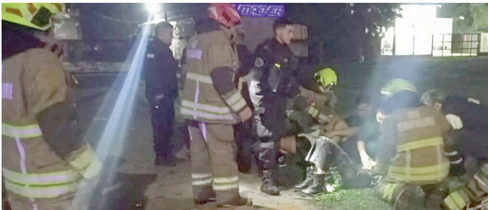
Tres nicoleños sufrieron heridas tras volcar el auto en que se trasladaban.

Un automóvil Peugeot volcó ayer a la madrugada en la Ruta 90, a la altura del acceso a Empalme Villa Constitución, y dejó como saldo tres jóvenes oriundos de San Nicolás heridos, uno de ellos en estado de gravedad. El hecho ocurrió cerca de las 6 de la mañana y generó un amplio operativo de emergencia en la zona. Según informó el portal El Tigre de Papel, al lugar acudieron efectivos policiales, personal del SIES y dos dotaciones de Bomberos Voluntarios de Empalme. Los rescatistas realizaron tareas de extracción vehicular para retirar a los ocupantes del interior del rodado. El conductor, de 29 años, fue trasladado a un efector de salud junto a sus dos acompañantes, de 22 y 23 años. Las autoridades no brindaron mayores precisiones sobre las causas del vuelco, mientras se avanza con las actuaciones correspondientes.