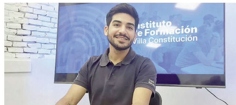
El secretario de Producción y Desarrollo Económico, Gastón Salinas.

Los primeros cuatro cursos ya están disponibles y son totalmente gratuitos. Se trata de inteligencia artificial, operario de carnicería, diseño gráfico con dos niveles (Canva e Illustrator). Las inscripciones se habilitaron al principio de esta semana y se pueden realizar de dos maneras: de forma virtual a través de las redes sociales del municipio o la página oficial del instituto ( ifvillaconstitucion.com ), o de manera presencial en el edificio, de 8 a 13 horas. Salinas remarcó que cada persona podrá inscribirse únicamente en un solo curso,