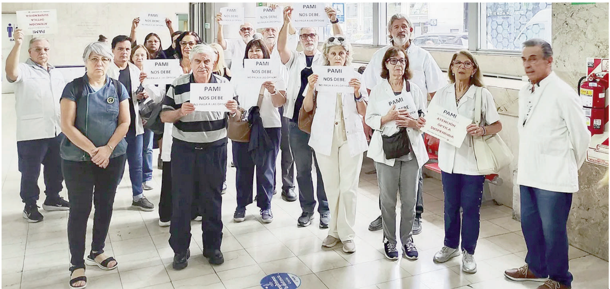
Días atrás, un grupo de 27 profesionales se presentó en las oficinas centrales de PAMI para reclamar el pago de prestaciones.