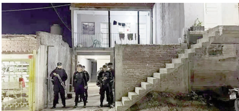
Tras una ráfaga de disparos en una vivienda de la calle Santa Matilde, un hombre de 34 años falleció y un joven resultó herido.

Fuentes policiales confirmaron que dos de los agresores descendieron de los vehículos, ingresaron a la propiedad y "efectuaron los disparos mientras las víctimas estaban en la habitación". Tras el arribo del personal del Comando Ra-