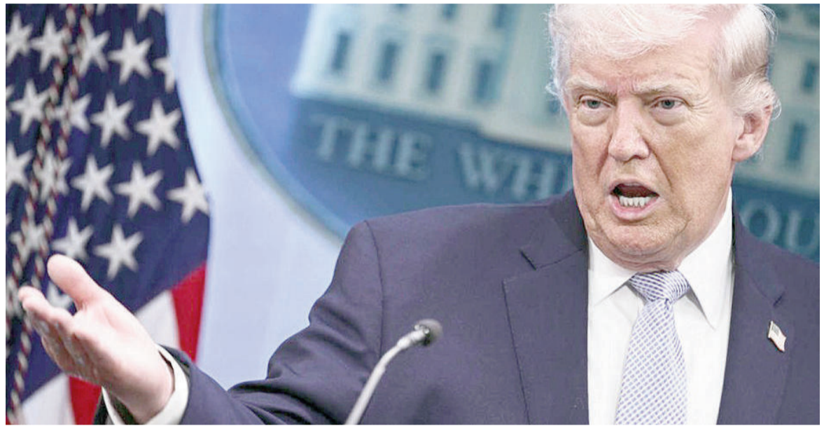
Donald Trump decidió, también, bloquear el estrecho de Ormuz.

En su segunda publicación, el presidente fue más detallado. Dijo haber sido informado por el vicepresidente JD Vance, el enviado especial Steve