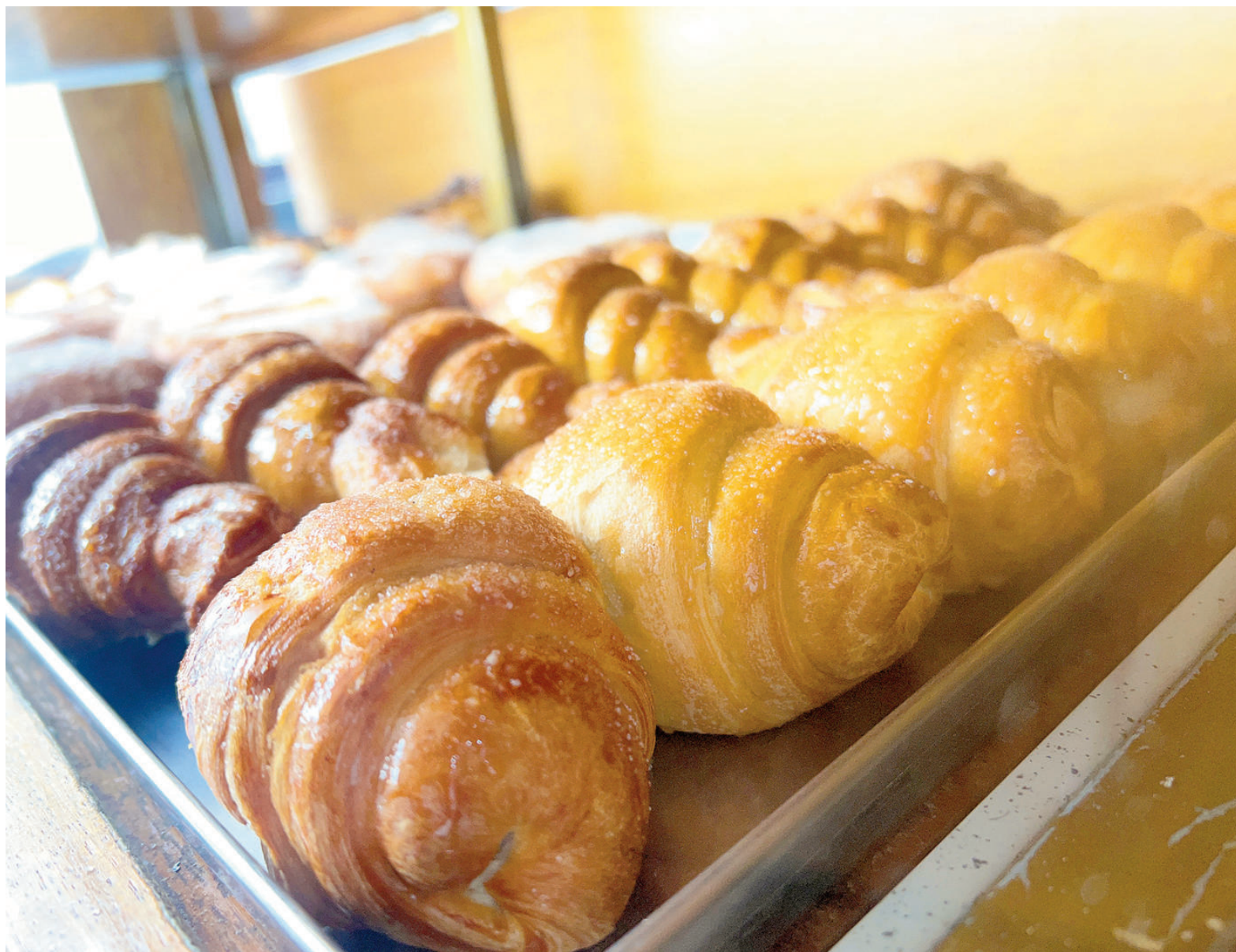
“Desde noviembre, el consumo de pan y facturas registra una caída del 50%”, precisaron desde uno de los locales.

Sobre los factores que inciden en la baja del consumo, lo atribuyen a la situación económica general. “En vez de comprar por peso, ahora te piden mil pesos de pan, por ejemplo, o cuatro facturas. La gente ve lo que tiene en la billetera. Y al mismo tiempo, a principio de mes, el consumo es más regular, y ya decae después