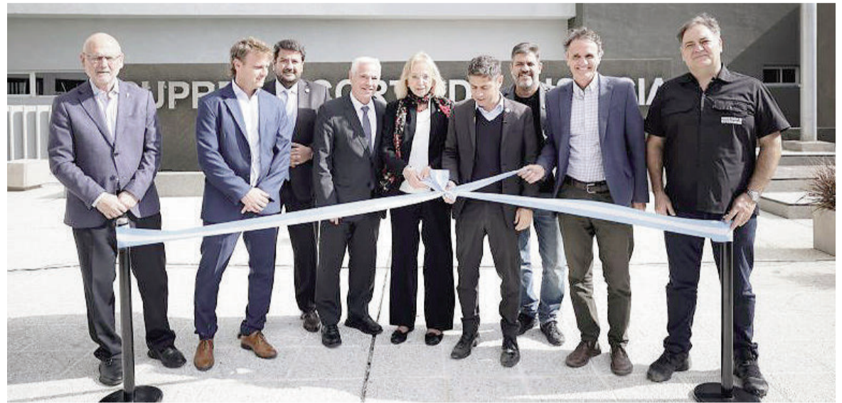
El gobernador le hizo el reclamo a la Corte desde Olavarría.

En esa línea, Kicillof sentenció: "Vengo a celebrar que recorrimos este edificio, estaba la obra parada desde 2018. Cuando se pone lo que