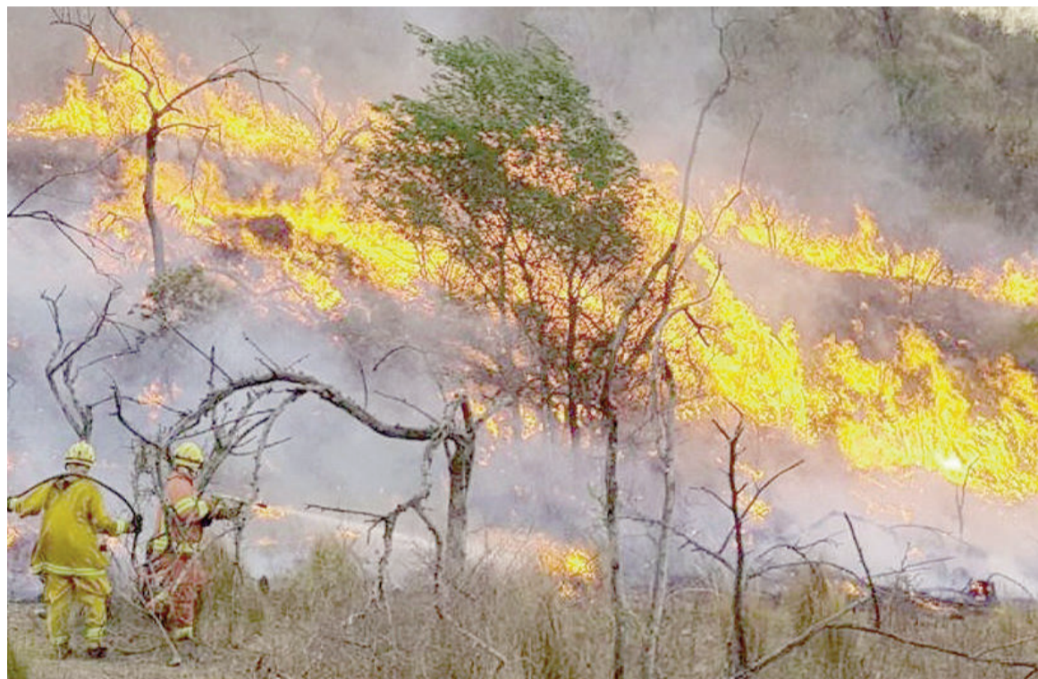
La intensificación de los incendios forestales en Sudamérica pone en grave peligro la biodiversidad regional y mundial.

Forman parte de la Universidad de Gotemburgo, Suecia, la Universidad de Connecticut, en los Estados Unidos, y la Universidad Tsinghua en Pekín, China, entre otras instituciones. El aumento de la frecuencia de los incendios de vegetación representa una amenaza directa para