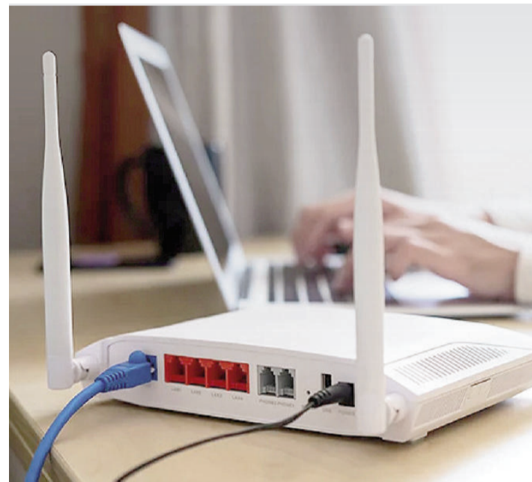
No solo los electrodomésticos afectan la señal de wifi.

El problema suele hacerse evidente en habitaciones alejadas o