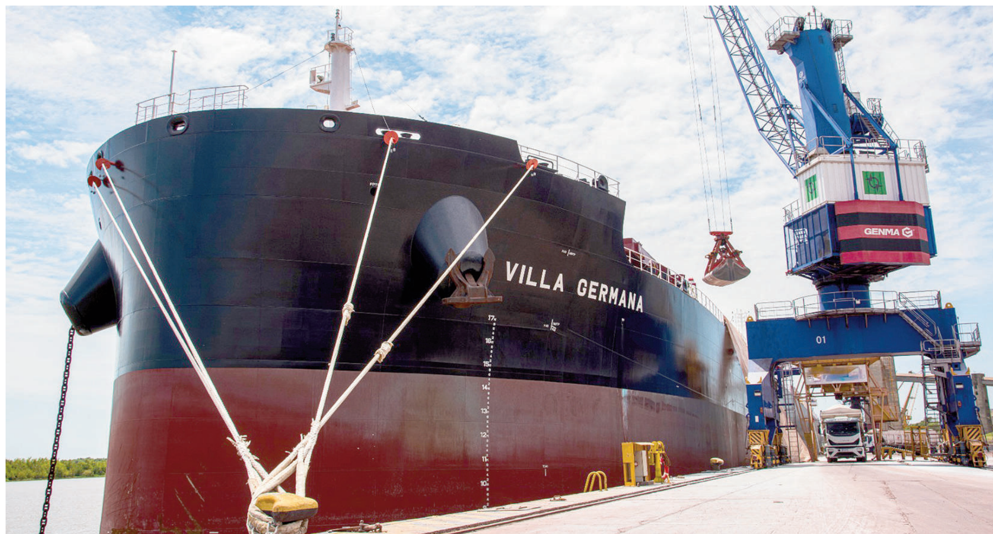
Considerado por tipos de cargas, el puerto de San Nicolás volvió a ser por lejos el más destacado en operación de fertilizantes.

Durante el año que pasó, en los puertos bonaerenses se movilaron 3,3 millones de toneladas de fertilizantes. De ese total, más de 2,3 millones se operaron en el puerto de San Nicolás. A nivel general, la terminal local aportó el 5,15% de las cargas y descargas de cualquier tipo de mercadería. De enero a diciembre atracaron en el muelle nicoleño 521 buques: un 42,3% más respecto de los 366 que habían llegado en 2024.