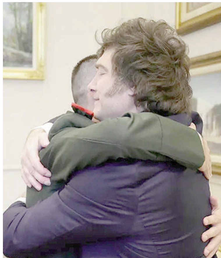
El abrazo de Milei y Gallo.

El cónclave entre el jefe de Estado y el gendarme se postergó sin explicaciones por parte de la gestión Milei. "En algún momento va a ocurrir la reunión, pero ahora tiene que estar