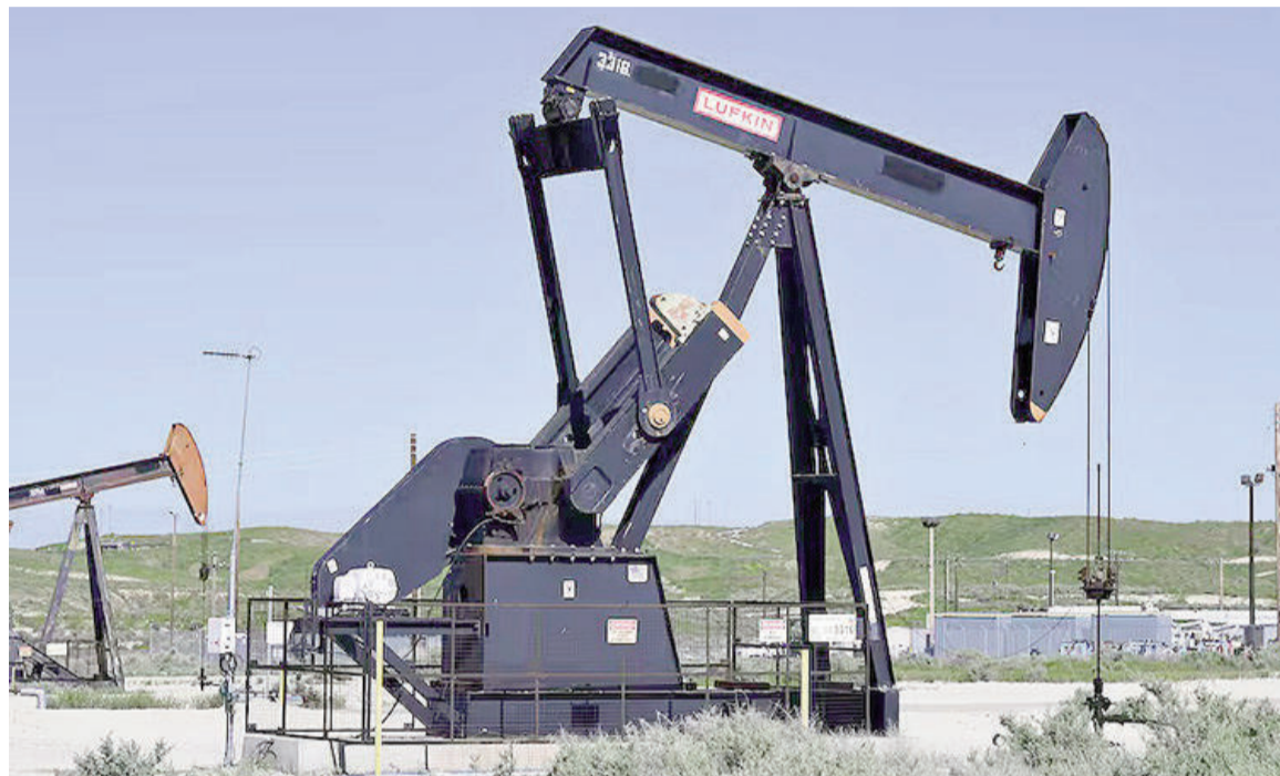
El precio del petróleo se desplomó tras el alto el fuego.

Tan pronto como ambas autoridades confirmaron el entendimiento, el precio del barril de Brent (de referencia para las naftas argentinas)